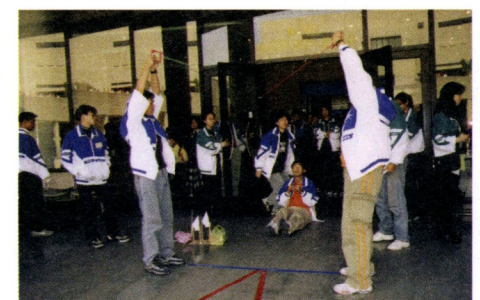
教育學程科創志工辦理活動之情形