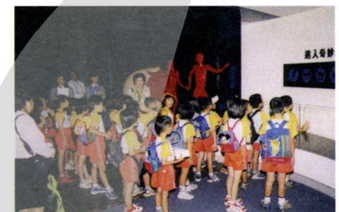
導覽志工之服務情形

教育學程科創志工是運用大專院校設有教育學程之學生，每年徵募一次，約四十位。以全年度科技創作競賽或動手做研習之內容為課程主軸，經兩天集訓後建檔備勤。當博物館開始辦理「科技創作」活動時即排班擔任輔導員。全年約需八至十次，凡服勤達到規定，期滿致送「公共服務證明」。