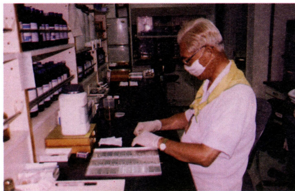
非展區志工之值勤情形

為加強對特殊兒童觀眾的服務，特別邀請特殊學校之教師或專業人員到館講授服務技巧，共五梯次。