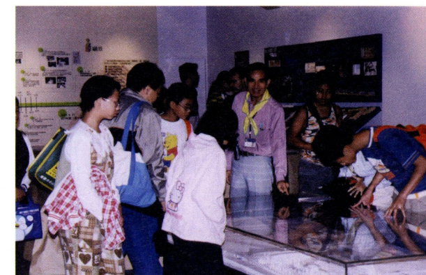
志工在921地震教育園區影像館導覽之情形

科博館自館舍全部建設完成以來，每年都有二百五十萬至三百萬的參觀人次，今年曾被觀光局稱譽為博物館類最有人氣的文教機構(聯合報，2004)，名聲雖好，但近年在政府執行組織調整、精減人員的政策下，更顯現營運人力的壓力。科博館籌備時就已預想，博物館會隨著時代的進展與政府財政和施政的一貫思維，勢必面臨人力精減的命運，所以七十五年第一期開放當初，即決定大量運用社會人力資源，協助各類館務的推展，迄今志工的服務範圍包含了觀眾服務、導覽解說、教育輔導、行政支援及標本蒐藏等項目，人力配置廣達四十多個工作點，運用的志工分為一般個人志工、高中志工、專案志工、大專見習生、團體志工(彰化師大推廣教育服務社、中山醫學院社會醫療服務隊及台積電文教基金會)等類型。以九十二年度為例，運用的志工約有八百多人，總值勤時數達一一三、七四二小時，相當有酬人力五六、四人，除了融入本館日常的