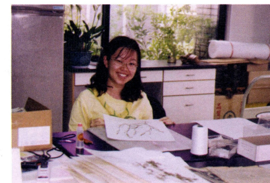
志工協助製作葉片標本

民國七十五年因應初期開館時不足的服務人力以及想建立積極性與觀眾互動的管道，參考國內外文教機構運用志工之情形草擬實施方案，最初規劃的需求人數是87人(5區)，經宣傳後應徵人數高達474人，最後增加錄取名額，共錄用312人(11區)。最