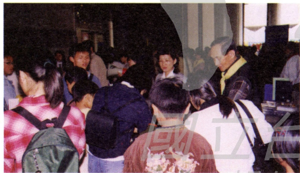
服務台志工之服務情形

彰化師大離科博館約一小時車程，學生亦曾經應徵並擔任義工，惟因車程與學生課業、社團活動諸多因素，學生常有缺班之情形，因此後來該校學生被錄取為志工者少，所以才嘗試找出雙方可以長期合作的方案，終於在民國八十三年由科博館輔導彰化師大學生在校成立社團，招募具生物背景的學生，經組訓與驗收後，在開學期間利用週日，到博物館的環境科學廳芸象展示區從事展品解說工作，上、下午每一時段認養兩個解說人力，負責四場次的解說。每位社員到博物館服勤平均每學期須排兩個半日，連續一學年。社員服務滿一年後，由該社團推薦至國立鳳凰谷鳥園擔任戶外解說志工，接受四天三