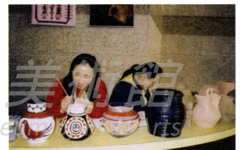
製陶志工在現場為觀眾演示