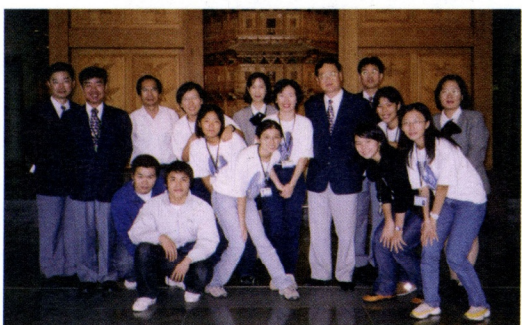
實習生在期末討論會後合影

五、大專學生見習與實習：凡對本館蒐藏研究(動物、植物、地質、人類學)、典藏管理、展示、科學教育、資訊圖書與營運管理等實務工作有興趣之大專學生皆可申請，須經各學域或組室之專職人員面談，名額不限。