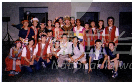
高中學生志工參與原住民舞蹈表演

因為科博館徵募志工的最低年齡為十八歲以上，故高中學生幾乎沒有機會，惟寒暑假期間，每有家長為其子女探詢或建議開放讓高中生有機會擔任志工，以便安排假期、獲得學習成長與服務的經驗。或高中生來館參觀，有時也會提出此項需求，希望能參與博物館的服務。另一項影響因素是本館寒暑假期間，家庭主婦、退休人士身份之志工常因子女在家或安排出國，或大專學生休假返鄉，以致請假狀況增加許多，而展場的觀眾服務尤受影響。所以引進當時位在台中市的四省中學生，期盼彌補人力的短暫缺口，服務內容以支援服務台的觀眾服務事項為主，近年來則在特別活動和舞台表演方面發揮其活力，帶動觀眾的熱情。值班的安排：高一時在寒假時出動四天(一天以八小時計)；高一升高二的暑假時出動八天；最後在高二的寒假時排定二至三天。從民國七十八年設立，人數從24人增至32人，平均每年提供服務的時間2372小時。後來教育當局提倡服務學習的理念，甚至有的縣市或學校規定學生一學期必須參與服務達一定時數，所以又在九十二年規劃增加學期中高中生公共服務的項目，名額有五十四人。參與的高中學生可以獲得知性的假期生活、個人學習與服務社會的機會；高中學生透過在博物館服務的歷程，澄清和確定自己的性向和升學的目標，在時間管理的技巧也更加純熟。科博館則增加了寒暑假和星期假日的觀眾服務人力。並與高中學生自然科學類社團合作，請其推薦優秀社員參加，建立長期的聯繫網絡。