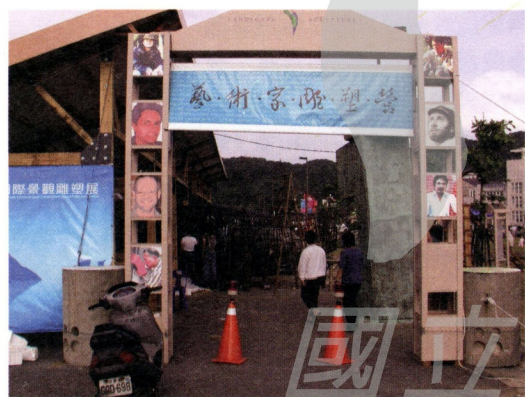
金山國際雕塑營藝術家的工作現場