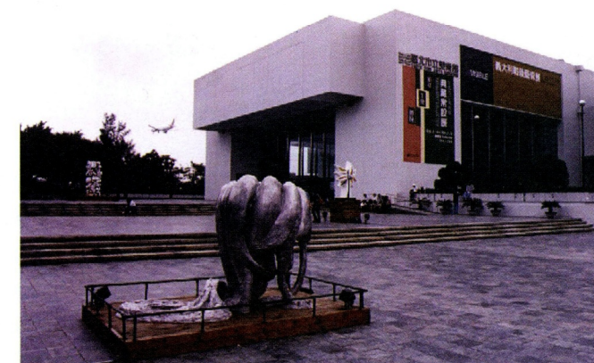
北美館中山公園「雕塑之野」展出Louise Bourgeois的作品