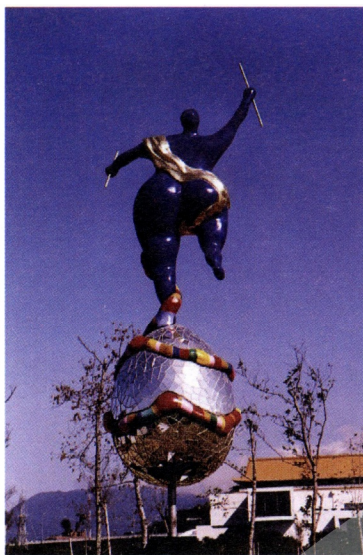
北美館中山公園「雕塑之野」展出Niki de Saint Phalle的作品