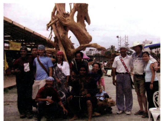
花蓮漂流木國際雕塑營參與的國內外藝術家

因此，主辦單位以邀請重要貴賓來開幕的方式，帶動媒體宣傳，吸引人潮。開幕當天除了邀請到副總統呂秀蓮來開幕致詞之外，還有許多的駐外代表也出席，讓整個活動非常熱鬧、圓滿成功。