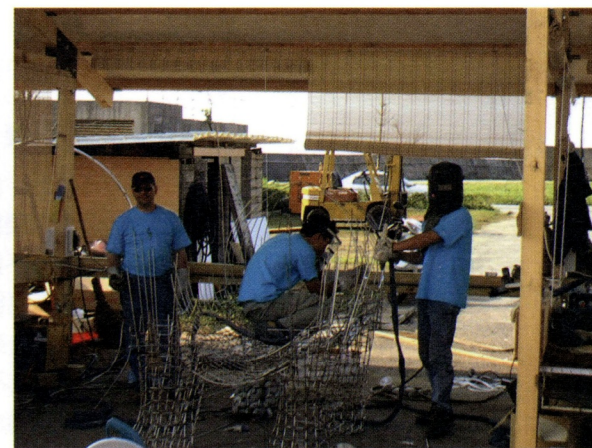
「金山國際雕塑營」加拿大藝術家工作狀況