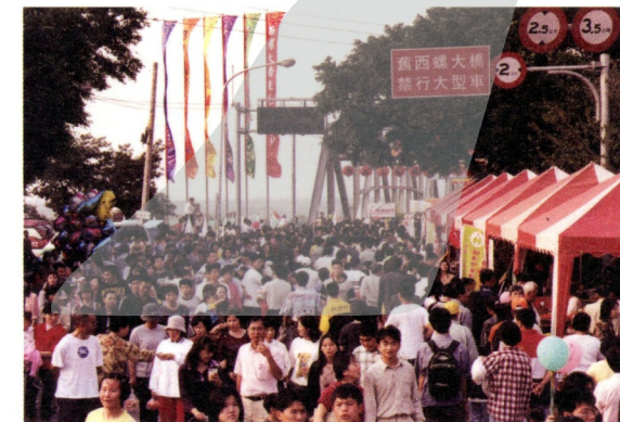
2001年西螺大橋戶外雕塑大展因為過多的參觀人潮，無法看到雕塑作品

事實上，策劃任何一個展覽都是一種新的體驗，許多的經驗之談只能作為參考，幫助減少錯誤和疏失。不過，在策劃展覽活動的過程中，除了要天時、地利與人和之外，最重要的是必須要有細密的心思、超強的溝通能力、配合有默契的工作團隊，並勇於發揮想像力和創意，才能策劃出一個成功的展覽和活動。