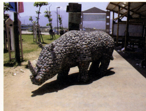
「金山國際雕塑營」加拿大藝術家的完成作品

至於記者會則要考慮選定適當的時間，不要與其他重要活動的記者會重疊，不要在早上太早的時間，記者起不來無法出席，也不要下午太晚的時候，記者來不及發稿。在新聞稿和記者會上，必須凸顯展覽活動的新聞焦點，讓記者能夠寫出精彩的報導。此外，展覽開幕的邀請來賓，也會是媒體開幕報導的重點之一，因此，如果能夠邀請到重量級的來賓來開幕，也將有助於媒體文宣。同時，在開幕時，如果能邀請一些資深的全國版記者來參加，也將有助於全國性的媒體宣傳。