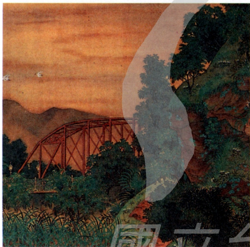
圖6 郭雪湖 圓山附近(局部) Fig. 6 Kuo Hsueh-hu Scenery near Yuan Shan (detailed)

首先，很明顯而引人注意的是畫面左方的鐵橋（圖6），即所謂的第一代明治橋，這是一般傳統山水畫中不太可能出現的景物（尤其還有鐵架和銅製路燈的現代化事物）。這座第一代明治橋是鐵製桁架橋（圖7），落成於明治34年（1901年），最初橋面為木造，但郭雪湖畫的時候已改建為鋼筋混凝土橋面（1912年翻修）。就在郭雪湖畫下這幅《圓山附近》過後兩年，即昭和5年（1930年）時，新一代的鋼筋混凝土拱橋也開始興建，並於1933年落成啓用，是為第二代明治橋（圖8），並沿用至戰後（後改稱中山橋），直至2002年底被台北市政府認定妨礙水流而遭拆毀。郭雪湖的《橋畔春雷》（1932）當中出現的就是這座第二代明治橋（圖9）。在《圓山附近》當中，這座鐵橋因近半橋身隱身於山丘之後，故不致太過顯眼而喧賓奪主，或與周遭田園景色不相協調。然而，我們仍可看到這座象徵現代文明的建物出現在此地，而窺知社會之變貌。更且，這座橫跨基隆河之上的明治橋，北連