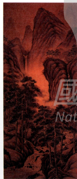
圖1 郭雪湖 松壑飛泉 Fig.1 Kuo Hsueh-hu Stream through Pine Ravine

這兩件作品最大的不同，乃在於《圓山附近》是出於寫生，《松壑飛泉》則非。試想，台灣何處可尋得《松壑飛泉》當中的景色？況且，此作之圖像仍大致為傳統水墨畫體系中的符號能指，如松、泉、山、林、怪石和繚繞的雲霧等，皆為文人畫尋常可見之圖像符碼，其表現意