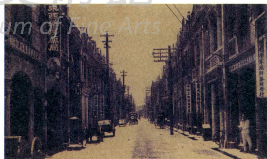
圖11 台北市永樂町 Fig. 11 Yo-Lo District in Taipei City