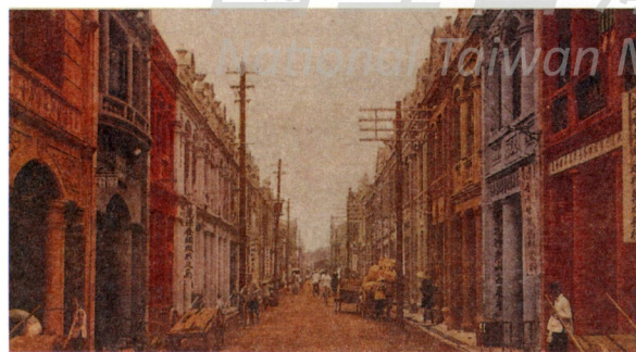
圖10 大稻埕南街道 Fig. 10 The south area of DaDaoCheng

由此畫家的身上我們可以看到，以空間上和意識上相隔之觀察者的距離作為審美的前提，不僅自然可以化為風景，人類的社會生活也能夠成為畫家筆下的人文風貌。而且，這種現代的審美態度，正如他半日式、半西化而非傳統唐裝的衣著打扮（足履日本木屐、穿西褲、打蝴蝶結）所示，乃是透過日本之引介而得來的現代意識。不過，這裡的畫家與自然、畫家與社會之間的風景關係，儘管是經過審美意識之中介，但主客體之間仍維持著一定的聯繫關係。畫家雖以客觀觀察者的身分面對著對象客體，意圖透過寫生將之再現於畫布上，但他仍不能無視於客體的社會意義及其生活的社會場域，而有某種程度之社會參與性，嘗試在作品中表達特定的社會意涵——即如謝里法所言，以此