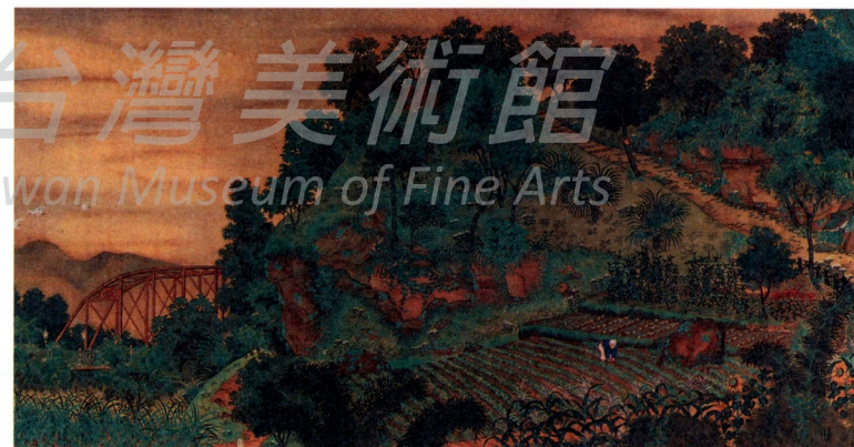
圖2 郭雪湖 圓山附近 Fig.2 Kuo Hsueh-hu Scenery near Yuan Shan