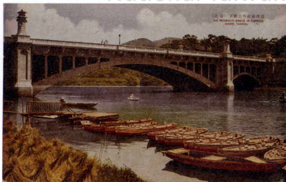
圖8 第二代明治橋 Fig. 8 The second generation of Meiji Bridge