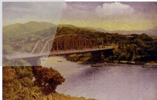
圖7 第一代明治橋 Fig. 7 The first generation of Meiji Bridge