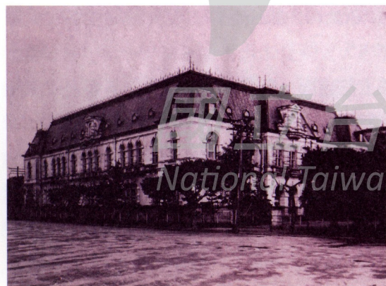
圖3 總督府圖書館外觀 Fig. 3 The outward appearance of the Taiwan Governor's Library

儘管日治時期的藝術展覽活動尚未有專門的美術館，但此種強調公共性與展示教育作用的視覺文化確實已在台灣日漸生根。就在總督府圖書館開館的1915年，台灣總督府博物館（全稱為「台灣總