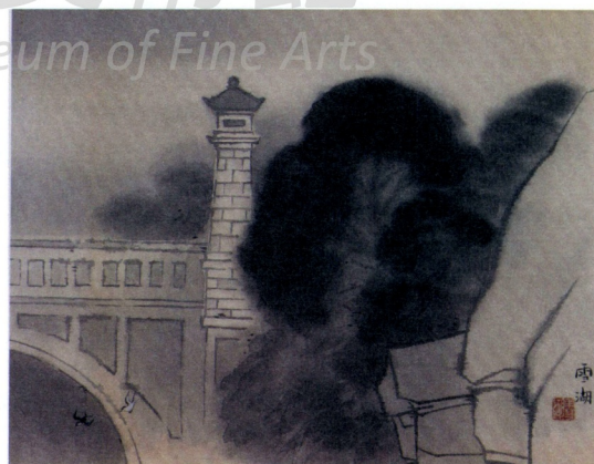
圖9 郭雪湖 橋畔春雷 Fig. 9 Kuo Hsueh-hu Spring Thunder near Bridge

台灣神社、南接圓山公園，而神社與公園亦為日人來台後所闢建，亦不難想見當地地景的改變。