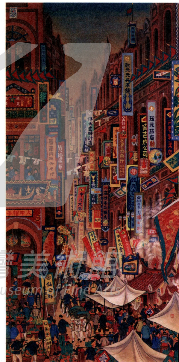
圖12 郭雪湖 南街殷賑 Fig. 12 Kuo, Hsueh-hu, "Prosperous Nan Street"

《南街殷賑》描繪的街景所在是大稻埕的永樂町三丁目（即1920年市街改正前的「南街」，當地人亦習慣此稱呼），也就是我們今日所熟知的迪化街。由日治時期發行的風景明信片中的照片（如圖10、圖11 19 ）加以比對，特別是對照商店的招牌，即可知大致取景之處（大約爲民生西路以南的迪化街路段）。在日治之前，大稻埕本來就是商業極爲繁榮的地區，特別是茶葉、南北貨和藥材的貿易尤爲興盛。日治時期，由於對日貿易和紡織布市的興起，更使此地蓬勃發展，尤其迪化街一帶更成爲當時台北乃至全台灣最繁華的市街。由《南街殷賑》（圖12）看來，其繁榮程度確實可以想見。