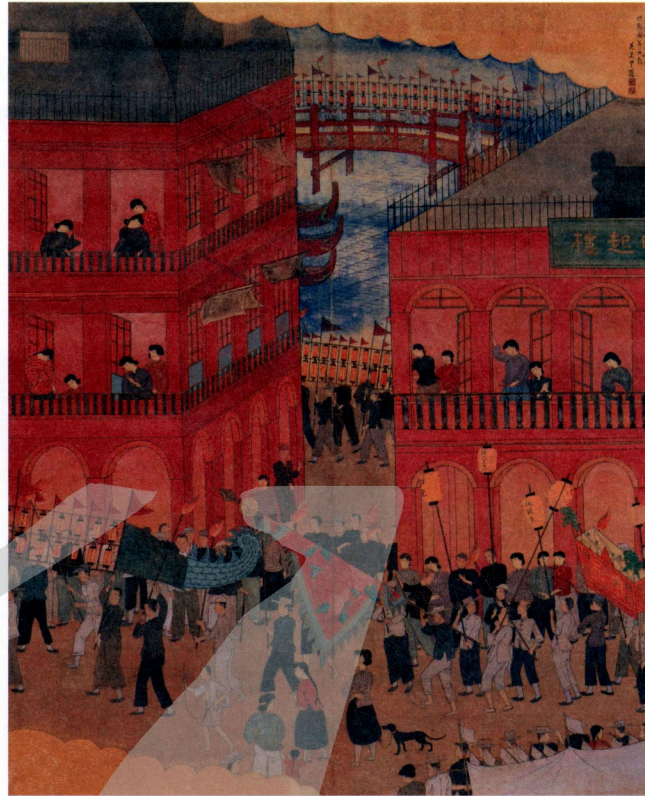
圖13 村上無羅 基隆燃放水燈 Fig. 13 Muragami Hideo (Mura), "The Zhongyuan Ghost Festival in Keelung"

至於多元性，我們可以見到有本地所產之農產品（香蕉、鳳梨等水果，還有招牌上的木瓜糖和蜜餞等）和各式特色商品（如「大甲帽子」、「蓬萊名產 竹細工品」等），乃至兼售原住民與日本特產禮品的商店（「蕃產內地みやげ」），以及種種進口貨品（如虎標萬金油和廣東雜貨等）。店招