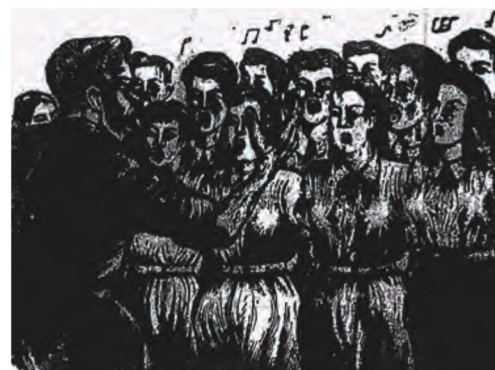
圖6 方向 反攻大合唱 1950 木刻版畫

運用木刻版畫以作為反共抗俄的宣傳，方向《反攻大合唱》（圖6）一作，以男女眾人兩列共同合唱，他們精神抖擻，表情姿態有的專注指揮，有的仰頭高歌，有的嘴型大開全心投入，為鼓舞反共信念，歌聲中或壯闊豪邁或思鄉情切，盡是為團結反攻大陸而唱。