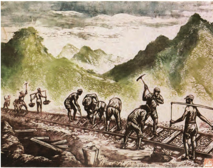
圖9 方向 克難 1953 木刻版畫 20.2×14.7公分 (圖片來源：黃鈺琴策畫編輯，《由繁化簡：方向作品捐贈展》，臺中，國立臺灣美術館，2009年，頁39。)