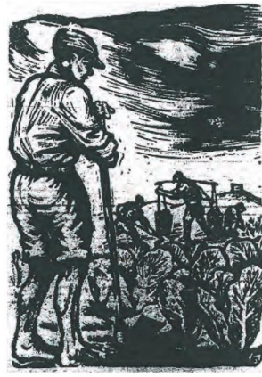
圖12 方向 勞動生產 1950 木刻版畫

此外，方向作有《蘇花線上》（圖11）。蘇花公路綿延於臺灣東海岸，設置的淵源可追溯到清朝，經日據時期修築，在戰後初期，國民政府將其拓寬為柏油路。