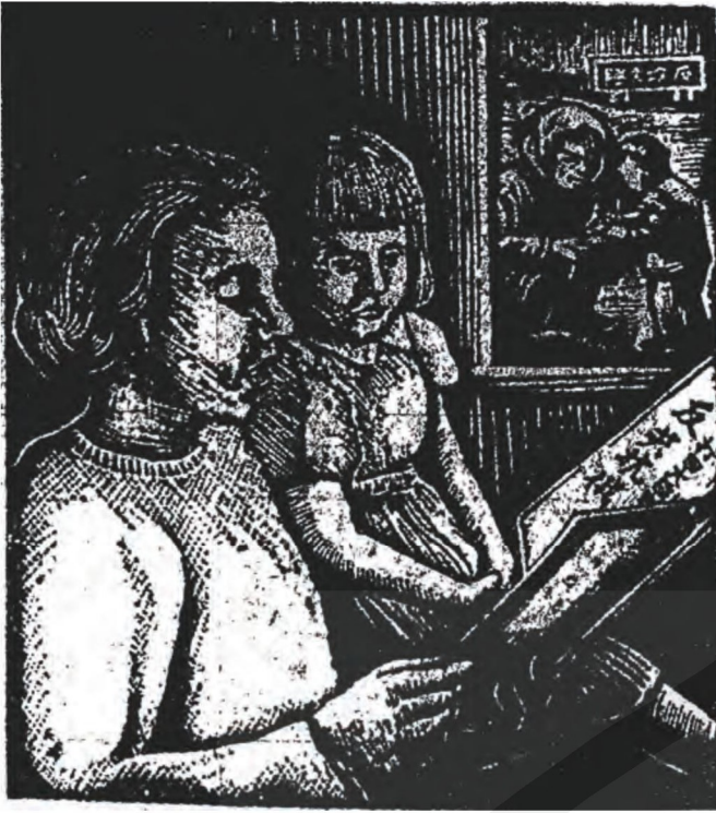
圖8 張俊 新時代的兒童教育 1952 木刻版畫 (圖片來源：《台灣新生報》，1952年2月25日，6版。)

轉移社會風氣，藉以達成救國建國之時代使命。」 60 而同年11月經修訂、公佈實施的國語科課程標準有「教材的選擇，注重有關激發民族精神，增強反共抗俄意識，闡揚三民主義方面的材料」；而社會科要注重「歷史及地理教材，注重俄帝侵略我國的史實，以加強反共抗俄的意識」 61 。在藉由教材的選擇與教育的灌輸，達到宣揚三民主義和反共抗俄意識的目標。