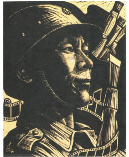
圖3 方向 文藝戰士 1951 木刻版畫 20.8×16.3 公分

另一幅亦為陳其茂所作的《藍天白雲》(圖5)，作者採對角線構圖，刻繪出總統府的屋頂圖像與大片的天空。畫面中的總統府以背光處理，使矗立的建築帶有剪影的含蓄，雖僅佔畫面約三分之一大小，但面迎的遼闊天際，卻使人對未來充滿光明的希望。畫面中央上部，多架戰機騰空呼嘯而過，宛若節慶般的喝彩，更宣揚愛國和護衛家園之心。此小幅木刻，運用黑白對比與虛實相映，強化建築體的存在感，也讓人對未來昂然盼望。