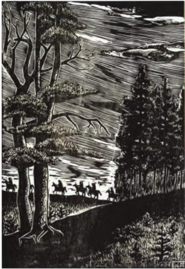
圖4 陳其茂 騎兵隊 1955 木刻版畫 21×15公分