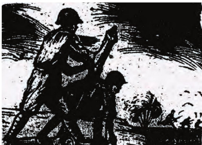
圖1 方向 向侵略者開炮 1950 木刻版畫