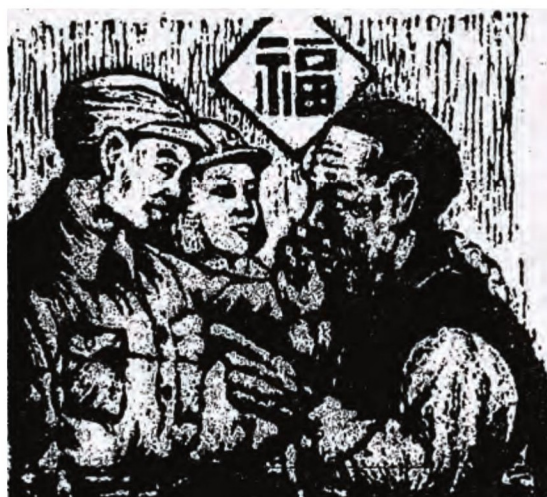
圖2 方向 光榮的爸爸 1950 木刻版畫