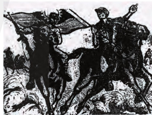
圖7 方向 反攻大陸 1950 木刻版畫