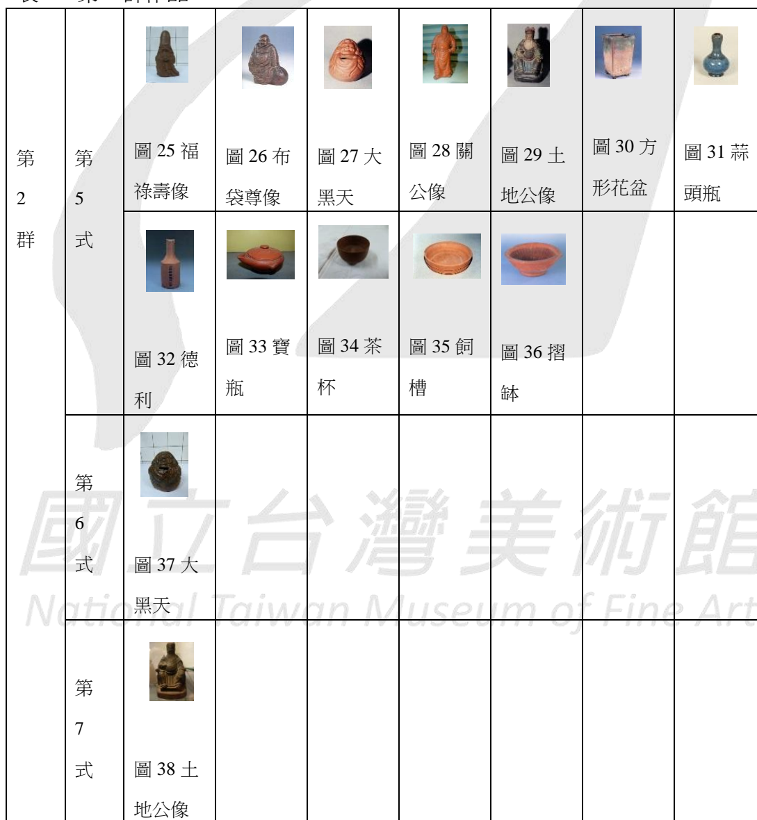
表 4 第 2 群作品

第 2 群從第 5 式到第 8 式共有 4 式，都落「南投燒」3 字，只是字體與外框形式不同而已。此群作品數量以第 5 式的 12 件為最多，其餘各式各只有 1 件而已，附照片的作品共有 15 件，各式作品列於表 4。