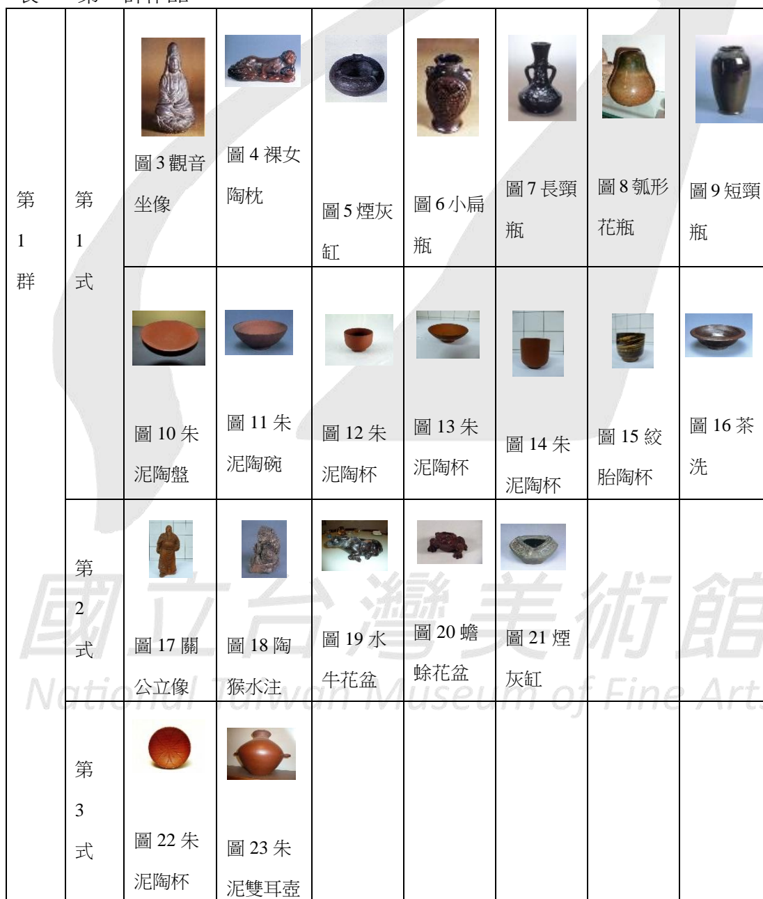
表 2 第 1 群作品

現在將這些文物依其落款，分別歸入各式各群之下。第 1 群 4 式的文字內容分別為「南投燒劉」、「南投燒印劉」、「劉樹枝製」以及「台灣 劉樹枝 南投」等，都與劉樹枝所創的「協德陶器工場」有關。為了方便綜覽全貌，將各式的作品列於表 2：