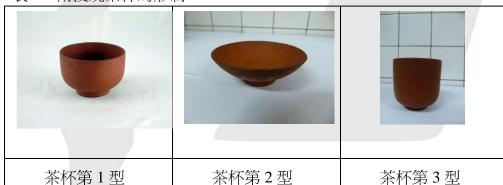
表 3 南投燒茶杯的形制

圖 12 茶杯為第 1 型造形，無釉。圖 13 為第 2 型的茶杯，坯體較薄，全器沒有施釉。器壁外以逆時針方向書寫一環楷體「昭和八年七月新高登山記念」，器內書寫「二千五百九十二年紀念 1932」。昭和 8 年為 1933 年，與內面所寫的 1932 年有所出入。若以當時民眾的習慣，應以昭和年代較為常用，因此推論此件陶杯應作於 1933 年，而非 1932 年。另 1 件第 2 型的茶杯（圖 22），落第 3 式圓形隸書「劉樹枝製」4 字 2 行印款，坯體雖然屬於朱泥質，但是含有許多細小的鐵斑，器體內面以刀具線刻 6 瓣櫻花紋，花瓣末端呈 V 字形，中間加上長 T 字形的花蕊，線條稜角明顯。器背有一圈「昭和九年六月十九日 新高登山紀念」等銘款。它與第 1 式圖 13 的茶杯形制相同，功能也相似，都作為紀念品用，只是創作時間上晚了一年。器底印有「劉樹枝製」圓形款。圖 14 為第 3 型的茶杯，