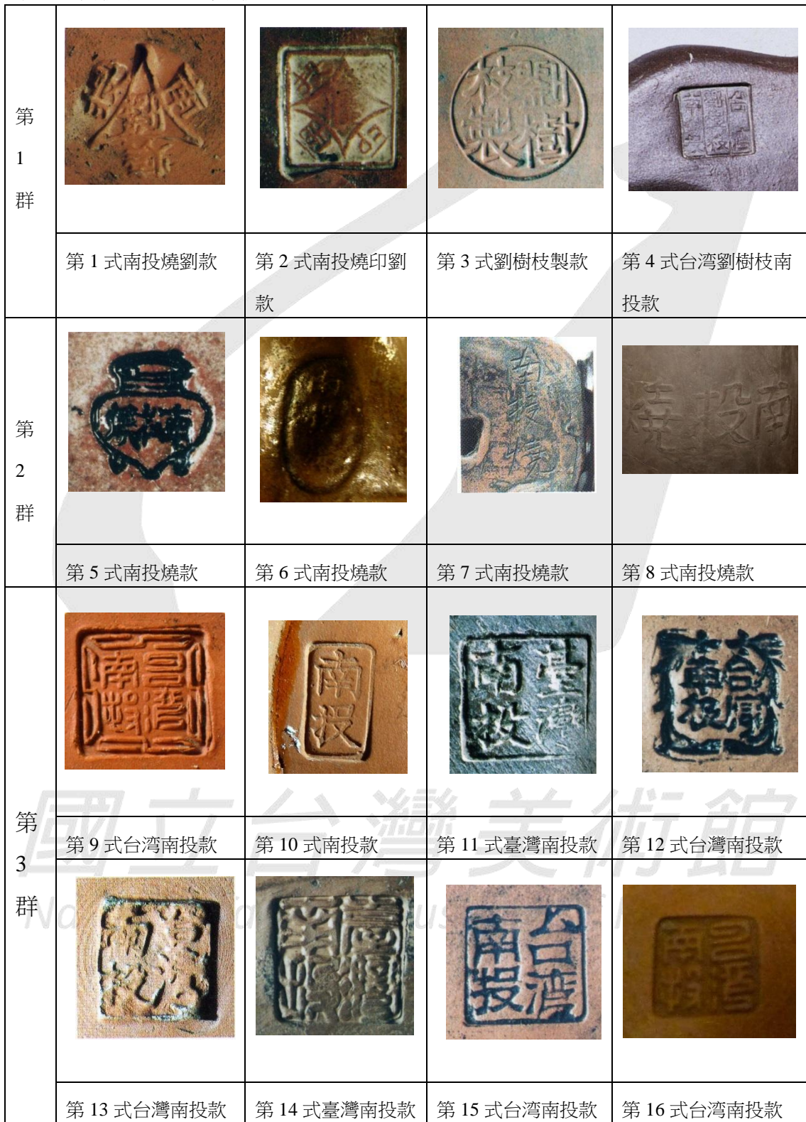
表 1 南投燒的各式印款