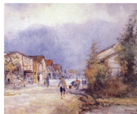
圖3 石川欽一郎 福爾摩沙 1930

在臺灣各地的寫生，如果從「地圖/風景畫」的觀念看，風景畫不再僅僅是固著於 「臺灣現代美術興起」的思考點，而是放在一個更大的文化形構的範疇來討論。在 此，「地圖是藝術」這句話將具有更深刻的意涵，而臺灣的視覺化歷史亦將獲得更 充足的詮釋空間。