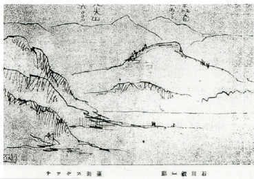
圖 4 石川欽一郎在臺灣中央山脈探險的速寫，其實兼具地圖與風景畫之雙重功能，畫面中的小標題也帶有地圖製作的意味。

從異國情調到「地方色彩」的轉變，是日治時代臺灣美術的發展的主要基調。 22 殖民初期，日本對於臺灣自然景觀異於內地，其採用的途徑是以比較的方式解讀臺灣風景特色，亦即將臺灣的種種以日本的標準來評價。早在1879年人類學者伊能嘉矩（1867-1925）探訪臺灣山區時便有這種觀察。他認為日本的風景是精緻的，而臺灣的風景是雄壯的。結合兩種類型可為日本風景畫家與造景家提供極好的理論。石川欽一郎也提議以日本的風景畫來閱讀臺灣。如此也導致他對臺灣風景的總結：野性美、鮮豔的顏色、粗獷的線條、淺薄的外表與強烈的光線。此外，當與新世界遭遇時，旅行者也不免會聯想到它地的代表景點。臺灣風景讓1914年來臺寫生的三宅克己（1874-1954）想起義大利南部、西班牙與埃及 23 ；曾四次赴臺的川島理一郎把臺南看成羅馬或龐貝城。 24 一幅滿載甘蔗的牛車的畫面情景讓人聯想起米勒的作品。 25 這種典範式的比較觀點經常出現在殖民關係之中，多少形塑了兩者的關係。