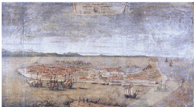
圖2 約翰·芬伯翁 (Johannes Vinboons) 大員鳥瞰圖 (圖片來源：《十七世紀荷蘭人繪製的臺灣老地圖》(下冊)，臺北，漢聲，1997年，頁80。)

製的美麗之島 (I. Formosa)，古今中外的讀者藉著這小小的島嶼形狀，以或多或少 的想像填充這個不能言，但越來越多地被討論著的「它者」。當荷蘭人進入澎湖、 臺灣灣之後 (1622, 1624年)，地圖所描寫的內容不再是海岸輪廓，而是更為細緻 的、小區域的地景內容。裘漢納·敏奔 (Johannes Vinboons) 的熱蘭遮城的建物、 船舶描繪 (「熱蘭遮城與長官官邸鳥瞰圖」，圖2) 將臺灣視覺化的工作向前推進 了一步，地圖製作與風景畫的意味在此並無法全然區隔。對荷蘭人而言，這兩者有 理論與實踐上的親近性 (affinity)，誠如一位荷蘭製圖者所言：「誰能在紙上確實 掌握他過去的外國的地形，除非他懂得繪畫。好的地圖是多麼富麗絕妙，使人如從 另一世界看這世界。為此，我們要感謝繪畫的藝術。」 13 此呼應了摩肯·安德魯斯 (Malcolm Andrews) 的看法：「製圖家與畫家的作品是同時經常是互為關連的，即 使我們把前者當做是科學而後者是藝術。」 14 安德魯斯指出，當我們理解到地圖與 風景畫的製作與觀看同時都在探索地景，讓地景變得合乎人之理解情境，其實兩者 的差異並不是那麼的遙遠。在安德魯斯看來，這是「擁有的隱喻語彙」(a metaphorical vocabulary of possession)，流動在兩種製作的過程與結果的背後，形成 後設的架構。而臺灣的地理圖像，在荷蘭人的製作下，呈現的既是地圖，也是風景 的樣貌。地圖是指標與定位，風景畫則提供一個可進一步閱讀的內容，從無聲到有 聲，從故事的大綱到生動的細節。甚且，此一轉折，從地圖到風景畫，加入了美感 認知的因素，詮釋的動機超過科學紀錄的成分。從地圖到風景畫，地方的面貌因而 更形完整、具體，符號的轉換也更為靈活。1930年代，石川欽一郎與日本旅遊畫家