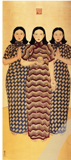
圖6 劉錦堂 臺灣遺民圖 1934（圖片來源：《劉錦堂百年紀念展》，臺北，臺北市立美術館，1994年，頁66。）

面展覽的作品有了詮釋的機制，令一方面殖民現代化的生活品味也和美術活動同步。這點可由報紙媒體《臺灣日日新報》「臺展畫室巡禮」中參賽畫家呼應「八景十二勝」的報導可知。 40