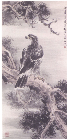
圖4 林玉山 松鷹 1971