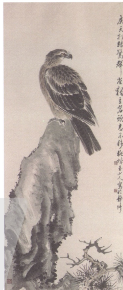
圖3 林玉山 英風颯爽 1951