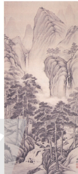
圖6 郭雪湖 松松飛泉 1927

根據王耀庭的分析,認為其一生的創作「『南畫及水墨畫』的技法是隨時存在的」 14 ,而中國藝術之創作理念也早已生根,並且深深地與寫生融合,成為獨特的林氏畫風。就這點判斷,林玉山厚實的根基,實毋須為正統國畫論爭的壓力量身打造。郭雪湖《塔山煙雲(阿里山)》為第11屆省展(1956年)參展之作,煙雲描寫的比例就比其他的作品來的稍多。作為省展的主要創始人,有論者謂郭在第1屆省展作品「與近代中國寫意花鳥畫傳統距離更加接近的作品」(指《驟雨》一作,圖5)。郭氏確實在那段時間有較多的水墨作品,也有暈染的效果, 15 但就內容、技法與筆法而言,還是較接近東洋畫,反而和他早年的中國傳統繪畫的作品有很大的距離(《松松飛泉》,第1屆台展入選,1927年,圖6)。