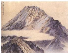
圖1 林玉山 昆陽山色 1958