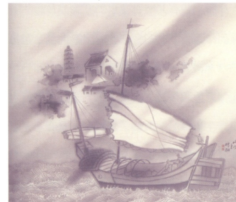
圖5 郭雪湖 驟雨 1946