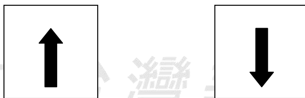
圖 6 長條形的垂直式作品暖而靜

就藝術理論而言，如圖 6 長條形的垂直作品，能給予人「暖而靜」的穩定感覺，再者，觀者受到「蕃童自我凝視」的視點影響，沿著笛子往下觀賞，予人一種穩定而流暢的感受。此外，蕃童的上半身短於下方的座椅，不僅添增穩固感，更促使兩者產生互相牽引的力量，並藉由椅子連結身體背部線條，產生向上昇華的動勢，使恬適的蕃童不致過度呆板，並串連「蕃童自我凝視笛子」的動作，形成一種循環性，充分彰顯了蒙受西方美術教育思潮的影響。