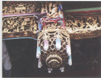
圖4 慈惠宮