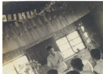
圖13 1963年任「通霄雕刻生產合作社木刻訓練班」講師時的授課情景。

區隨處可見，人物體態已因歲月走樣，身著樸素單色的藍色衣褲，配上夾腳托，朱銘藉由人物的這些配飾呈現出鄉下一副悠閒與與世無爭的模樣。