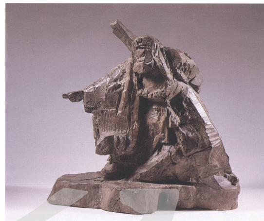
圖10 朱銘 魯智深 55×32×54公分 1971

動作掌握得十分傳神，母牛體態雖然堅實厚重，但動作卻顯得輕巧靈活，前肢一腳向前踏，另一腳抵住將重心往後拉，以後面兩足踏實的穩定住整個身軀。母牛沈穩和小翼翼地在崎嶇不平的山路上前行，並不時回降顧及小牛的安危。小牛生澀的面露出些微緊張的神情，夾著尾巴，緊緊依偎在母親的身後，寸步不離，朱銘藉由小牛與母牛互望的眼神，傳達出母與子之間深刻的親情。整件作品一氣呵成，刀法俐落明確，準確地呈現出牛體的重量與姿態。