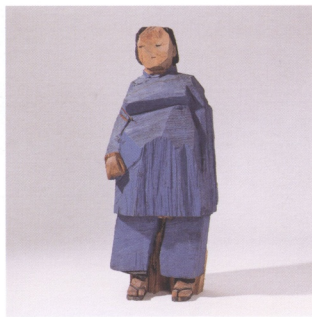
圖12 朱銘 人間系列——彩繪木雕 51×45×128公分1995

武松、李逵、魯智深等水滸傳人物形象經常成為中國傳統藝術表現的題材。尤其是花和尚魯智深好打抱不平、豪邁不拘的形象，更是成為傳統木雕的創作題材。