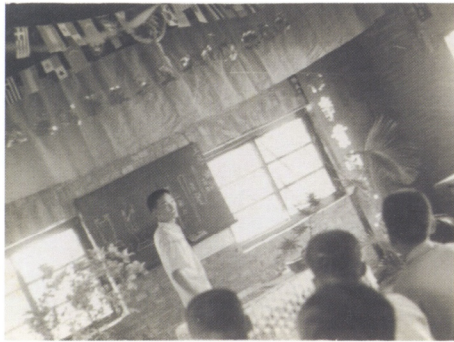
圖14 1963年任「通霄雕刻生產合作社木刻訓練班」講師時的授課情景