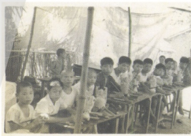
圖16 1961年朱銘開始招收徒弟，此為徒弟於露天工廠工作的情境。

朱銘在家鄉開設「海洋雕刻社」，當起「社長伯」，招收學徒，為當地培育出不少雕刻人才。朱銘的師兄鄭元凱便說：「……朱銘返回通霄鎮通灣地區開工廠，也為通霄開創了不少就業機會與培訓許多雕刻人才。」 29 起初，朱銘的工作室設在通霄觀樂戲院左鄰，是幾塊簡單布簾圍成牆的露天工廠（圖16），他在一本老照片旁這樣寫著：