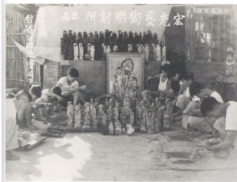
圖5 宏光藝術雕刻社工作的情景。拍攝地點為通霄慈惠宮後廂房外。

母親的身影是一條溫柔的絲線將朱銘與通霄緊緊相繫。朱銘美術館建造的過程中，慈母碑是最先建造完成的區域， 4 從這部份就可以看出母親在朱銘心中重要的地位。