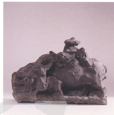
圖7 朱銘 伴侶 80×45×54公分 1971

從李金川所留下的眾多廟宇畫稿看來，他的描繪能力一般工匠無可比擬，能徒手描繪出繁複的構圖與精密的素描，線條運用也非常靈活，這些特色同樣也在朱銘的素描稿中可以看出。