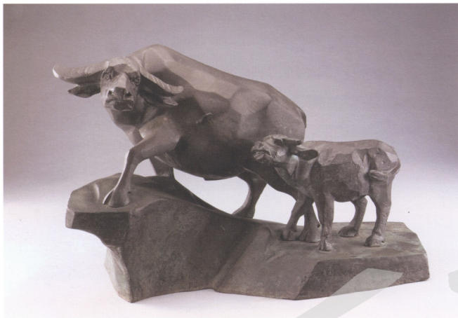
圖8 朱銘 母與子 49×16×33公分 1991

師課堂上講古的故事 17 ，以及廟埕前子弟戲演出忠孝節義的戲劇等等，往後都化作朱銘創作中的點點滴滴，在此茲將這些作品分為：「鄉土系列」、「歷史人物系列」、「人間系列」，分述如下：