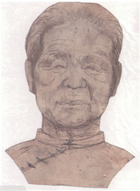
圖3 朱銘 慈母像 17.5×12.2×0.1公分

朱銘也是如此，他的出生地苗栗通霄，一個靠海的小市鎮，成為他創作靈感的泉源。故鄉的人、事、物深深影響他的創作，仔細剖析朱銘的創作脈絡，時時顯現著故鄉通霄的印象。這如同文學作家七等生的《沙河悲歌》，作品中總是刻畫著通霄的一草一木。