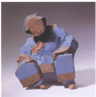
圖11 朱銘 人間系列——彩繪木雕 33×28×33公分1984