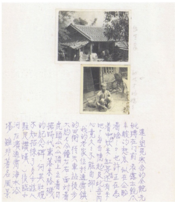
圖1 朱銘相片簿。