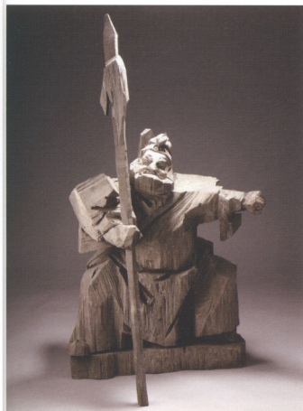
圖9 朱銘 項羽 57×47.5×104公分

例如1991年銅製的《母與子》作品(圖8)，朱銘經常以動物來隱喻母子之間的情感，除了牛之外，還有以羊、雞、豬等等為主題的創作。這件作品牛隻的神態、