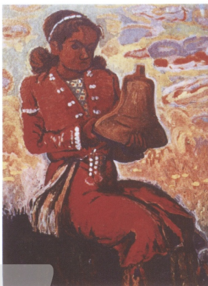
「聖戰美化下的畫像」鹽月桃甫 莎韻之鐘洋畫 1941年 第2回聖戰美展

在時代的轉變，軍國當道日本存亡之際，畫家的地位自然也顯得薄弱，在當局的命令下轉換視角以愛國為題，宣揚帝國聖戰的正當性。首屆聖戰美展於1939年在