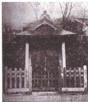
木造莎韻的鐘樓（現蘭陽女中）昭和十六年（1941）全校募款所造