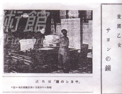
「新聞媒體炒作」莎韻之鐘授予式 昭和十六年（1941）四月十四日