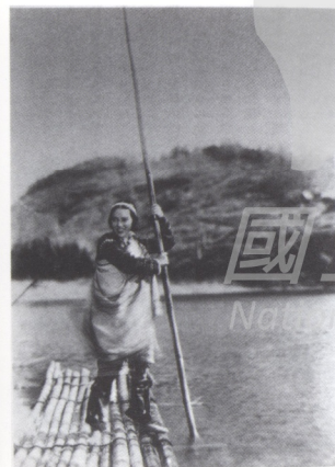
「愛國樣板電影」滿映と台灣總督府松竹合作「莎韻之鐘」POST 1943年

愛國乙女犧牲事件，同年1941年日本發動太平洋戰爭，日軍節節勝利之際，日本南進政策如火如荼的展開，愛國舉兵征戰前線日益吃重，在急需兵援之際，在日帝軍政府強大動員下，開始對台灣原住民徵兵赴前線作戰。1943年台灣總督府更進一步邀請松竹映畫與滿州映畫來台拍攝愛國物語電影。愛國政治藝人李香蘭（本名大鷹（山口）淑子）擔任主角，自幼隨著父親居住在滿州的奉天市，接受中文教育，並有著一口流利的中文。傳說中與台灣日治時代名人劉吶鷗交情深厚、互相吸引。由於劉投靠汪精衛政權，在上海一處演講會後，當場被舉槍暗殺，李香蘭因此來台參加他的葬禮 12 ，過程中充滿神秘性。莎韻之鐘的電影劇情操弄著愛國情操，劇中原住民爭先恐後響應皇軍徵兵，台灣原住民英勇的雄姿一幕幕呈現在銀幕中，劇情的刻意安排相當的醒目，故事腳本偏離主題，一場「師生戀」成為世紀的騙局。