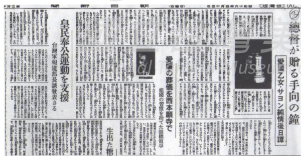
「新聞媒體炒作」長谷川清贈鐘（圖片來源：《朝日新聞》昭和十六年（1941）四月十三日）

首先登場是1941年4月14日長谷川清「總督が贈る手向の鐘 愛國乙女サヨン純情後日譚」贈鐘之舉 10 ，運用《台灣日日新報》，全國媒體強力歌頌造成爭相報導，舉行返御典禮。宜蘭第一女中（現蘭陽女中）舉辦全校募款，援助建立木造莎韻鐘樓，成為1896年芝山巖事件以來新台灣皇民文化景點，可謂是舉國共矚哀悼的情形，至今還緬懷不已。