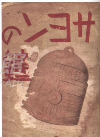
《莎韻之鐘》封面

對統治者大和民族來講，少了一位原住民少女是無關緊要之事。當事件發生之後，台北州廳知事只表示同情，並無誠意參加在莎韻家鄉11月26日的葬禮。但事後