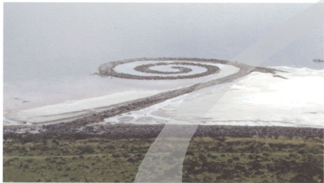
圖16 史密生地景藝術作品《螺旋堤》(Spiral Jetty, 1970)