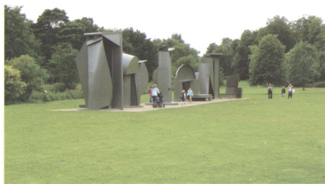
圖13 卡羅位於英國約克夏雕塑公園的作品《散步》(Promenade, 1996)

從本文探討劇場性與視覺藝術發展的觀點來看，符合此一東西方融合的美學觀點，最顯著的莫過於「物體情境」(objecthood)這個觀點的提出，與其對西方雕塑藝術的革命性影響。「物體情境」這個觀點最早由藝評家麥可·佛依得(Michael Fried, 1939-)在1967年針對極簡主義雕塑的批評所提出的。雖然他對於極簡主義(Minimalism)所營造出的「劇場性」(Theatricality)不予苟同，但他明確的指出「物體情境」與「劇場性」為極簡主義雕塑的時代特徵。 21 佛依得對極簡主義的論點主要來自於「現象學」觀點，尤其是梅洛龐蒂的「知覺現象學」(Phenomenology of Perception)觀點。在〈藝術與物體情境〉(Art and Objecthood)一文中，佛依得明確的定義出「物體情境」為雕塑物體所營造出的狀態或環境，他同時也認為「物體情境」為極簡主義中最值得爭議的特質，也是其與現代主義的繪畫或雕塑作品的分水嶺。 22 與過去的繪畫或雕塑所不同的是，極簡主義的作品既非繪畫也非雕塑，而是一種迫使觀眾回歸到自身直觀體驗的情境。佛依得在探討英國雕塑家安東尼·卡羅(Anthony Caro, 1924-)的作品時，開始提出雕塑創作中的劇場性特質凌駕於造型與材質等藝術性。他指出在我們親自面對抽象雕塑時會產生一種豐富的劇場特質，隨著你身體環繞著不同角度的雕塑作品，你的身體經驗也隨之不同(圖13)。隨著極簡主義的興起，這種劇場特質轉移到了極簡主義者的作品上。雖然