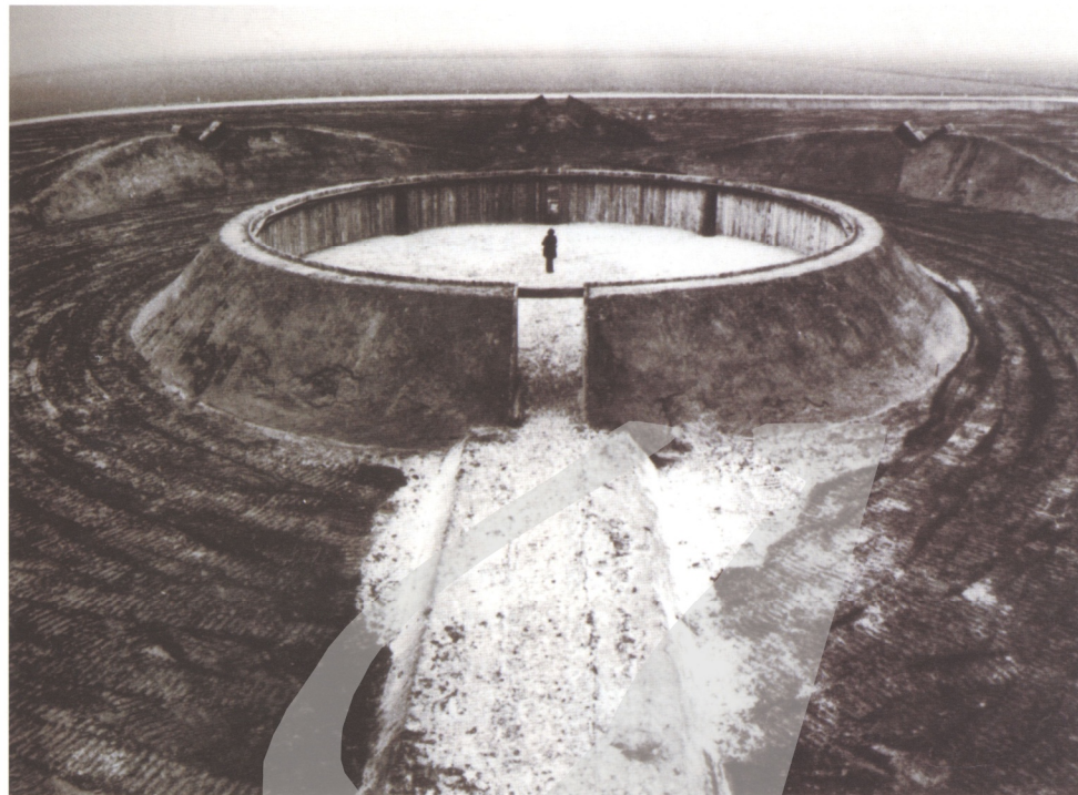
圖14 羅勃莫里斯 (Robert Morris, 1931-) 的作品《天文台》(Observatory, 1977)

地景藝術家除了運用大地作為他們探討人與自然的關係之外，他們透過觀眾與作品的互動去探討持續時間(duration)、知覺(perception)與回歸自我的過程(self-orientation process)。透過身體置身於特定場所的實驗，他們體現了劇場性特質的創作概念。例如羅勃莫里斯(Robert Morris, 1931-)的作品《天文台》(Observatory, 1977)中，