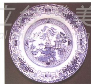
圖4 英國柳樹圖騰的經典瓷器

上。例如，著名的英國瓷器柳樹圖案(the Willow Pattern)，便是從早期由中國進口的青花瓷圖騰演變成英國本土瓷器的經典中國風柳樹圖騰(圖4)。此種經典中國風圖騰緣自中國的哪一個時代，目前已經不可考。但隨著歷史的演進，英國人已經賦予其新的意義，加入西方愛情故事的橋