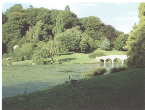
圖6 英國史都赫德庭園中的中國式拱橋與圖4柳樹圖騰中的拱橋相呼應

提出的中國「傻瓜拉機」(Sharawadgi) 6 造園原則成了早期英國自然風景園林與「如畫美學」運動中的重要理論基礎。 7 1685年，天波爵士在他的書《伊比鳩魯的後花園》(Upon the Gardens of Epicurus)中闡述，中國式造園最大的特徵在於那像是隨意或是偶然的自然主義栽植方式。在天波爵士之後相繼的有許多的園藝家與理論家相繼的投入中國造園理論的追尋，其中又以威廉·乾伯斯(William Chambers, 1723-1796)對中國園林美學的實踐最為不遺餘力。乾伯斯兩次前往中國，親自考察中國式庭園與理論，對於將中國式造園原則融入「如畫美學」風格的英國自然風景庭園有極大的貢獻。乾伯斯對將中國造園理論導入英國自然風景庭園的貢獻主要有三點：第一，在1757年，他發表了《中國園林設計藝術》(Of the Art of Laying Out Gardens Among the Chinese)一書，詳實的比較了中國園藝家與歐洲畫家，並以中國庭園的典範來檢視英國自然風景的造園原則。第二，在1750年代，他受邀以中國造園的原則來改善倫敦「裘園」(Kew Gardens)的設計，他的計畫詳細的紀錄在《薩里裘園建築物與花園的平面圖、立面圖、剖面圖和透視圖》(Plans,