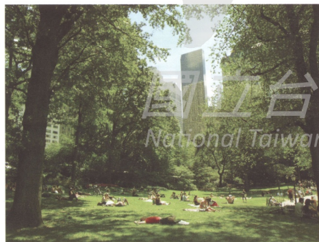
圖12 美國紐約市中央公園座落於大樓環繞的環境中 (圖片來源:Wikimedia Commons, 拍攝者:David Shankbone, http://commons.wikimedia.org/wiki/File:Lower_Central_Park_Shot_4.JPG )

1857年，歐姆斯德便根據十八與十九世紀的英國景觀造園原理與布朗庭園的親身體驗，設計了美洲第一座大型公眾公園，是第一位將景觀建築設計應用在大規模土地上的設計師。他最著名的作品是他和英國建築師沃克斯所共同合作的紐約中央公園(New York City Central Park)(圖10)。除了中央公園外，歐姆斯德的主要成就包含底特律的貝里島公園(Belle Isle Park)、紐約布魯克林的展望公園(Prospect Park)(圖11)、加州的史丹佛校園、波士頓的公園系統與許多的大學校園規劃。在每件作品中，他視自然為可被體驗的空間而非被觀察與評論的空間，他的設計天分展現在不著痕跡的顯露自然。根據如畫美學的造園理論，公園是可以讓民眾與自然互動，並紓解居住於擁擠城市中壓力的地方(圖12)。對於歐姆斯德來說，任何公園的功能在於恢復人類的精神。透過提供與城市環境相對照的實質與視覺環境，公園無意識的提供反應給他們的遊客。歐姆斯德曾經寫道：「大型公園的最終目標如同一種影響人的體驗…就如同音樂一般…一種來來往往…無法以言語道斷的形式來表達。」 16