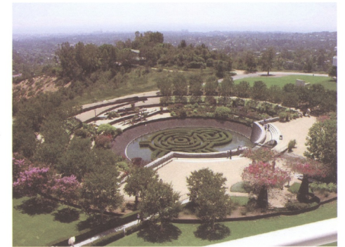
圖18 爾文替洛杉磯蓋蒂博物館(Getty museum)所設計的中央花園

在1990年，一場名為「透明線」(The Transparent Thread)的展覽在紐約州的漢普斯德(Hempstead)舉行，參展的所有藝術家皆為深受東方哲學思潮所影響的戰後藝術家。展出的畫冊與記錄則提供了這一批在1965到1985年間創作的藝術家受東方思潮影響的具體事證，為研究東方思潮