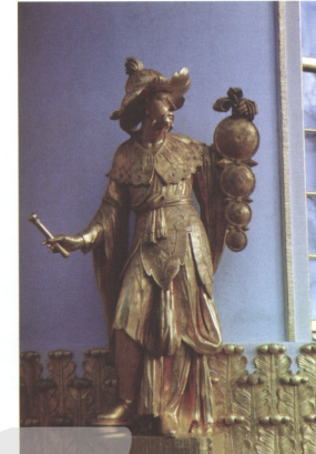
圖3 中國茶屋外觀的中國風情人像雕塑

宮(Sanssouci)公園中的中國茶屋(the Chinese Tea House)。中國茶屋的建造乃當時德國腓特烈大帝(1712-1786)追求時尚中國風的代表建築(圖2)。以上這兩件代表性的建築物主要在運用中國式的裝飾風格，建構在原有西方建築的框架上，以體現當時蔚為風潮的異國情調。這些建築雖然在裝飾上極力模仿中國風情(圖3)，但實際親臨現場的感覺，卻與真正的中國建築空間體驗大異其趣。此外，歐洲人對於中國式庭園空間的欣賞可以具體展現在日常生活的瓷器