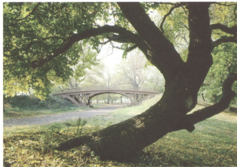
圖10 美國紐約中央公園中具有拱橋的一景

普萊斯的書與論文，歐姆斯德深受其影響，導致了英國風景庭園和美國景觀建築間的強烈聯繫。他深受年輕時到歐洲旅行的影響，認為公園是提供人們去體驗自然本質最理想的地方。從他的寫作中我們可以看出他也深受英國浪漫詩人華滋華斯(William Wordsworth, 1770-1850)與美國思想家艾默生(Ralph Waldo Emerson, 1803-1882)的影響，這兩位文人都強調人與自然合一的重要性。在1852年，歐姆斯德出版了他在歐洲旅行的心得《一個美國農夫在英國的散步與談話》(Walks and Talks of An American Farmer in England) 15 。