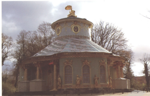
圖2 德國波茨坦無憂宮(Sanssouci)公園中的中國茶屋之外觀充滿想像的中國情調