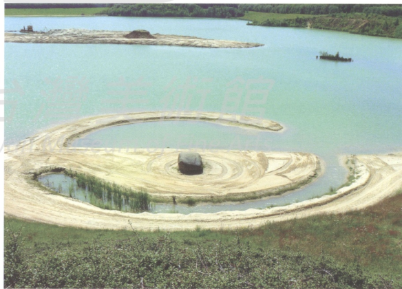
圖17 史密生地景藝術作品《殘缺圓與螺旋丘》(Broken Circle and Spiral Hill, 1971)的靈感局部來自於中國的天極

驅者之外，同時也是地景藝術理論的重要建構者，他不只回溯前人的創作足跡，強調觀眾在他作品中的空間體驗，而且在創作中也常加入東方哲學的元素(圖17)。