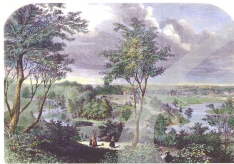
圖11 描寫美國紐約布魯克林展望公園(Prospect Park)之版畫