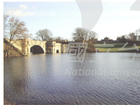
圖7 位於英國牛津郡的布倫亨宮(Blenheim Palace)庭園，是著名的邱吉爾故居，布朗自1764著手改建。

或創造三度空間的自然風景，與中國傳統中「風景如畫，畫如風景」的觀點有異曲同工之妙。對十八世紀的如畫美學理論家來說，如畫美學不僅著重視覺上的美感與環境中的特定視角，而且更重視欣賞過程中觀眾與自然環境的交互作用。他們認為真正的欣賞風景不僅只是「觀看」風景，而是更積極走入風景之中去「體驗」與環境之間的互動。此種觀念上的轉變，導致了歐洲「風景藝術」由平面的風景繪畫走入三度空間具有「劇場性」的「自然風景庭園」。十八世紀的英國將「如畫美學」(the Picturesque)與「崇高」(the Sublime)和「美麗」(the Beautiful)相提並論成為第三個美學的範疇， 8 「如畫美學」同時也被視為英國式「自然風景庭園」的理論基礎，在當時「自然風景庭園」被視為一種純藝術，與詩歌和繪畫並稱為純藝術域的三姊妹。雖然「如畫美學」在十九世紀中期以後的歐洲逐漸式微，並且隨著「景觀建築」(Landscape Architecture)的發展而與逐漸「純藝術」分道揚鑣，但其以觀眾身體經驗為主體的空間美學，仍然透過「景觀建築」的發展傳播到北美洲，繼續傳承「如畫