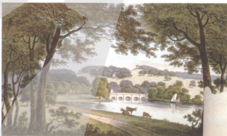
圖9 英國南約克夏郡的溫特沃斯(Wentworth)庭園經萊普頓設計後之面貌

普萊斯的書與論文，歐姆斯德深受其影響，導致了英國風景庭園和美國景觀建築間的強烈聯繫。他深受年輕時到歐洲旅行的影響，認為公園是提供人們去體驗自然本質最理想的地方。從他的寫作中我們可以看出他也深受英國浪漫詩人華滋華斯(William Wordsworth, 1770-1850)與美國思想家艾默生(Ralph Waldo Emerson, 1803-1882)的影響，這兩位文人都強調人與自然合一的重要性。在1852年，歐姆斯德出版了他在歐洲旅行的心得《一個美國農夫在英國的散步與談話》(Walks and Talks of An American Farmer in England) 15 。