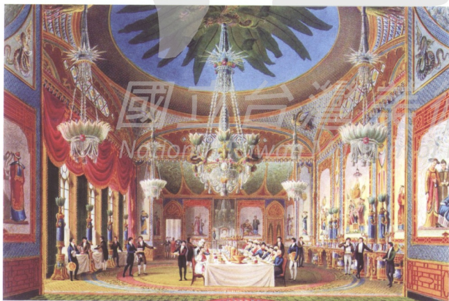
圖1 英國布萊頓皇家行宮 Royal Pavilion 宴會廳的想像式中國式壁畫

十七世紀中葉及十八世紀初透過「東印度公司」貿易的傳播，中國庭園的意象在歐洲形成了一股「中國風」(Chinoiserie)的流行。在十八世紀中葉，這股「中國風」潮鼎盛時期中國式的山水、人物、花鳥及建築物等影像，被普遍的運用在歐洲日常生活的室內裝潢、家具及圖案設計中。這股中國熱風潮一直持續到十九世紀。例如，在十八世紀末葉在英國布萊頓(Brighton)所興築的皇家行宮(Royal Pavilion)，雖然外表是印度風格，但在內部裝潢則是集中國風之大成，從壁紙、吊燈、掛畫到花瓶等擺飾物品都是中國風格的產物(圖1)。另一個中國風流行具體的例子，則是建於十八世紀中葉(1755-1764)，座落在德國波茨坦的無憂