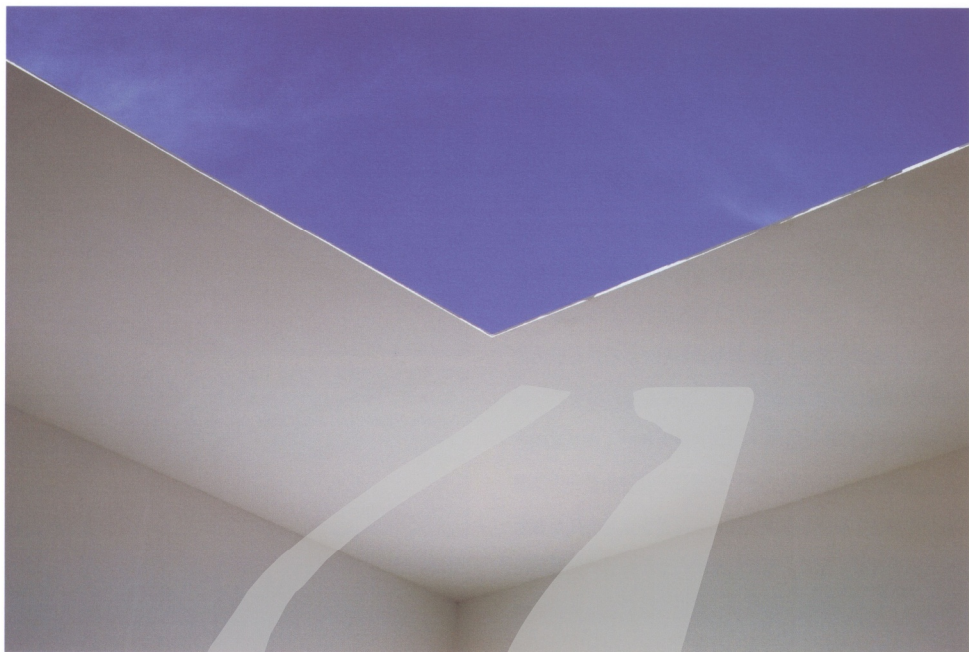
圖19 特若的作品《天空》(Skyspace)由室內仰望天空

1943- )的作品《天空》(Skyspace),巧妙的運用自然的天空色彩變化,在所建築的小空間天井上,透過燈光調節,讓觀眾親身體驗微細的天空顏色變化。藝術家透過巧手,讓我們體會到,我們每日仰望而忽略的天空,居然有這麼豐富的顏色變化,這個作品堪稱為「光與空間」的經典之作(圖19),也可以說為理想風景做了最當代的詮釋。