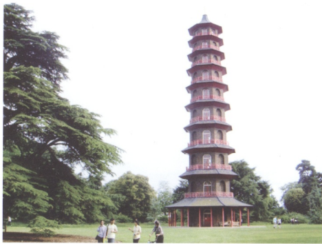
圖5 英國倫敦裘園的中國式寶塔