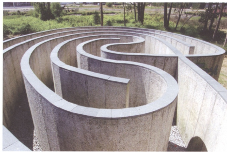
圖15 羅勃莫里斯位於西班牙的作品《迷宮》(Labyrinth, 1999)具有強烈邀請觀眾的劇場性特質