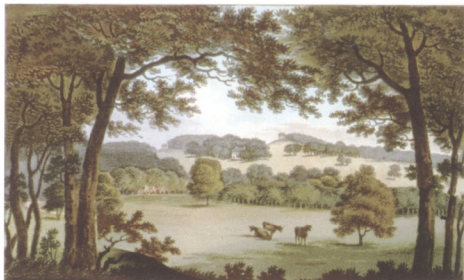
圖8 英國南約克夏郡的溫特沃斯(Wentworth)庭園設計前之原貌

歐姆斯德生於1822年的康乃狄克，是個自學有成的景觀設計師。1985年的春天，歐姆斯德到英國旅遊，在旅程中他建立了早期對自然與人類關係的理解。框景、如畫美學和大英帝國的田園景致成了他未來設計的藍本。歸功於吉爾平與