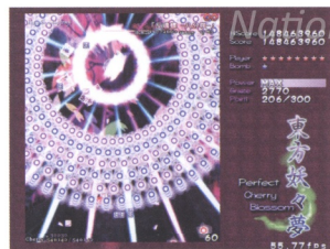
蝴蝶代表靈魂，在日本電玩素材上，是有使用這一概念。本圖為東方妖妖夢的符卡：「反魂蝶——八分咲」

除了從塩月所處文化環境來思考，霧社事件的發生和塩月激烈的反應，使彩虹成為靈之橋，蝴蝶成為靈魂的象徵。現在讓我們回頭檢視《母》。這幅畫作是在塩月感情最激動時所創