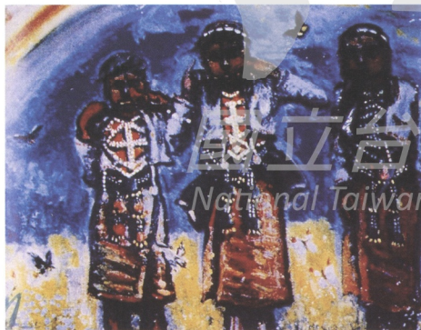
《虹霓》畫中的彩虹和蝴蝶，傳達塩月桃甫對原住民文化消逝的不捨之情。

三位女孩外，目光可能被繼續吸引的，是大片綠色的天空和飛舞的蝴蝶。這立刻令人感受到原住民居住在深山的氣氛。少女的頭巾被畫筆輕微的帶往左邊，使人感受到微風的飄動。背後的彩虹，從後方插入，雖然佔的幅面不大，但視線自然會被帶到彩虹身上。彩虹至少帶來三種效果：一是把