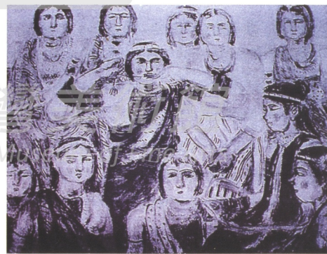
《馬西多巴翁社的少女》和《虹霓》一樣，圖中的少女中皆拿著 [go'] 的笛子。

塩月其他原住民畫作，主題就不像《虹霓》所表達的一般。通常，塩月會把焦點放在原住民本身，單純的表達出原住民的「美」。所以大部分的畫，只有一位主角，全焦點在這一位女性身上，並看到她身上的服裝。特別的是，塩月