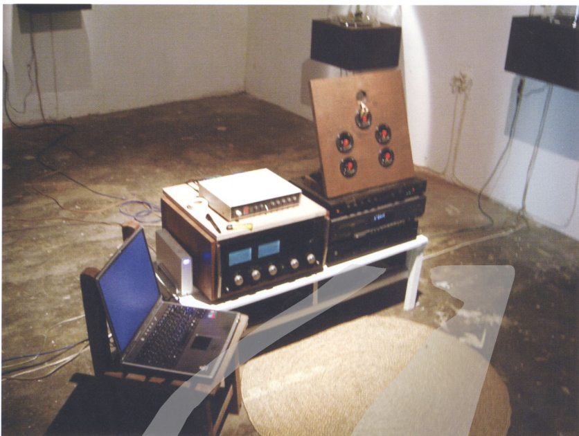
吳達坤 波音計劃 2005年於自強284 複合媒材

卻造成個人風格的喪失，並且失去敏銳度，……例如：慣用 PHOTOSHOP 的攝影者很可能因此，不在意拍照的決定性瞬間，因為可以透過電腦模擬修改，不怕拍不好，但即使效果逼真，卻失去藝術價值了。」 10 也是曾被提出的隱憂。然而二十世紀藝術發展史原本就是媒體與科技演變史，科技改善了生活，同時也改變了人類對世界的認知和對藝術的定義。而且科技藝術最大的意義並非在技術的創新，而是在於實驗精神的提出以及作品與觀眾間互動模式的產生，就像不遠的10年前，我們都還無法想像網際網路會像今日一般迅速普及。當代中的藝術表現，尚有許多未被完全了解，嫻熟技術的操持，並了解新媒體藝術的真正意義，是台灣新媒體藝術必須配備上膛的基本裝備，也才能因而創作貼近科技本質，表現新媒體精神的經典佳作。