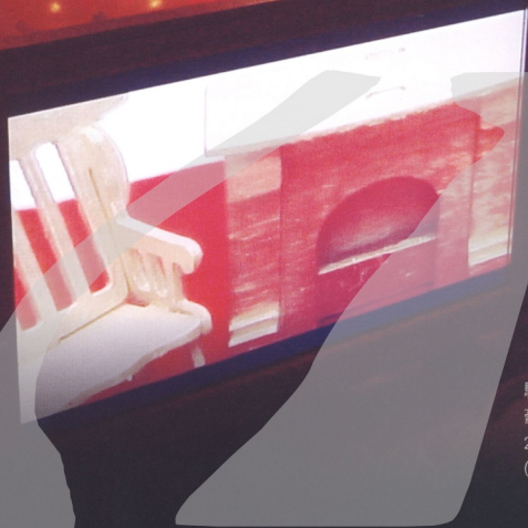
駱麗真 豪華家庭初體驗——鏡相裝置版 2007於中原大學藝文中心·複合媒材