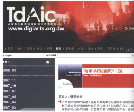
網頁：數位藝術知識與創作流通平台