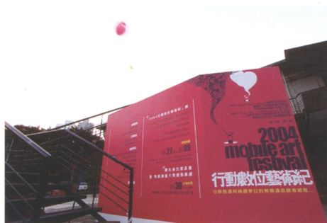
2004年於台北華山文化園區