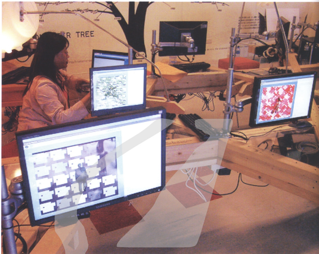
2007年於國立台灣美術館「數位藝術方舟」