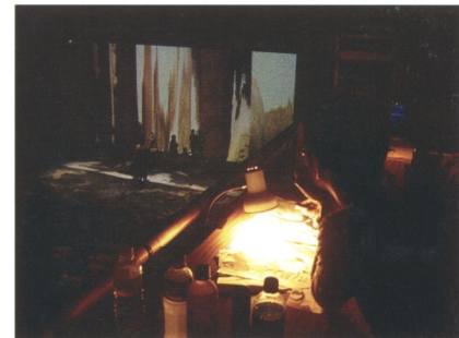
2005年於台北藝術節