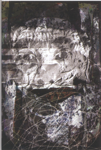
數位版畫藝術是一種複合的藝術型態，結合了繪畫、版畫與攝影等眾多創作媒材專業的思維與形式。 蔡昌吉 自畫像 2006 數位版畫