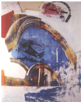
Robert Rauschenberg 的「結合繪畫」畫意將藝術中的象徵、指稱和材質的實驗做了最極致的跨時空對話。 Robert Rauschenberg Hedge 1964 網印、油彩、畫布 (出自 Museum Nationalgalerie Altes Museum, Berlin)