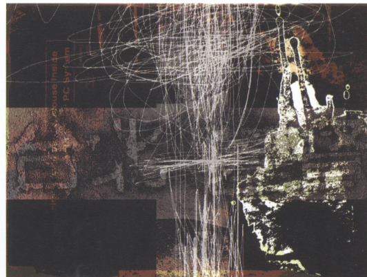
數位版畫可以做出和傳統版畫一樣物理性知覺的外貌。 蔡昌吉 台北基督 2006 數位版畫