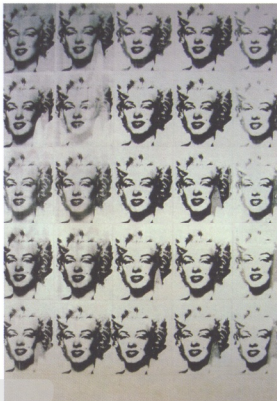
Andy Warhol 運用照相複製技術與網印技術，造就了普普版畫藝術的熱潮，同時質疑「原作版畫」這一概念。 Andy Warhol The Twenty-Five Marilyns 1962 網印、壓克力、畫布

數位影像藝術最易見的表現，是藉由電腦繪圖中的輔助工具，經由剪、貼或類似繁瑣的橡皮……等工具，加上混合複製形式所完成的數位蒙太奇影像。而數位影像所創造出的「數位蒙太奇」(digital montage)，由於作品中每一個元素都可以由創作者自由的重新加以選擇、分配與重組，不斷在瞬間中尋找圖像元素作最佳結合。一般普遍認為數位版畫的缺點是：輸出的品質外貌太過平坦，缺乏觸覺感受。但是，藝評家 Eleanor Hartney 認為數位作品正是一個製作擬像，模糊真實與想像之間界線的最佳例證，她認為藝術家與其最後呈現的作品之間的確存在真實性 (authenticity) 的問題，藝術家可以結合數位與傳統媒材的方式，來衍生較有純藝術特質而少點機械特質 (改變平板的噴墨輸出外貌) 的作品，加強數位作品的物質性層次，以更突顯作品的真實性 (authenticity) 與原創性 (originality)。 7