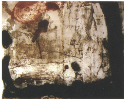
原作版畫強調刮、擦、磨、刻、印等所產生的勞動趣味。 蔡昌吉 無題 2002 複合材料、版畫 (蔡昌吉提供)