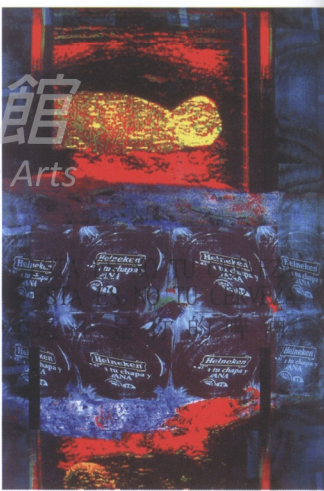
楊正言 這不是你的啤酒 2005 數位版畫

一般人甚少將傳統版畫視為科技藝術的範疇，主要的因素是：作品顯現藝術家親手操作的成分覆蓋了科技的本質。傳統版畫的價值在哪裡呢？而數位版畫擅長處