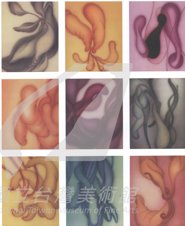
圖7 饒文貞 騷動 1999 10F × 9 絹本 膠 水干