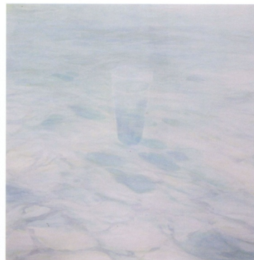
圖9 蔡欣霖 Liquidetc 2002 91 × 91cm 膠 水干 岩繪具

用絹布為基底素材，沒有多餘的色相，加上流動的造形及單一的技法，這些最簡潔的視覺元素把握了宇宙的客觀法則，拋棄事物的外表，揭示內在隱藏的永恆不變的實在。這種「單純之美」一直是藝術