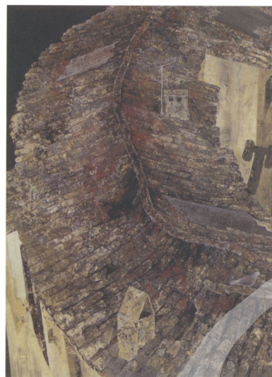
圖1 古澤洋子 刻の堆積 2003 224 × 168cm 膠 水干 岩繪具 箔

大膽的縱橫構圖首先吸引了觀者的目光後，視線隨及轉移至前端休憩的鴿子，在歐洲舊式建築中醞釀出一股無法言語的抒情性，成功地描寫了平常不為人所注意，卻是圍繞著我