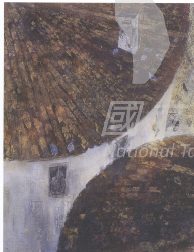
圖2 古澤洋子 ながれている刻 2001 162 × 130cm 膠 水干 岩 繪具 箔

們周遭的靜謐而又日常性的畫面。就如畫題所示，描寫一般日常生活景色但內省的視線卻是畫面的重點。從老舊的煙囪有時冒出的濃煙和橫越的電視天線中可以窺視出住在此處人們的生活。而悠閒的鴿子和風雨侵蝕過的屋瓦可以感