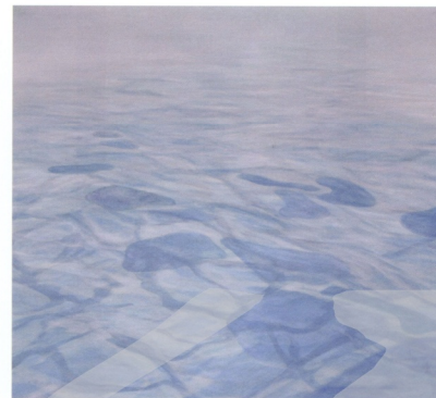
圖10 蔡欣霖 凝·境 2002 91 × 91cm 膠 水干 岩繪具繪

創作與欣賞所追尋的理想境界。去除舊有藝術形式的複雜沉重、華麗豔俗，去除多餘的累贅，而代之以單純自然、樸實無華的簡潔。（參考圖8）