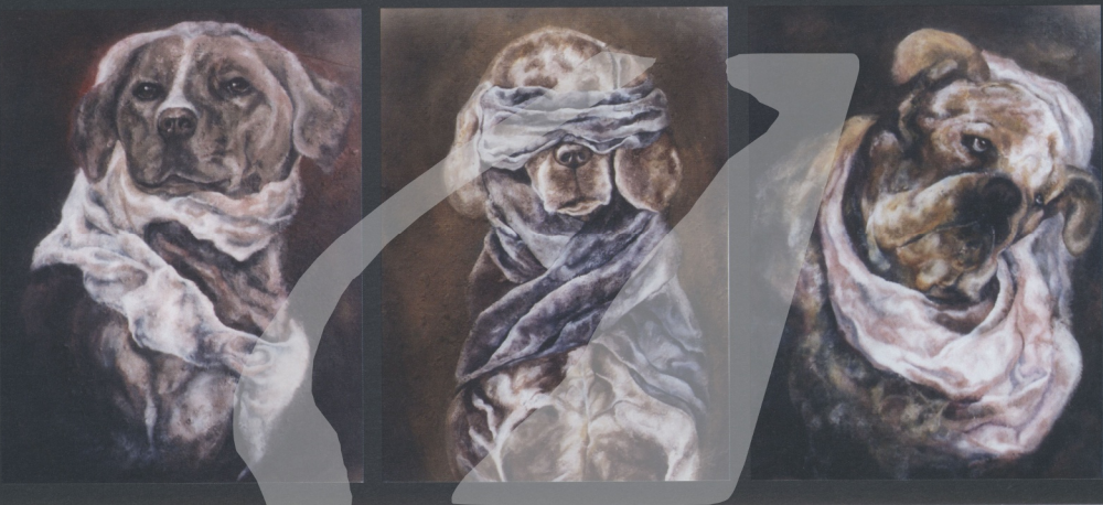
圖11 莊凱宇 犬戎系列——三連作 2002 120 × 90cm 膠 水干 岩繪具