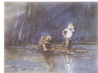
圖1 石川欽一郎《福爾摩沙》1930 38 × 45cm

然而，水彩是否有它一定不可改變或必要發揮的「特性」，卻是一個複雜的問題；如果有，又是什麼「特性」？既難定論；如果沒有，強調「水彩」又