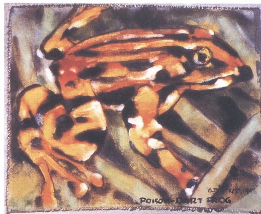
圖39 劉其偉《報春者》1996 23 × 30cm

精密寫實的技法，一如早期德國畫家杜勒(Albrecht Durer, 1471-1528)的作品，本身即蘊含高度的科學精神，而在文化、社會意義上，也代表