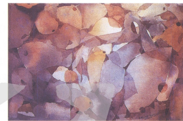
圖38 劉其偉《白露(2)》1981 54 × 40cm

著一種投入、理解與掌控的深沈心理需求。事實上，在這一波投入鄉土寫實風格經營的年輕學子，絕大部分來自台灣的鄉村，描繪自己曾經熟悉，而且可能因社會變遷逐漸消失的景物，在相當的程度上，不只是一種創作強度的問題，而是一種自我的重新發現與肯定。鄉土運動雖然起於1970年，但真正作品的不斷湧現，則是在1980年代的前期；此時也正是台灣社會逐漸趨向解嚴的時代，和這批畫家同年齡的另一批人，正好趕上開放留學的時潮，紛紛前往歐美學習美術，並在四、五年的學習之後，返台投入解嚴前後台灣現代繪畫在戰後的第二波運動(註17)。