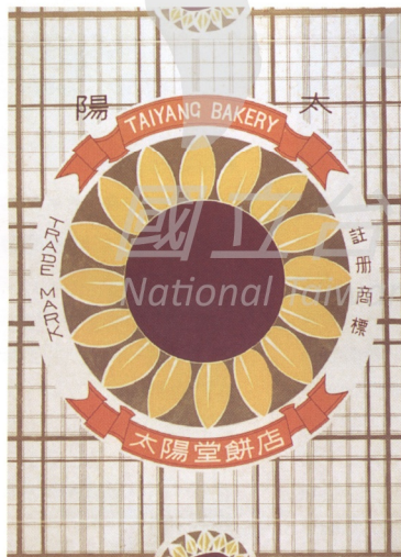
6.工整的向日葵圖案商標