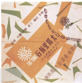
2.以太陽音譯「TAI YANG」之英文字母首「T」為造型基礎所設計之商標