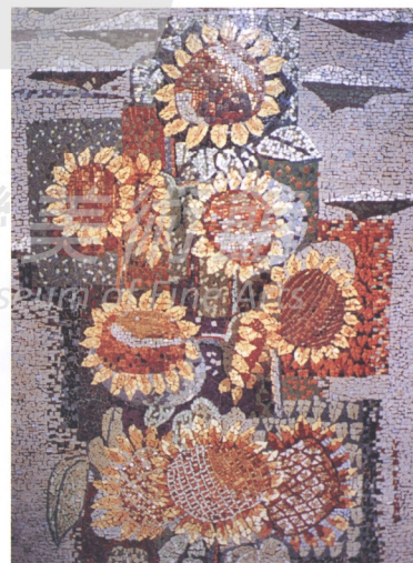
7.被三夾板覆蓋了二十五年的向日葵壁畫