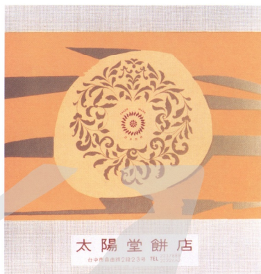
8.含有「太」字的大陽商標仍隱見向日葵蹤影

七、葵花商標被禁用後，改以抽象而具現代感的太陽作商標，中間含有「太」字，旁邊圍繞著四射的光線，迴旋勁拔，頗具動感！(圖8) 其實要是仔細拿這個「太陽」圖案與原來的「向日葵」比對，仍可完整的看出整朵葵花影子……。商標更動了，包裝上的向日葵也被色塊覆