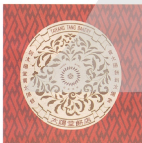
9.朱紅底的包裝紙盒上，印有強勁連鎖的四方形圖案