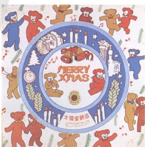
10.年底禮盒包裝，增加了耶誕氣息

蓋，取而代之的是葉形圍繞的單獨模樣。裝餅的正方形包裝紙盒有兩種：一種是白底套紗網紋，一種為充滿喜氣的朱紅色底，上印強勁連鎖的四方形圖案(圖9)。年底時盒外加裝的內鑲商標包裝紙，則配合耶誕之節慶氣息，繪有聖誕老人、耶誕樹、教堂、吹奏樂器歡欣歌舞的小熊及其他飾品花紋(圖10)。