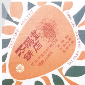
3.將太陽商標光芒規律化，成為向日葵圖案