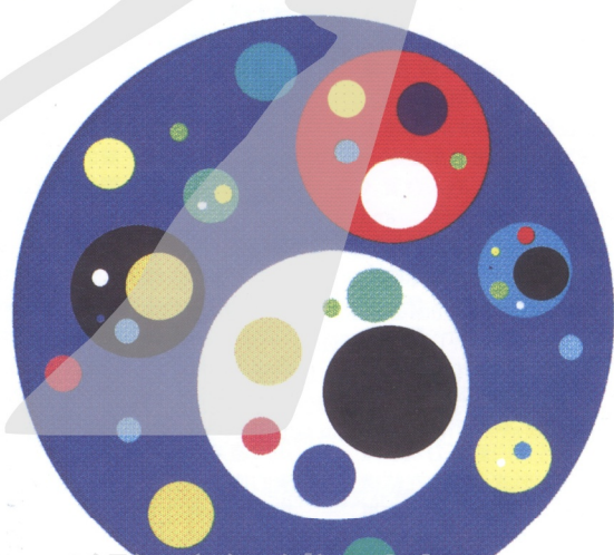
1. 人類共同知識基底認知語彙尚未形成之態勢 (本文附圖皆由作者提供)

及抄襲，絲毫不去體悟該單一文明體系下的本質性原始能量，而無法探究出屬於該文明體系下的優越「元素」，甚至到了無從探究的地步，終至消失而絕種無存，這無疑亦將是全人類的一大浩劫。廿世紀末的全人類在致力於保護地球生態、重視環保、尊重