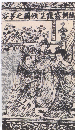
2. 南朝窈窕呈頰國之芳容 平陽姬家印

乾隆年間,年畫業達到空前鼎盛,據說僅戴廉增一家就印有百萬份之多。除在當地銷售外,