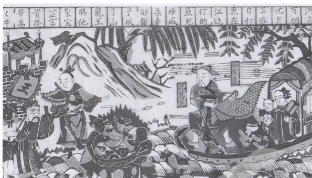
7. 沈萬三打漁歌 山東濰縣年畫