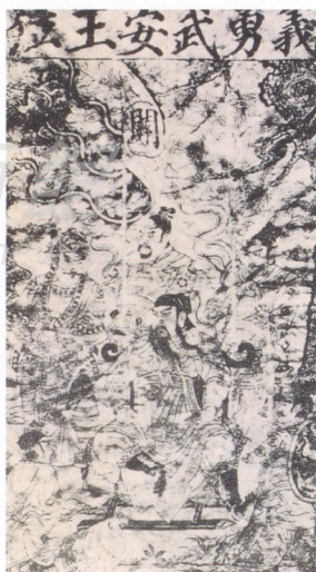
3. 義勇武安王位 平水徐家印