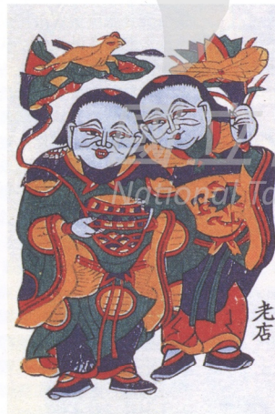
13. 和合二仙 朱仙鎮年畫