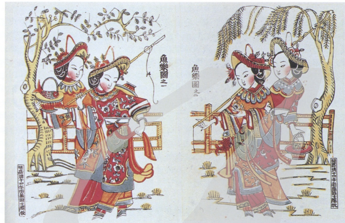
14. 魚樂園 陝西鳳翔年畫

年畫最先來自中國人避邪驅魔的心理，然隨著時代的演變及版畫技藝的發展，年畫已超越了原始目的，成為反映社會生活、表現民衆思想、感情和願望的藝術品，其內容題材廣泛且豐富。自古迄今，從城市到農村，無論人物、花鳥走獸或各種風俗、年