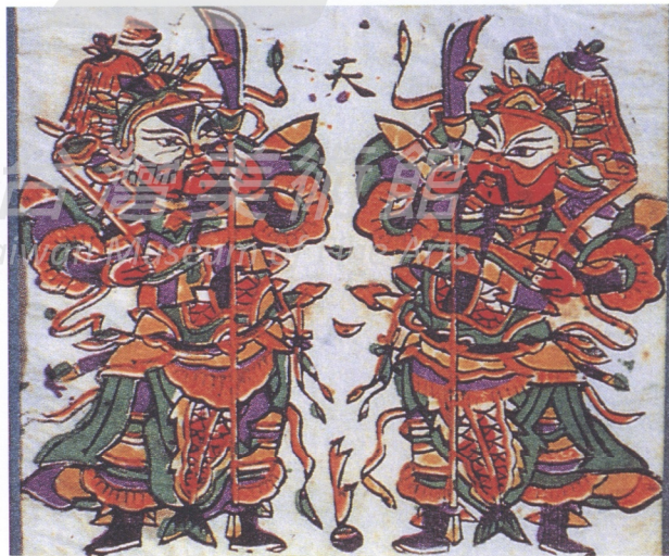
12. 門神 朱仙鎮年畫

稿、雕版到印刷都是鄉村農民親自動手，其中包括請廟宇畫匠設計製作，它緊密配合民俗需要和人們的審美趣味，造型優美，樸實大方，線條剛勁有力，色彩簡練明快，形成鳳翔年畫獨特的藝術風格和濃郁的地方特色，普遍受廣大農民的喜愛。