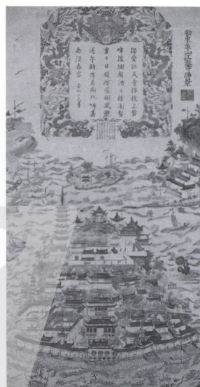
10. 勸建金山天寺勝嚴圖 蘇州年畫

宋朝是我國造紙業的發展時期。汴梁即今開封，是國都與政治、經濟中心，朱仙鎮屬開封府管轄，開封所售的紅紙、門神等，主要是朱仙鎮生產的。據李步青、廉方編寫的《岳飛與朱仙鎮》中談朱仙鎮木版畫：「紅紙、門神係舊習過新年之消用物，為鎮中最著名之特產，往昔盛時，業此者三百餘家，出品銷於臨近各省，大有獨佔市場之勢。」