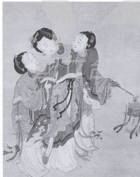
9. 三美人圖 蘇州年畫

綿竹年畫的題材以文官、武將及戲劇故事中的人物為主，情境故事表達較少。其表現手法分為紅貨（彩繪）、黑貨（黑拓）