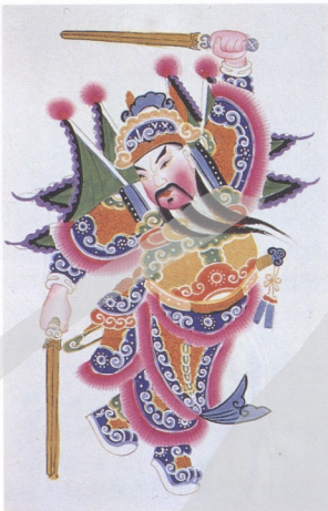
11. 門神(秦瓊、尉遲恭) 四川綿竹年畫(一對)