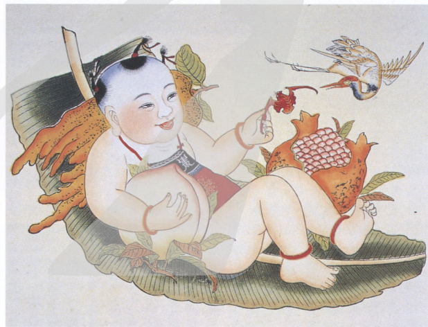
5. 多福多壽多男子圖 楊柳青年畫

楊家埠已有公茂、永盛、吉興、廣盛太、萬順等數家畫鋪。乾隆初年西楊家埠一帶畫鋪生產規模迅速擴張,繼有萬盛、德盛、義和、萬增等年畫鋪相繼開業,而原來之公茂畫鋪更發展出分店來。至咸豐年間西楊家埠已發展到60家左右,東楊家埠也出現了永順、公盛永兩家畫鋪。由此可見當時年畫業之普及繁榮,已到