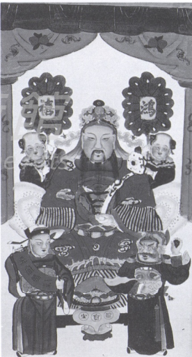
8. 天官賜福 山東濰縣年畫

桃花塢年畫的表現方式有兩種不同的風格，一是受傳統木板插圖的影響，印刷方法兼用著色和彩色套版，顏色方面常使用紅、黃、藍、綠、紫、灰、黑等七色；一是受歐洲銅版畫影響，強調焦點透視法，以及遠近明暗的對比，整個畫面用平行的粗細線條分出陰陽濃淡，追求銅版畫效果，其構圖繁複，層次井然，展現出高度工藝性版畫技巧。作品