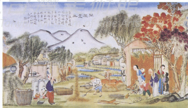
6. 同慶豐年 楊柳青年畫