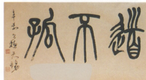
2. 草書 1991