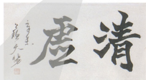
3. 楷書 1991