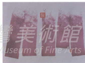
2 禪——65 1981 布上壓克力

「點」(Punto, 中文又譯「龐圖運動」)及「太陽」(Surya)等國際藝術運動。此後的二、三十年蕭勤以客居的米蘭為基地，輾轉走訪於巴黎、倫敦、紐約各大藝術之都，藉展出、講學獲致多方讚譽，也因而得以與諸多國際藝術大師相