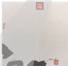
1 禪 1977 布上水墨

1956年7月，蕭勤獲西班牙政府獎學金而負笈該國，開始旅居海外三、四十年的生涯，求學的赤忱，旋即因發現西班牙美術學院作風保守而遭洩息，但仍躋身該國藝壇，於1957年在馬達洛 (Matarò) 舉辦了生平第一次個展。值此時，第一屆「東方」畫展，亦在臺北、巴塞隆納兩地同時展出。1958年是其自我風格逐漸成形之始，奠定蕭勤藝術「以色彩表達中國書法影響下的對稱形式表現」。1959年蕭勤遷居米蘭，加入義大利前衛藝術圈，並與多位享譽國際的藝術家發起