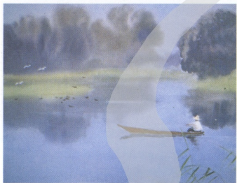
7 古元(大陸) 風景

情景，也可能是接觸傳統氣氛，文人不求名利、投閒置散的生活態度，或當今水墨畫及文人畫的簡筆影響，反而流於表面技巧和類同者居多的現象，吳冠中水彩的瀟灑，算是脫穎而出；名家古元追求茫濛之美；老畫家王肇民風景色彩帶墨味，水果功力沈實；老將李劍晨、李詠森異於大陸普遍的水粉畫（不透明及附帶粉彩）風格，以深厚的透明英式水彩，表現東方情趣。近年青年畫家以都市、農村及邊疆題材，呈現超寫實風貌，加入幻想、點描和敘述手法，進展不少。