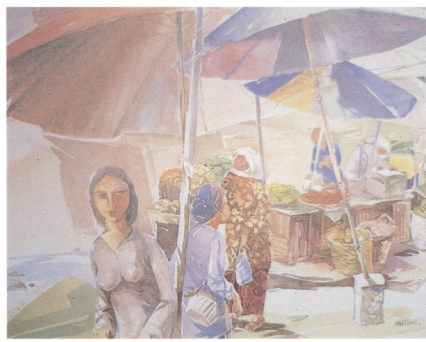
11 張耐冬(馬來西亞) 愉快生活在馬來西亞