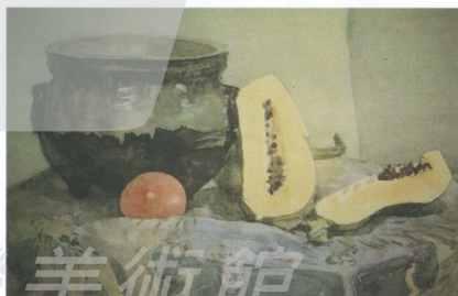
8 王肇民(大陸) 水果

香港官方很少舉辦水彩競賽，間有來自英國的原作展，早期美新處舉辦會景文畫展，使港人大開眼界，了解水彩藝術。長居當地的前輩畫家靳徵天，至今以亮麗寫實的透明水彩領導年輕學子和一般人士；陳福善老畫家早期以英式水彩啓迪畫壇；初中以下的學界是採自由