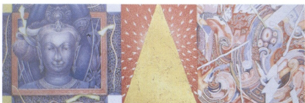
14 PANYA WIJANTHA NASARN (泰) 我的精神夢幻之旅