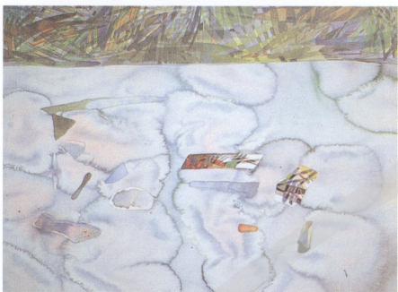
15 SOMSAK CHOWTA DAPONG (泰) 寧靜的時刻