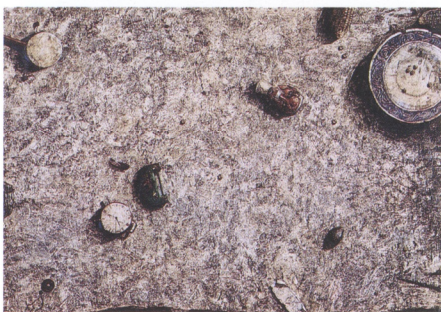
17 彭玉斗 軌跡