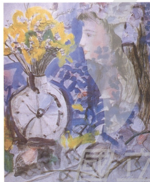
5 JANG TAE-MUK (韓) 無題

我們要知道，日本水彩畫盛行各類媒材（如炭精），而以鋼筆線條加以淡淡色彩的速繪水彩，或濃重色彩、用筆粗而拙的不透明水彩畫居多，除了少數有新意的畫家如：池田滿壽夫、山口薰那樣精嫻於透明水彩運用者外，恐怕成就仍是屬於早期留歐的先輩畫家淺井忠、