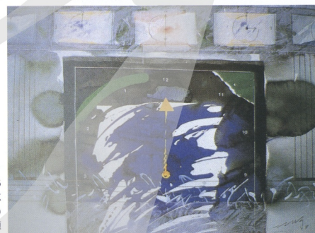
5 JANG TAE-MUK (韓) 無題

三宅克己等不可多得的日本水彩瑰寶級人物呢，不過日本在新潮藝術方面是很勇猛的，水彩也有過這種例子，如 SEIRYO IKAWA 表達之觀念性，北東部誠二的幾何抽象畫，都能脫離普遍凡俗手法。