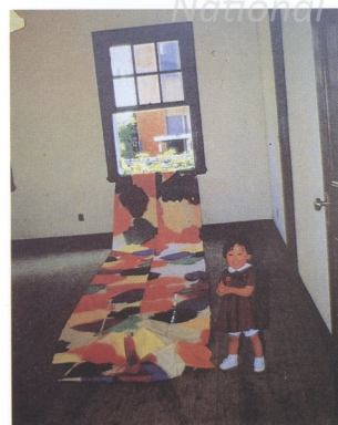
3 SEIRYU IKAWA (日) 參考作品