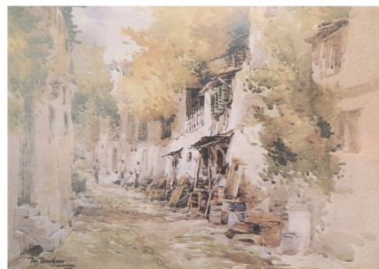
12 杜定坤(新加坡) 後巷