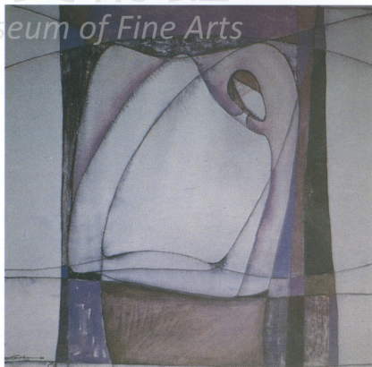
9 梁志明(香港) 休憩

教學方式，以不透明水彩為骨幹。中青年畫家們則結合本土、臺灣、大陸和少數其他地區的畫人，形成非組織而能集合的力量，間有水彩展示。臺灣師大與大陸回來的受過石膏素描訓練，本土年輕畫家多從設計、攝影界、自由業而來，具有新觀點，這個世界第一線貿易商埠，自然最能接受來自西方和大陸的刺激。新成立的香港水彩畫會長呂振光，與會員梁志明、呂豐雅等取材廣泛而題材較為抽象。