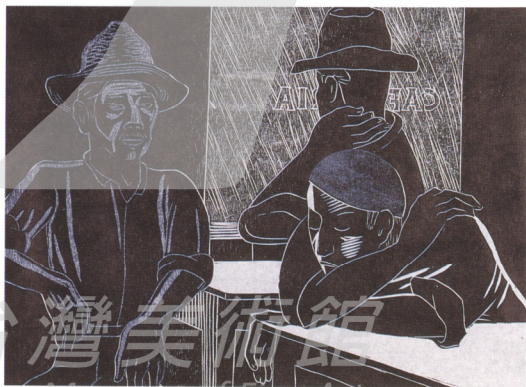
咖啡屋 16/25 1988