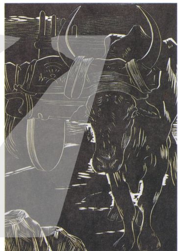
5 公牛 1950