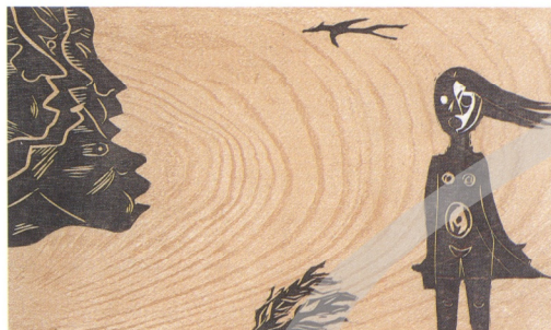
3 小孩與風 PA 1961