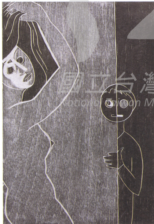
4 小孩 22/51 1982