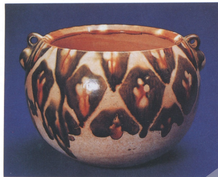
△唐 三彩雙耳罐 高14公分