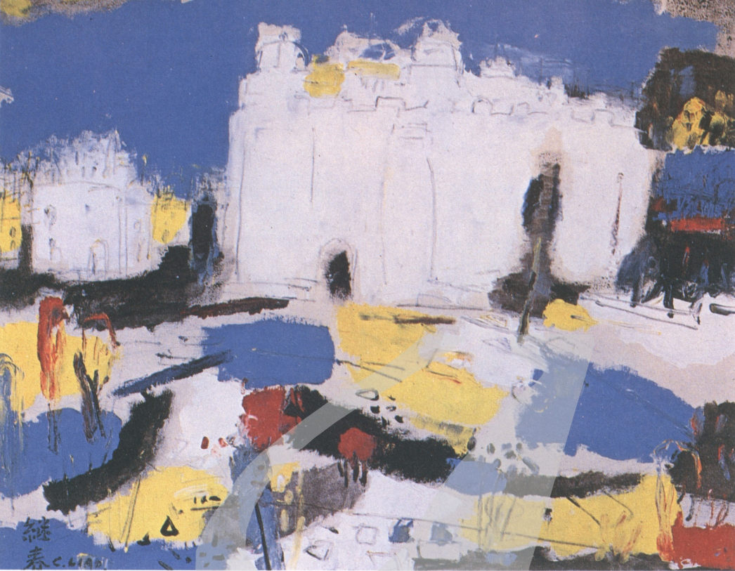
西班牙古城 廖繼春 1965