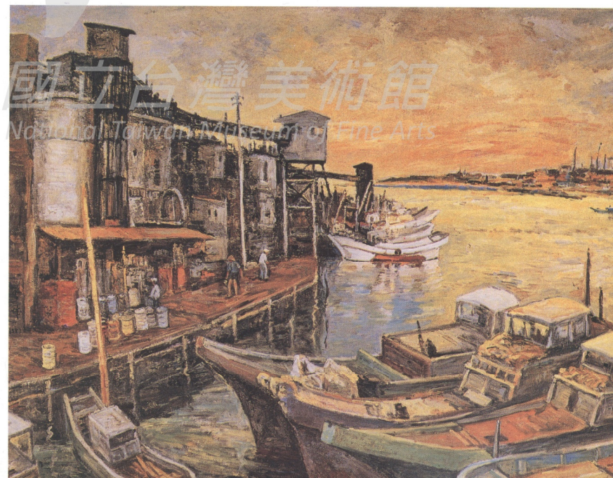
▷ 夕照 葉火城

國立台灣美術館 National Taiwan Museum of Fine Arts