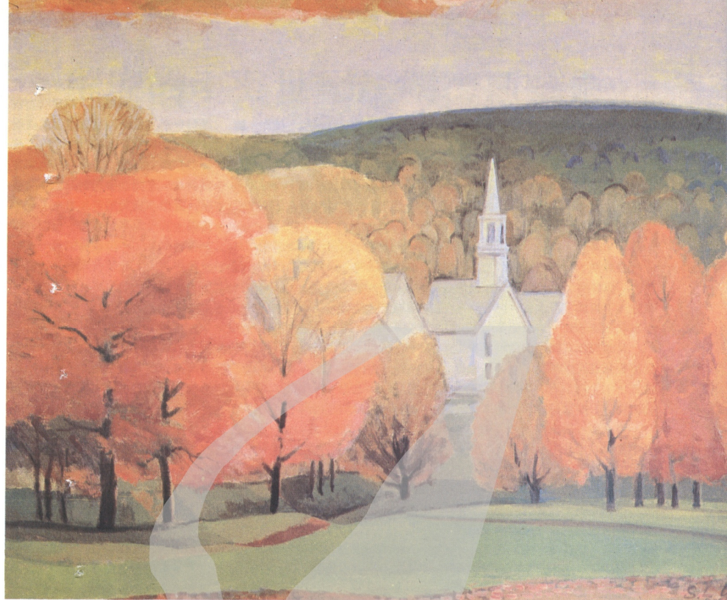
△ 秋色 顏水龍