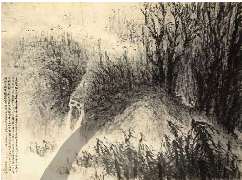
江明賢，〈暮歸〉， 1968，水墨、宣紙， 150×180cm。 此作獲得臺師大系展國畫 第一名。