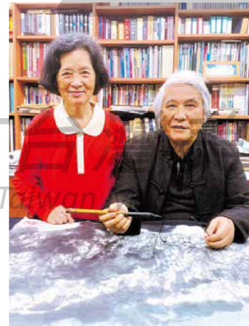
2023年，江明賢夫婦合影於工作室。

出生臺灣中部山區偏鄉一個樸實家庭，在前往臺北完成師範教育後，再出國留學西班牙、遍遊歐洲各大美術館，接著居留美國紐約，修習藝術史；回臺後，成為鄉野、古蹟的最佳代言人；到了 1980 年代中期，海峽兩岸在結束長期冷戰後，恢復交流，又成為兩岸文化交流最活躍且重要的推動者與實踐者。他的水墨創作，結合中西、貫穿城鄉，既鄉土又現代、既文人又庶民、既抽象又寫實……，是一闕散發著磅礴史詩氣勢的山河之歌。他就是知名墨彩畫家江明賢。