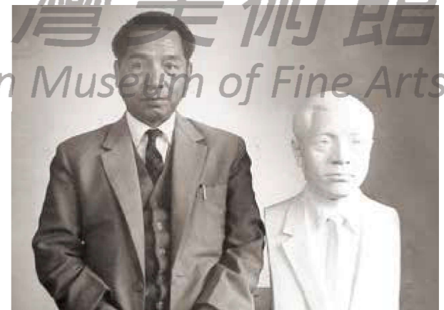
葉火城與其雕像合影。

葉火城一生偏愛風景繪畫，人物畫同樣生動，其觀察力敏銳，著重色彩、質感、肌理的探索，不附隨於畫派，畫作呈現出質樸、厚實、豐盛的美感，是一位令人敬佩的臺灣美術家。（編按）