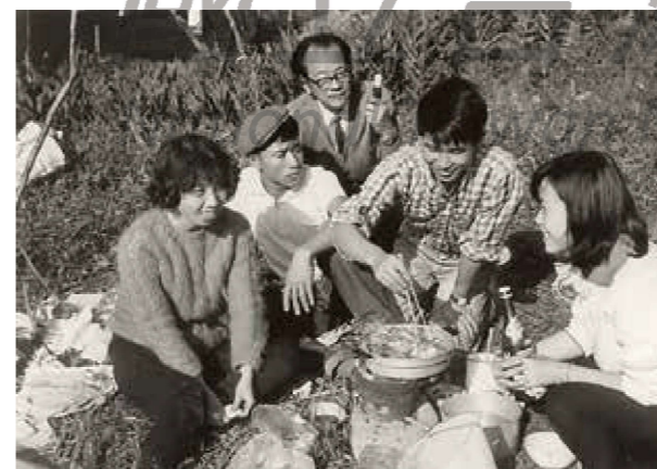
上圖： 江明賢，〈東港漁民〉，1968，墨彩、宣紙，138×68cm。

「寫生」是當時臺灣師範大學藝術系美術教學最重要的主張；不過，同樣是「寫生」，卻也有進階式的訓練。先是「直接寫生法」，要求的是態度的完全忠實而客觀；接著則是「間接寫生法」，面對自然，經過主觀取舍，師造化而要求得其神韻。最後再以「對景生情法」，掌握大自然的抽象語言，或觸景生情所生發的情感，加以表現；〈暮歸〉和〈東港漁民〉正是屬於這樣的創作類型。