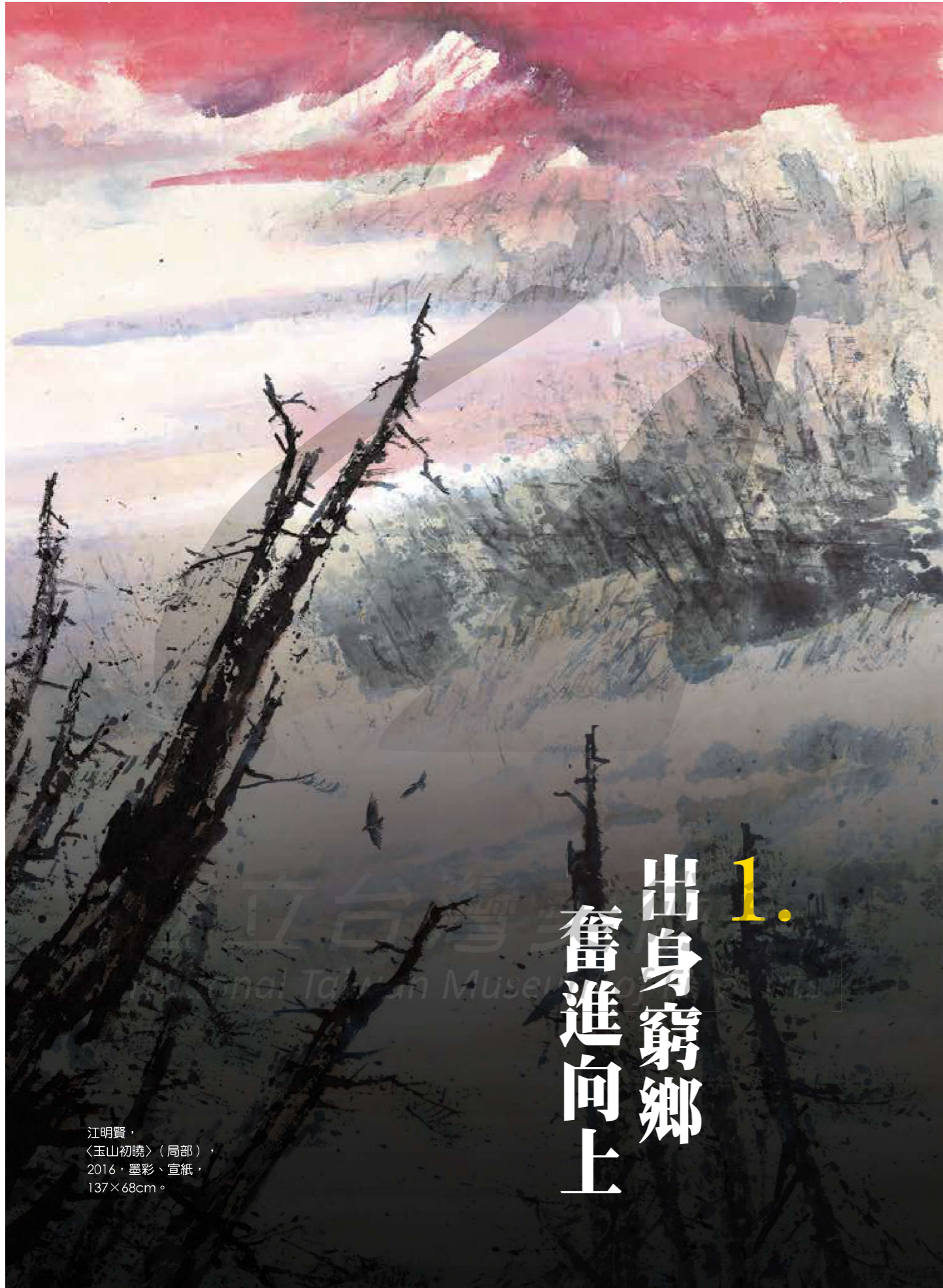
江明賢， 〈玉山初曉〉（局部）， 2016，墨彩、宣紙， 137×68cm。