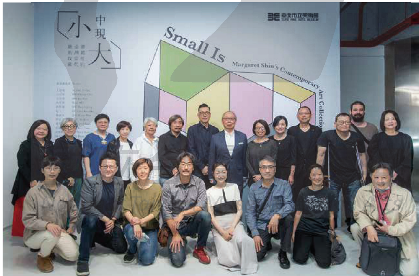
【上圖】臺北市立美術館「小中現大：蕭麗虹的臺灣當代藝術收藏」主視覺。