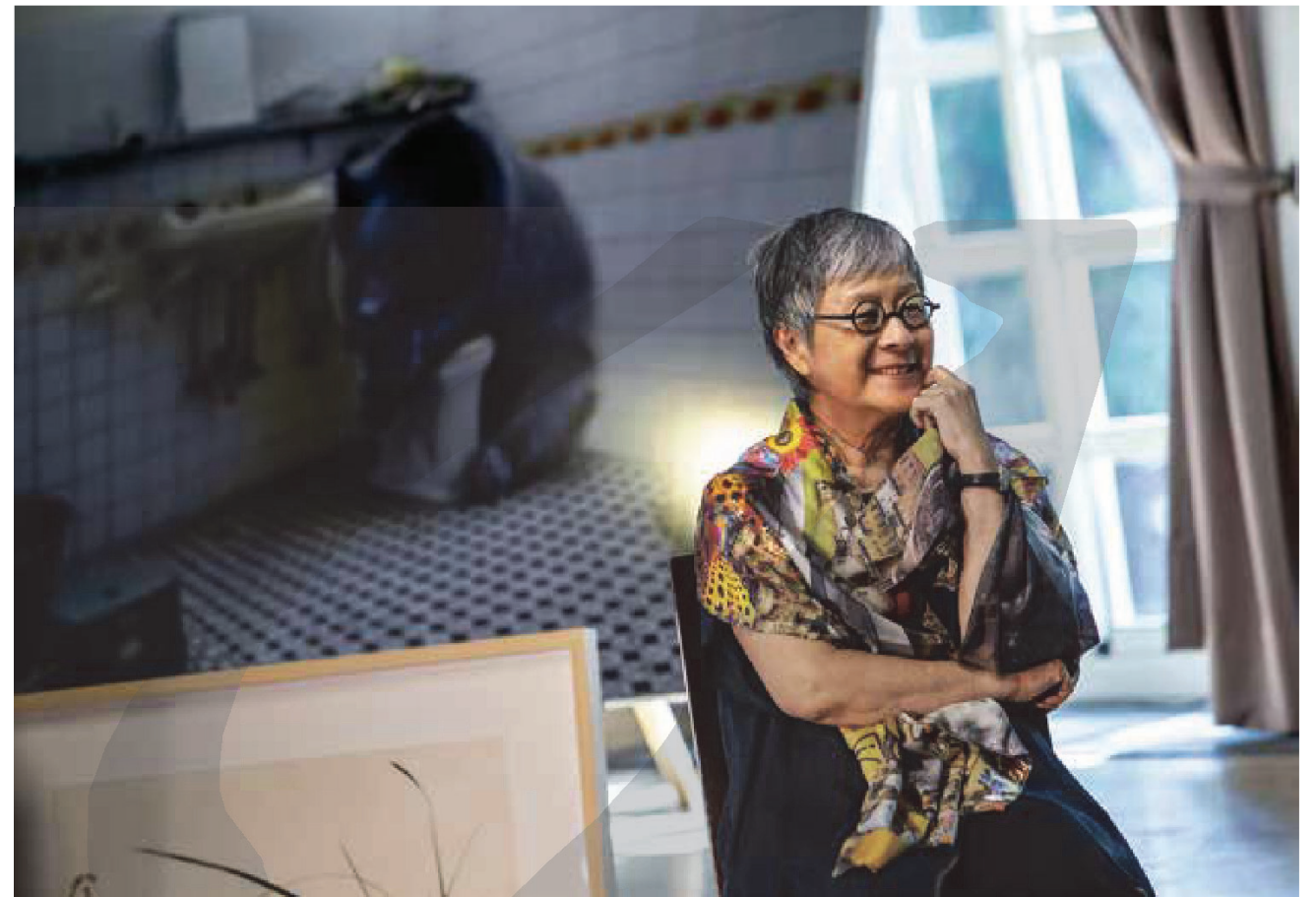
〔上圖〕2018年，《不良嗜好：收藏臺灣藝術40年》新書發表會於華山拱廳舉行。