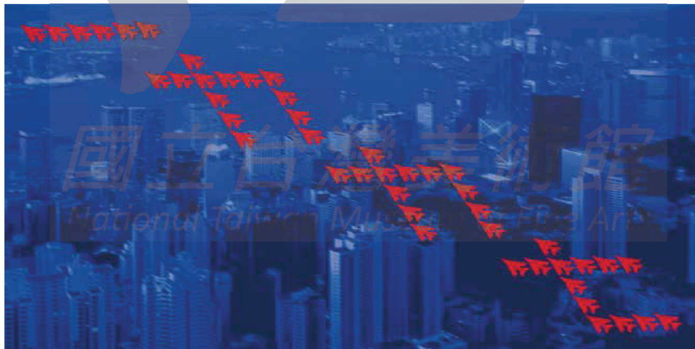
【上圖】「小中現大：蕭麗虹的臺灣當代藝術收藏」展場一景。