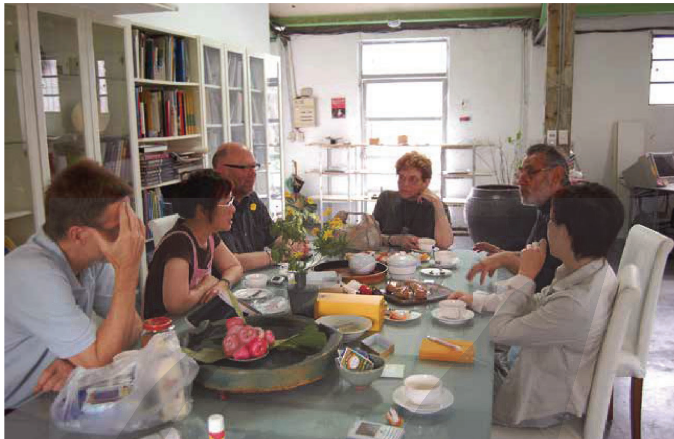
2007年，哈里森夫婦來訪竹園共同討論未來花園計畫(Future Garden)。