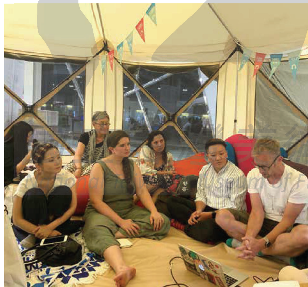
2019年，竹園工作室帶領駐村藝術家於視盟一年展發起分享會。