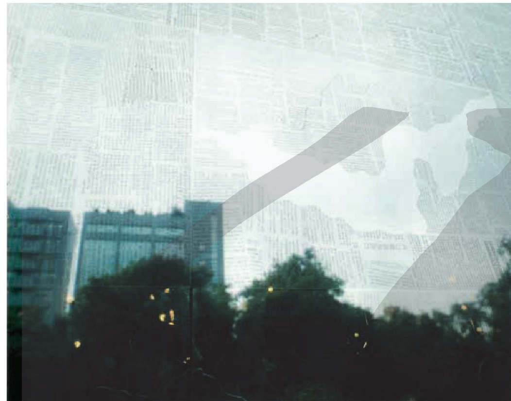
蕭麗虹，〈烏雲蓋天〉（局部），1993，投影紙，198×1135cm。

而在福華沙龍藝廊的「蒼穹之上，后土之下」展覽的觀眾參與計畫，則依場所屬性設計成具商業機制的慈善活動。蕭麗虹計畫將作品賣