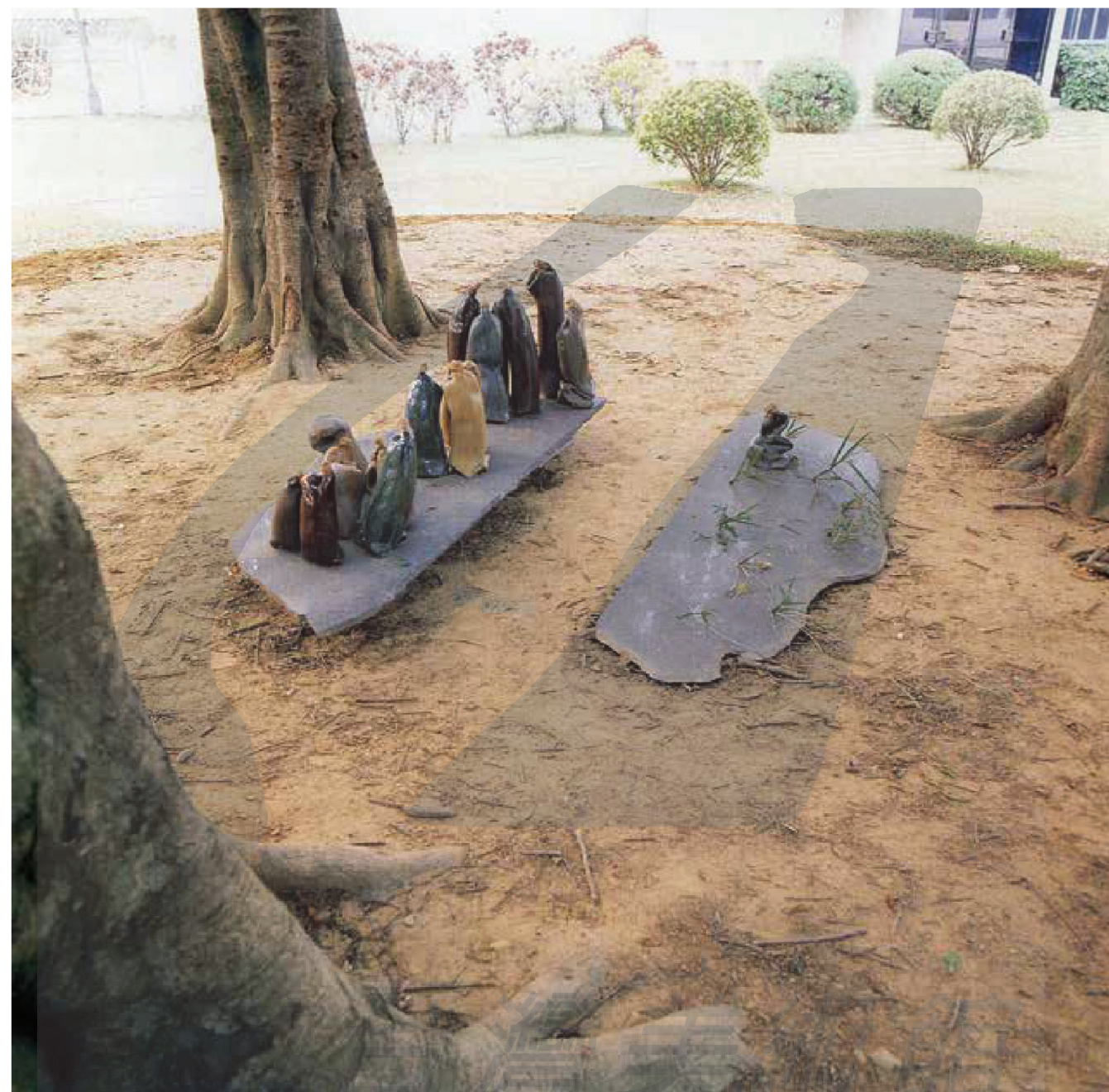
蕭麗虹，〈賢者聚〉，1992，陶土、石板、野草，207×168×59cm。於國立清華大學校園展出。