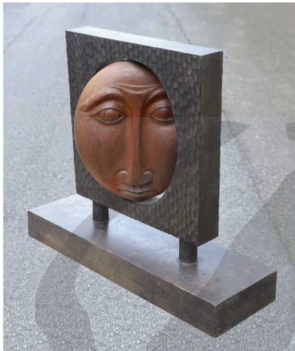
【上圖、右下圖】 鐘俊雄·〈思〉，1981，木雕， 58×51×9cm， 圖片來源：鐘斌浩攝影提供。

另外鐘俊雄非常喜歡研究日本文化與藝術，多次隨團去日本考察，其中他最喜歡京都的古老建築與廟宇，對於日本佛教雕刻留下深刻印象。他在雕塑部工作約十年之久（1972-1982），最後還是為了藝術選擇離開工作，雖然他丈人極力慰留，希望他能繼續待下來服務，仍敵不過藝術對鐘俊雄的強力召喚，而夫妻倆則選擇同進退。