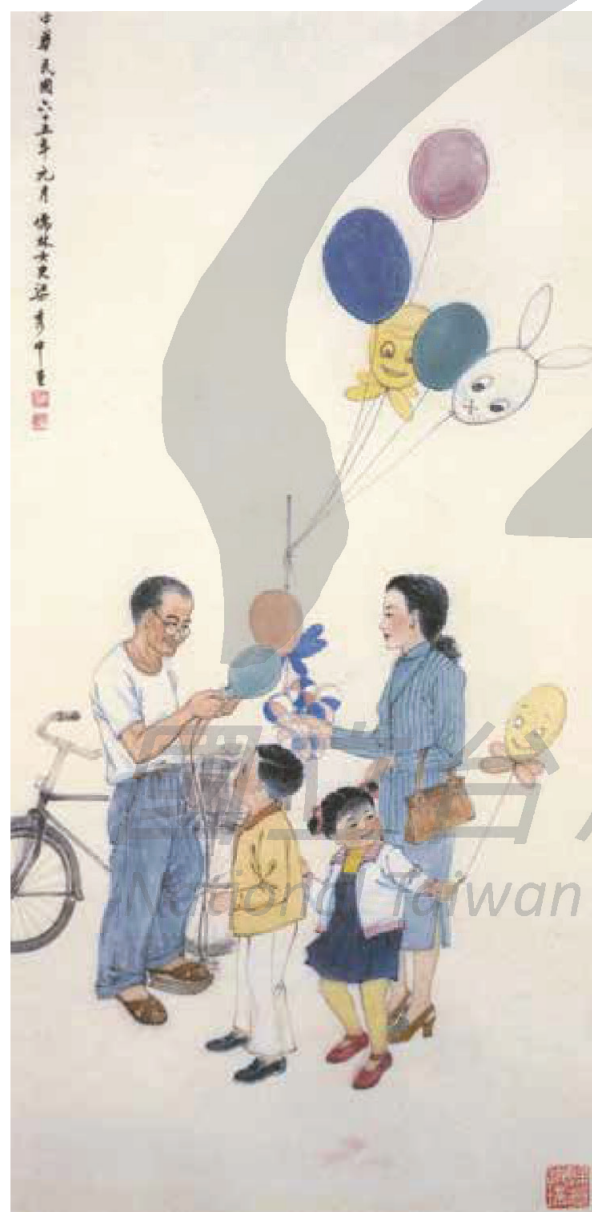
【右圖】 梁秀中·〈春訊〉·2010· 彩墨、宣紙，124×64.5cm。