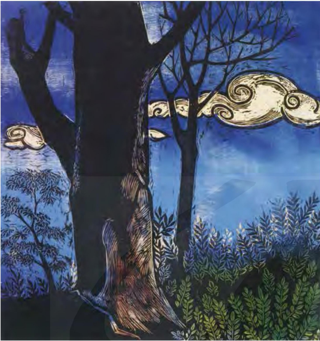
陳其茂，〈老樹〉，1976， 木紋木版畫，50×46.5cm， 國立臺灣美術館典藏。

徒生寫的《安徒生童話集》和魯迅著的《阿Q正傳》及《狂人日記》，使他也略知魯迅在上海推動木刻藝術之事。而張校長更帶給學校千冊兒童讀物，這些書是一位華僑捐贈的，其中一套彩色漫畫叢書，有《白雪公主》等故事，受到全校同學喜愛，圖書室充實了，同學們閱讀的興趣跟著提高，增進了課外知識。