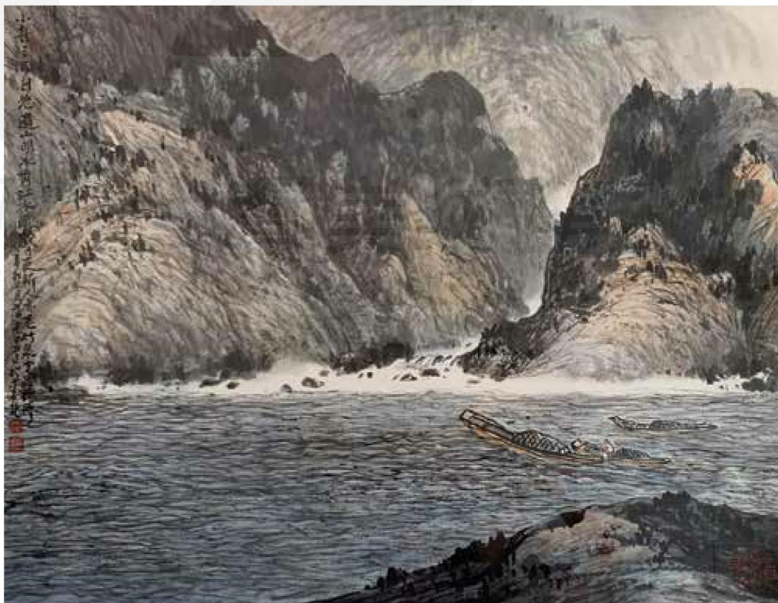
黃光男，〈小舟三五自悠遊〉，2011，彩墨、紙，尺寸未詳。