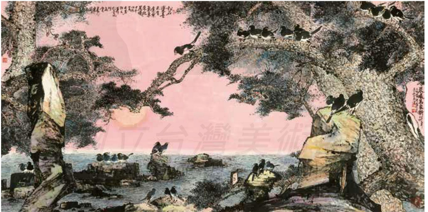
【上圖】 黃光男，〈玉石情〉，2013，彩墨、紙，70×136cm。