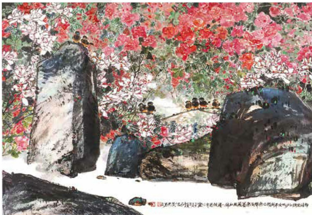
黃光男，〈安平新韻〉， 2019，彩墨、紙， 60×120cm。