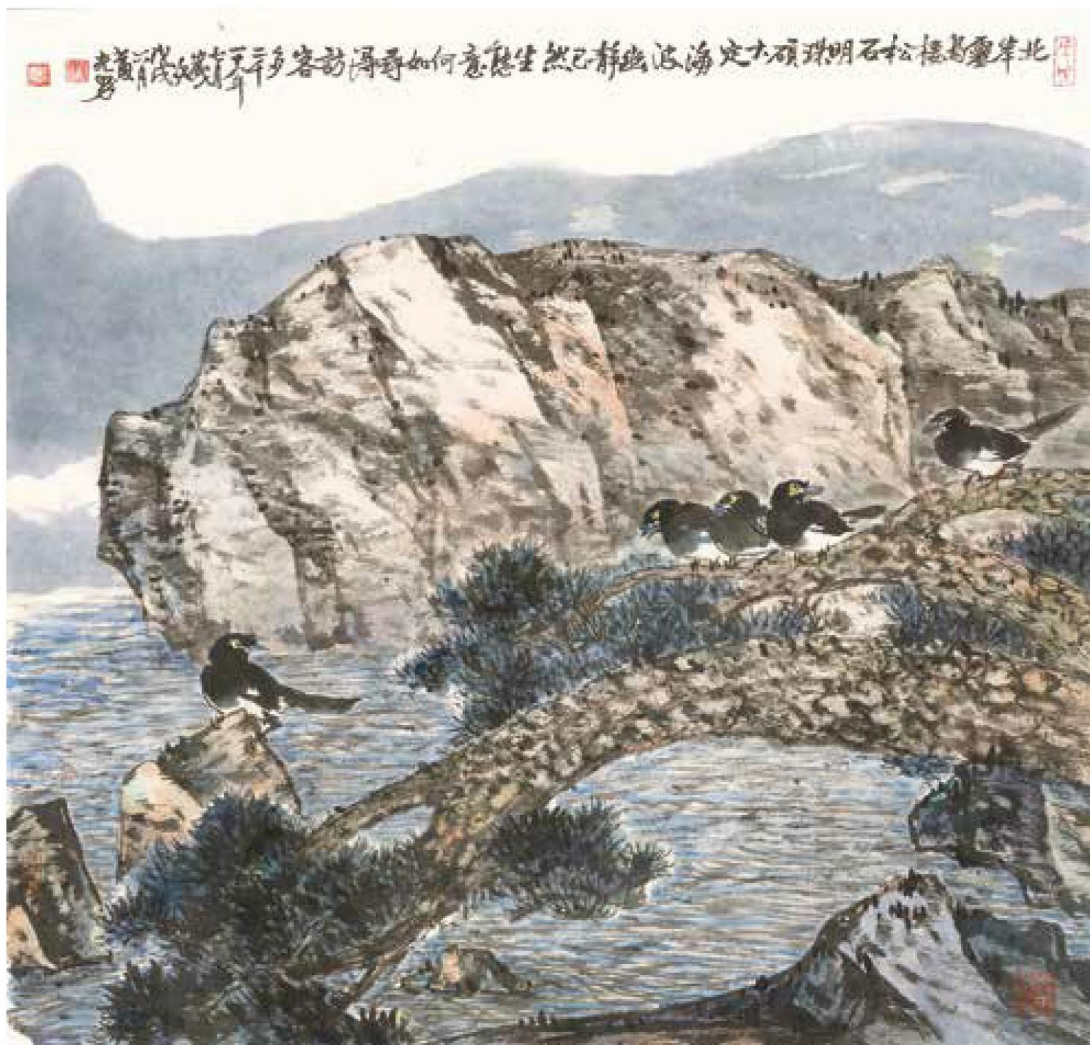
黃光男，〈松石明珠〉， 2018，彩墨、紙， 71×76cm。