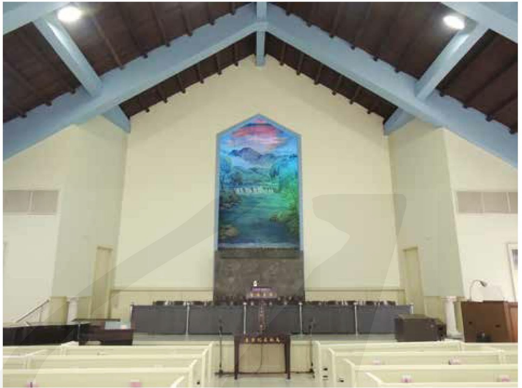
臺北會幕堂聖堂。