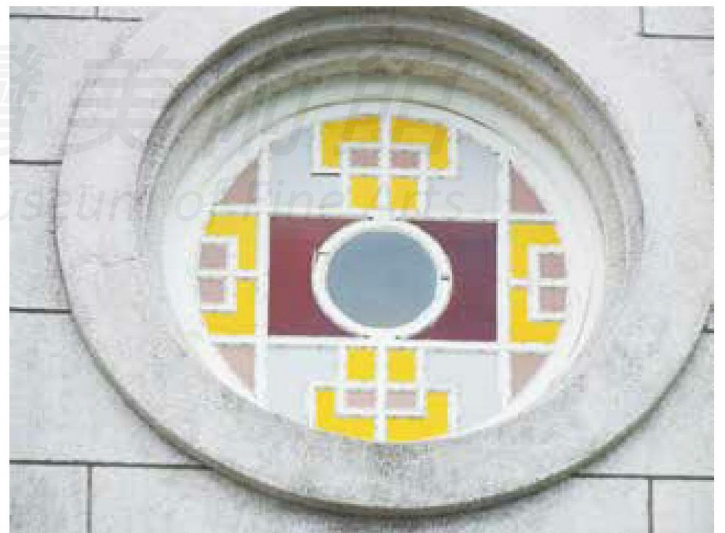
[左上圖] 建築物北側裝飾白色線條。圖片來源：施慧明攝影提供。 [左中圖] 窗格上有十字架形設計。圖片來源：施慧明攝影提供。 [左下圖] 窗格上有十字形設計。圖片來源：施慧明攝影提供。