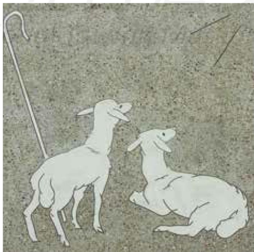
[左圖] 壁畫〈羔羊〉。