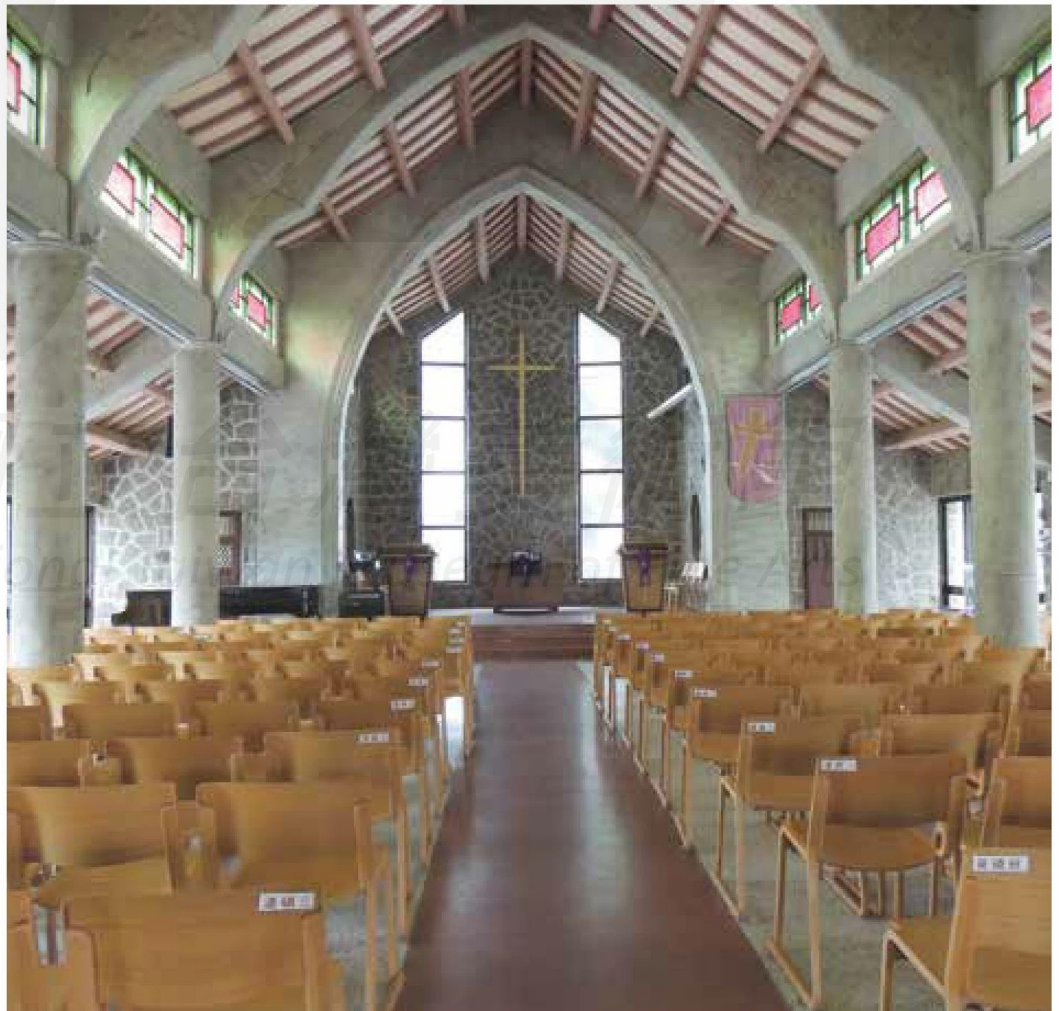
教堂通風採光極佳。