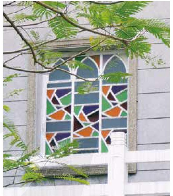
[右圖] 彩繪玻璃。