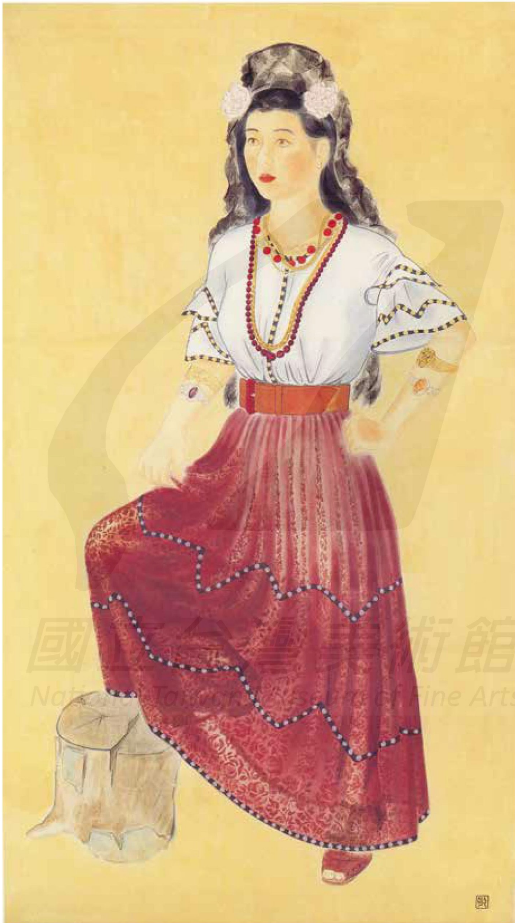
陳敬輝，〈吉普賽女郎〉，宣紙設色， 171×94cm。