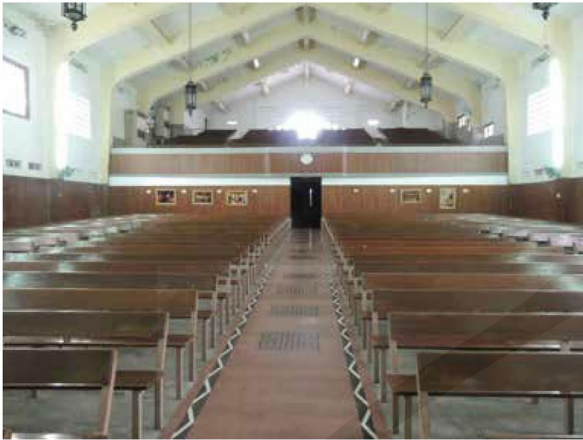
[左圖] 走道上的線條裝飾。