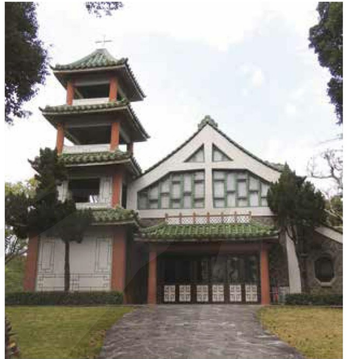
[右圖] 廊上設了整排的門。