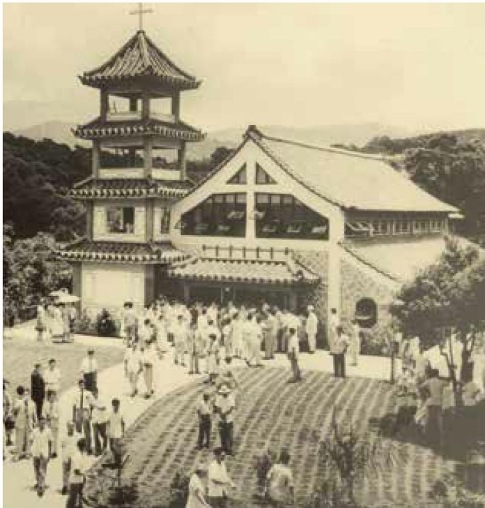
[左圖] 臺灣神學院禮拜堂於1958年落成。