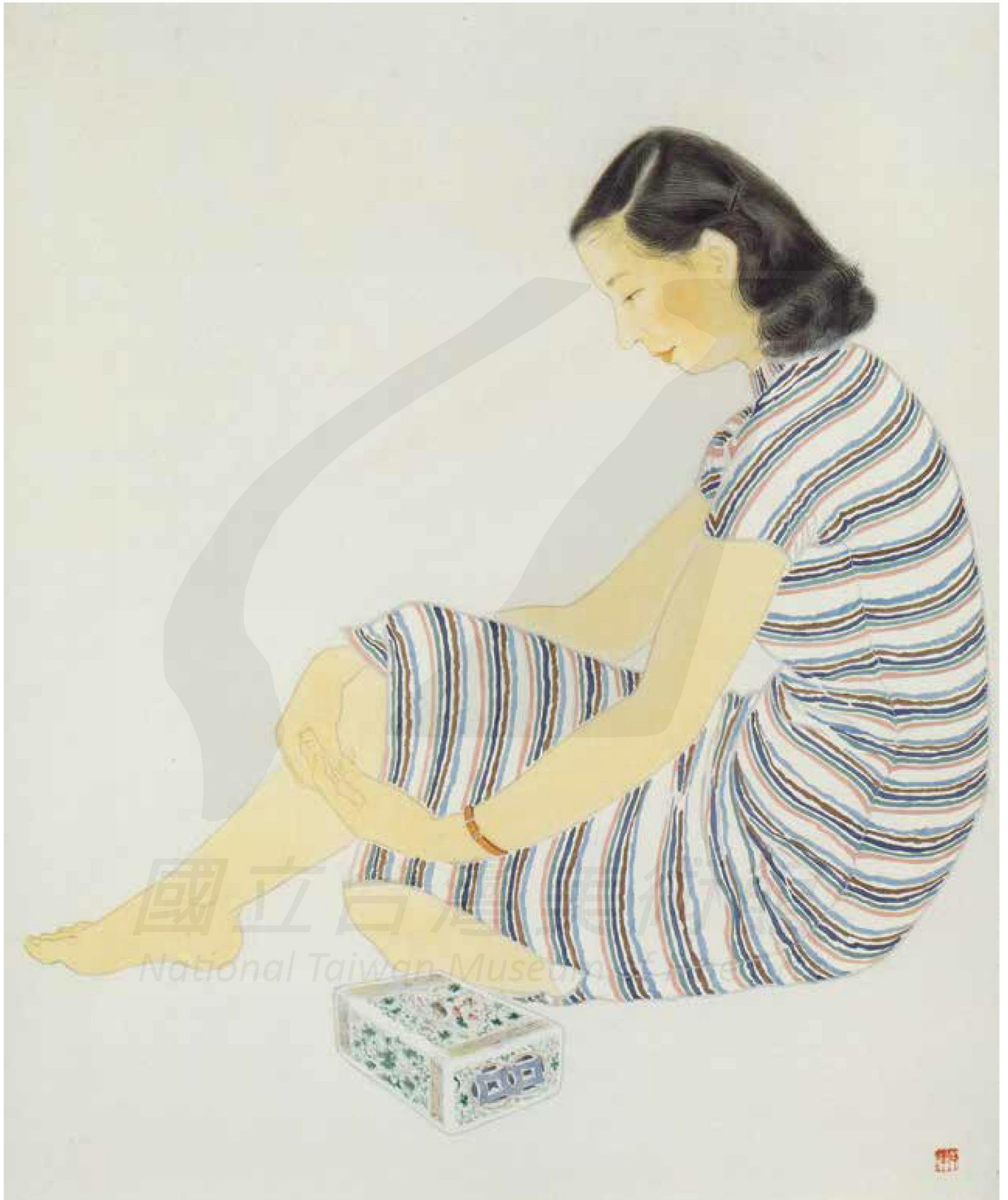
陳敬輝，〈少婦〉，紙本設色，93×78cm。

[左頁圖] 陳敬輝，〈默想〉，膠彩，78.5×57cm，1976，國立臺灣美術館典藏。