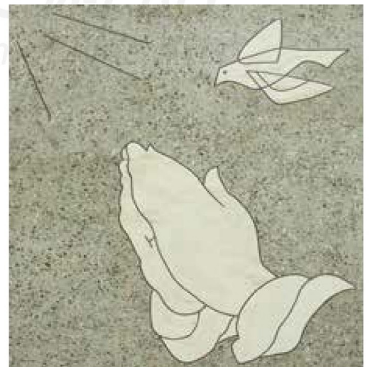
[右圖] 壁畫〈祈禱〉。