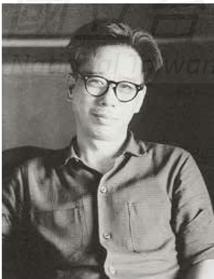
【本頁圖】 面帶微笑的陳敬輝。

陳敬輝晚期的人物畫作品具有強烈的個人風格，揉合中國文人筆墨與東洋寫生筆法，充分表達時尚性的現代人物畫風格。包含：外形的掌握、身體的動態轉折、衣著花紋的描寫、甚至內在的情感、單色背景的變化處理，都是陳敬輝繪畫風格的特色，成為臺灣美術的先驅畫家，迄今仍未有畫家能夠望其項背。1958年他為臺北會幕堂繪製3公尺高、2公尺寬的油彩掛圖〈約旦河〉；1965年淡江中學大教堂的設計及兩幅壁畫的製作；1958年與建築師林慶豐共同設計臺灣神學院禮拜堂等，都留存有陳敬輝獨特巧妙的線條造型。