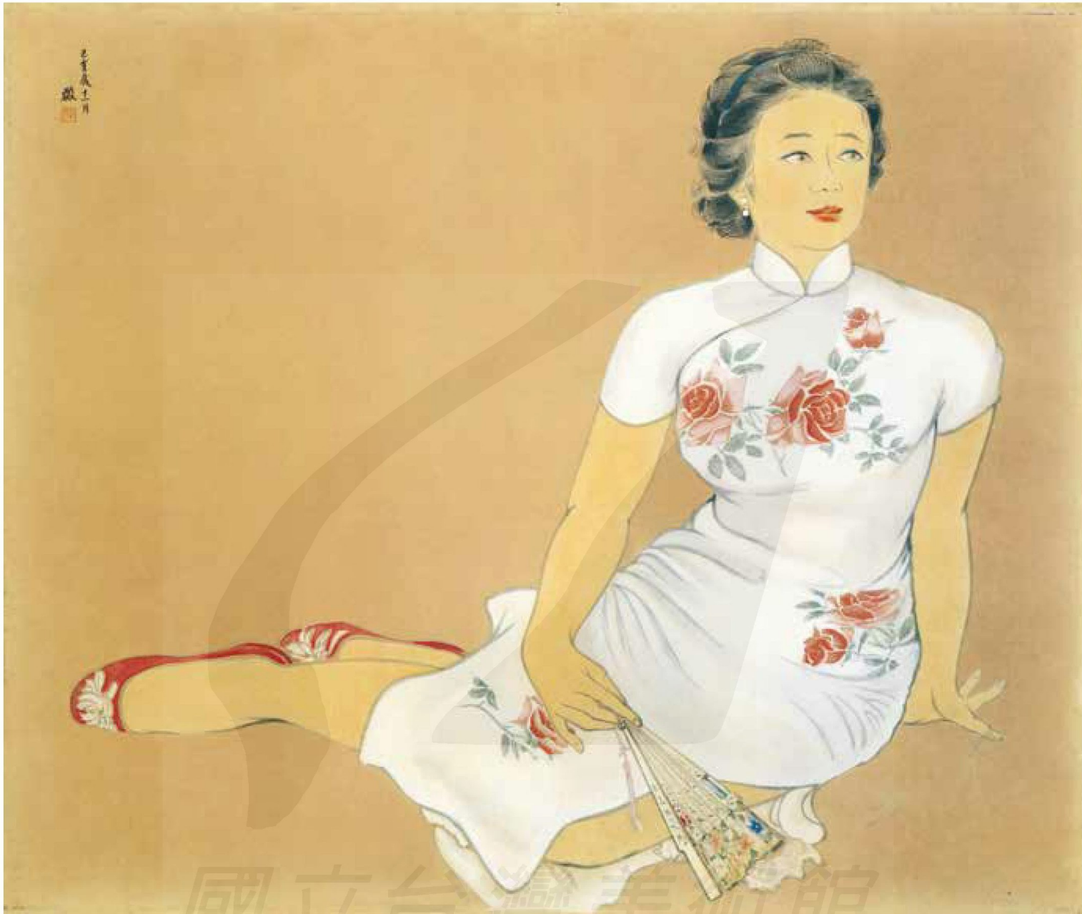
陳敬輝，〈慶日〉，膠彩，77×91.5cm，1959，國立臺灣美術館典藏。