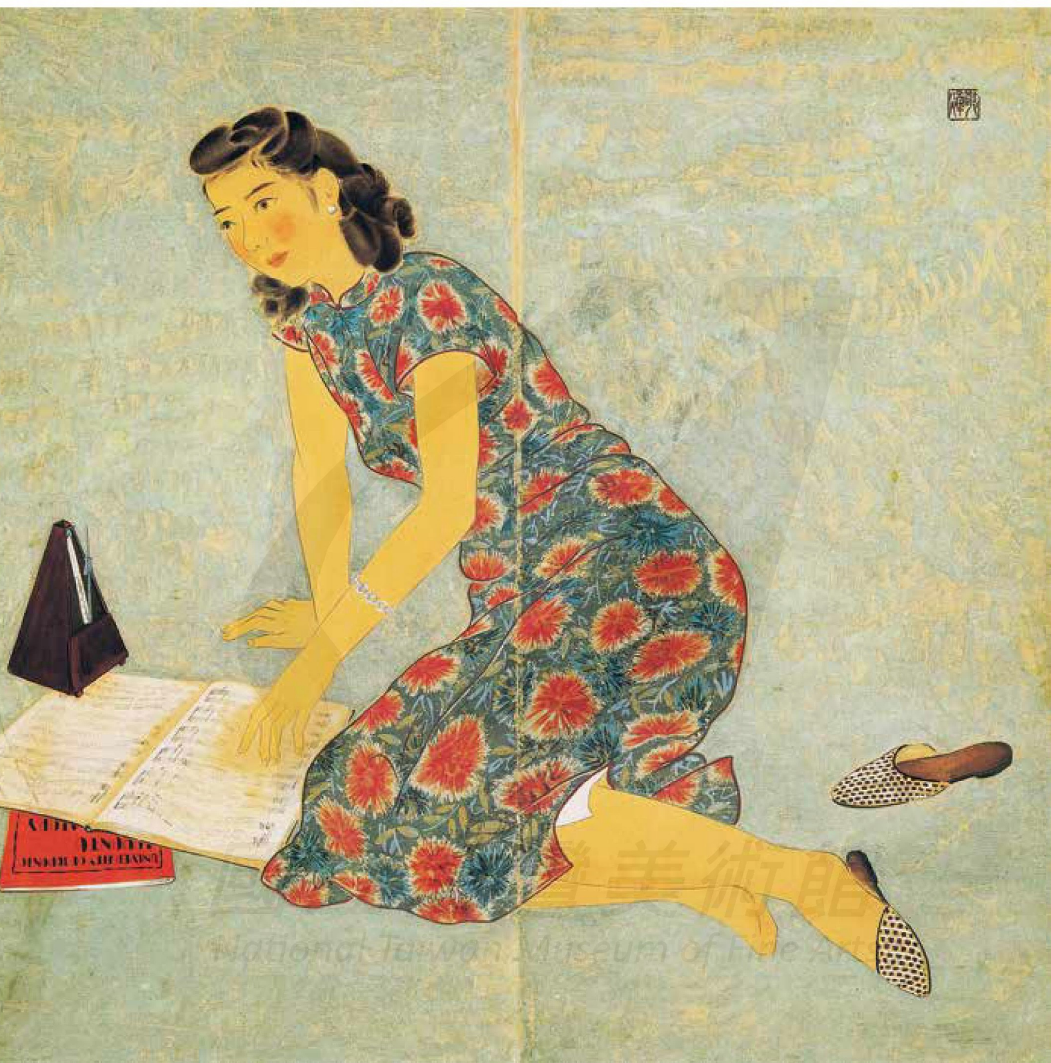
陳敬輝，〈看琴譜的少女〉，紙本設色，132×134cm（雙幅）。