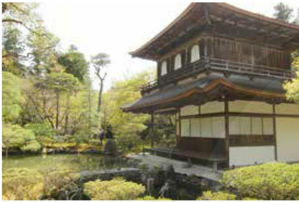
【下圖】 銀閣寺一景。

京都是日本的古都，最出名的古蹟「金閣寺」與「銀閣寺」分別代表室町幕府時期的「北山文化」和「東山文化」。北山文化混合了從古以來的公家文化和新的武家文化，是華麗而且有貴族特質的；東山文化則是各地的大名（諸侯）所帶來的文化相續發展而成，是苦澀且寂靜的，兩者差異南轅北轍。