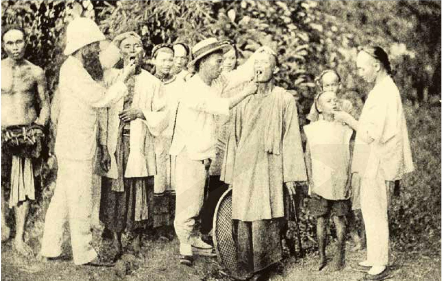
馬偕為居民拔牙的歷史照片。

拿大兩次，一個外國人跑到萬里遠的臺灣，克服種種艱難和險阻，堅持真理與愛心，如他自己的名言：「寧願燒盡，不願腐朽（Rather burn out than rust out）」，這句話也成為西方歷史學家對馬偕一生的註解。