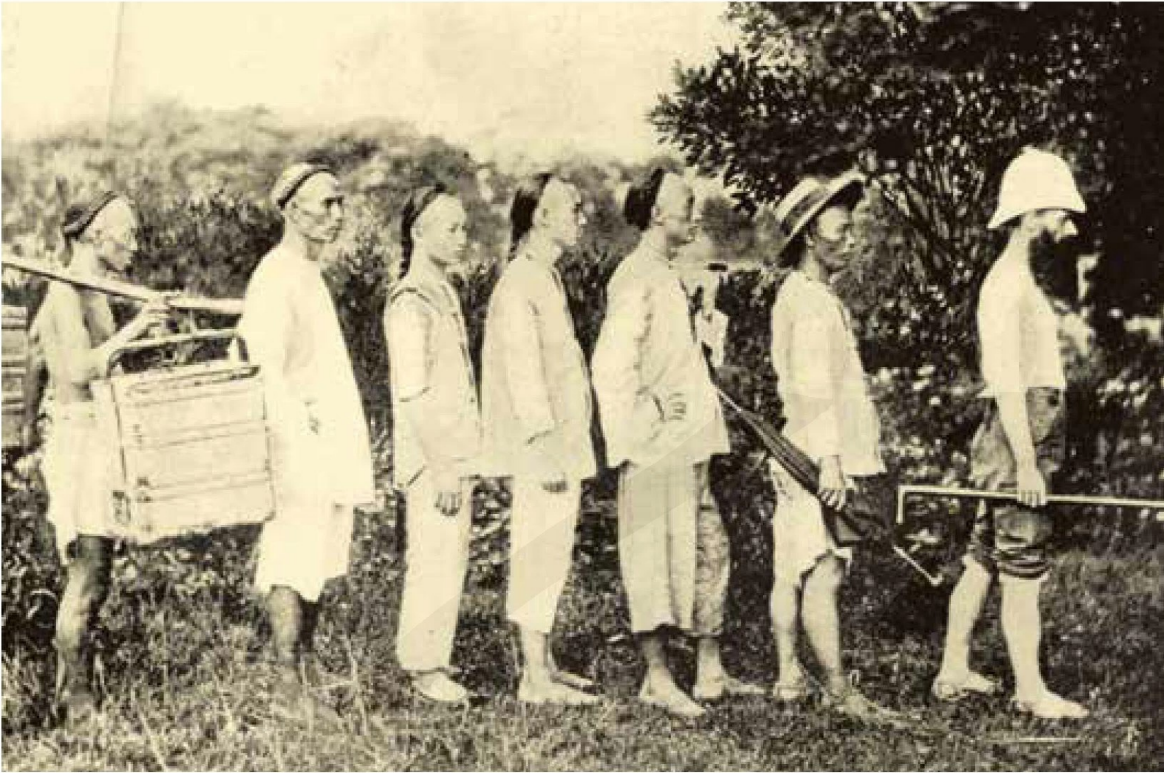
馬偕經常帶領學生徒步傳道旅行。