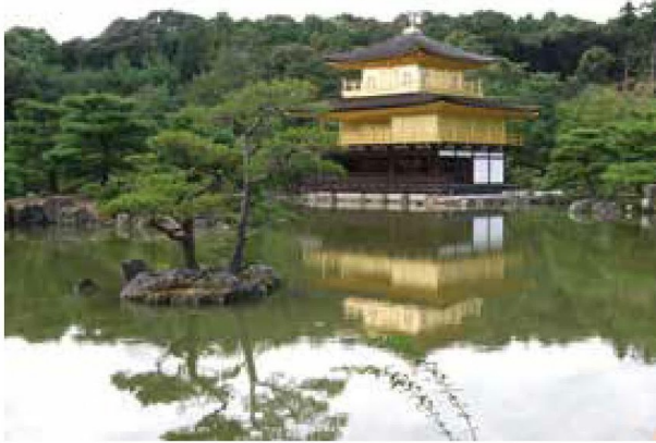
【上圖】 金閣寺儷影。