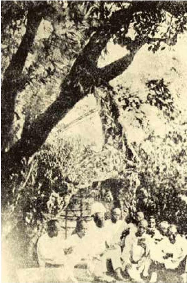
[左圖] 馬偕在榕樹下上課。