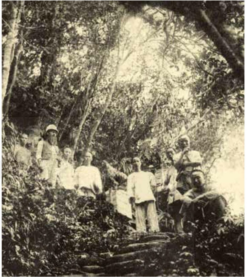
[右圖] 馬偕與學生旅行於三貂嶺古道。

馬偕到淡水不到半年，已經有十多位學生在他家中生活和讀書，在民眾眼中馬偕的住所儼然是一所私塾，這些學生除了滿足心靈與信仰的追求，並藉著馬偕所提供的西方知識，大大拓展了他們的視野。馬偕重視學生的生活教育，嚴格培養其良好生活習慣，而且非常疼愛學生，常為學生紓困，而他自己也致力於教學並勤做各種研究，因此深得學生愛戴，經常帶領學生徒步傳道旅行，隨時就地授課！