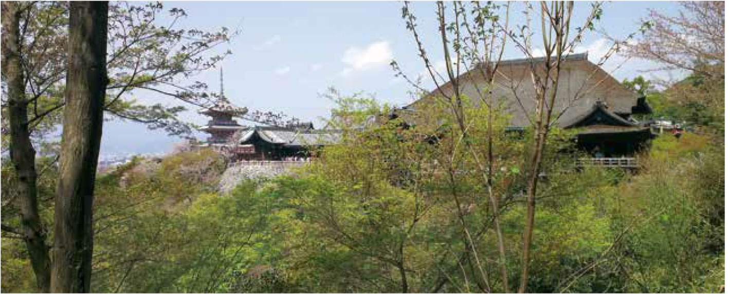
京都都是日本古都。