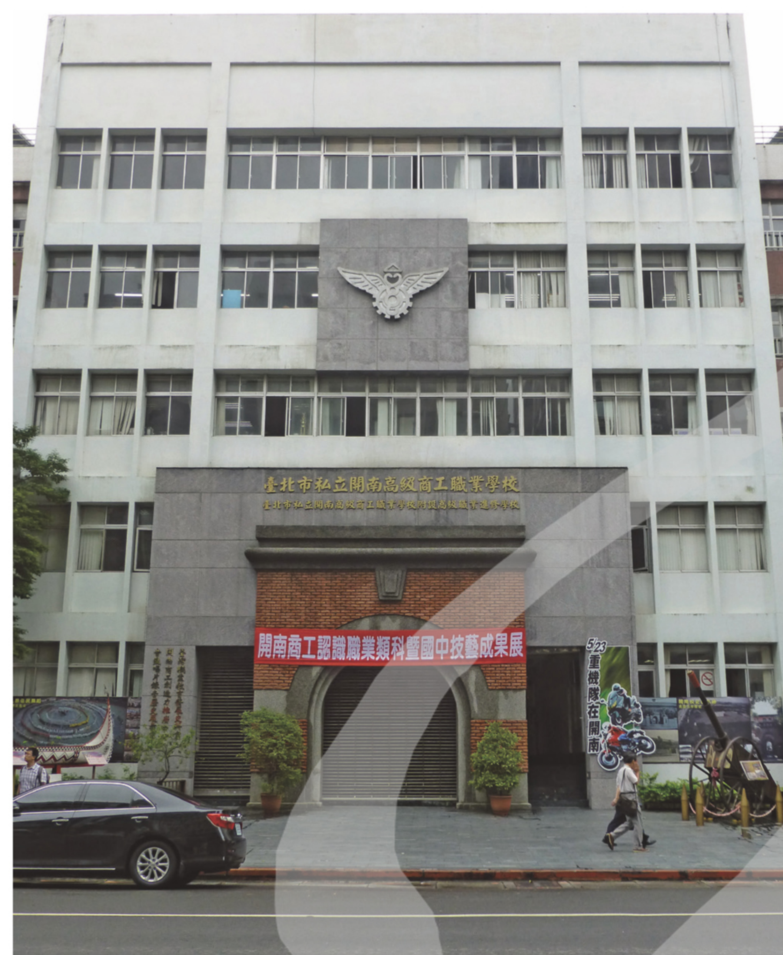
〔左圖〕 臺北開南商業學校正門一景 (今為開南高級商工職業學校，2015)

賴傳鑑雖然成長於現代文學、美術教育並不普及的鄉下，卻很幸運地獲得既有教學熱忱，又有才華的老師之引導，以及父親的支持，因此得以發展個人在文藝方面的興趣。另一方面，由於他喜愛閱讀與思考，因而從小學五、六年級開始，就透過函購來的「講義錄」，研習小說、劇本、詩的文學寫作，涉獵書法、插圖、水彩、油畫等美術領域。換言之，從十二、十三歲開始，年少的賴傳鑑即靠著學校老師啟發與個人自修，汲取現代文學、美術的知識與技藝，奠定了日後創作根基。