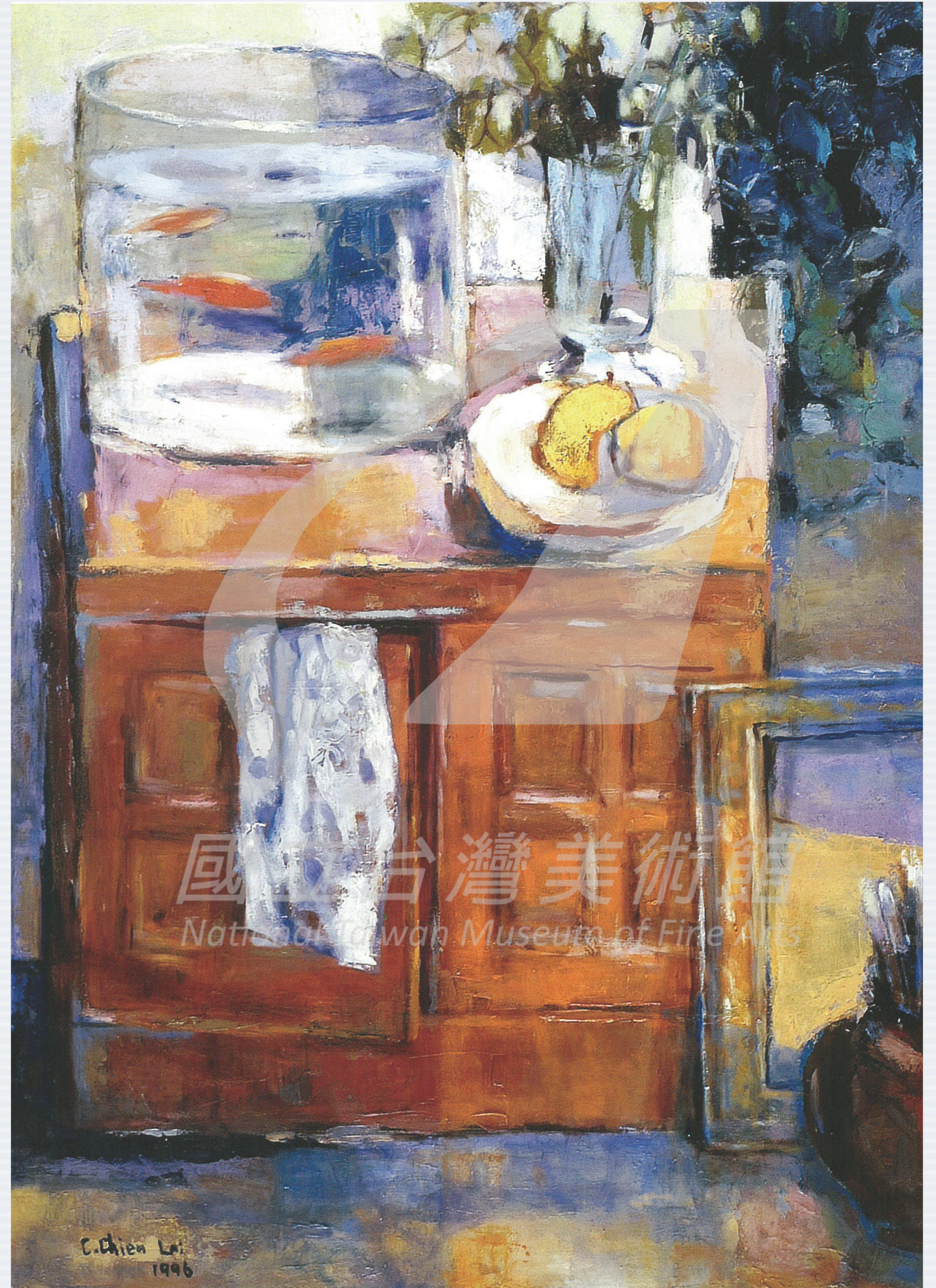
【右圖】 賴傳鑑 畫室的靜物（局部） 1996 油彩畫布 91×72.5cm