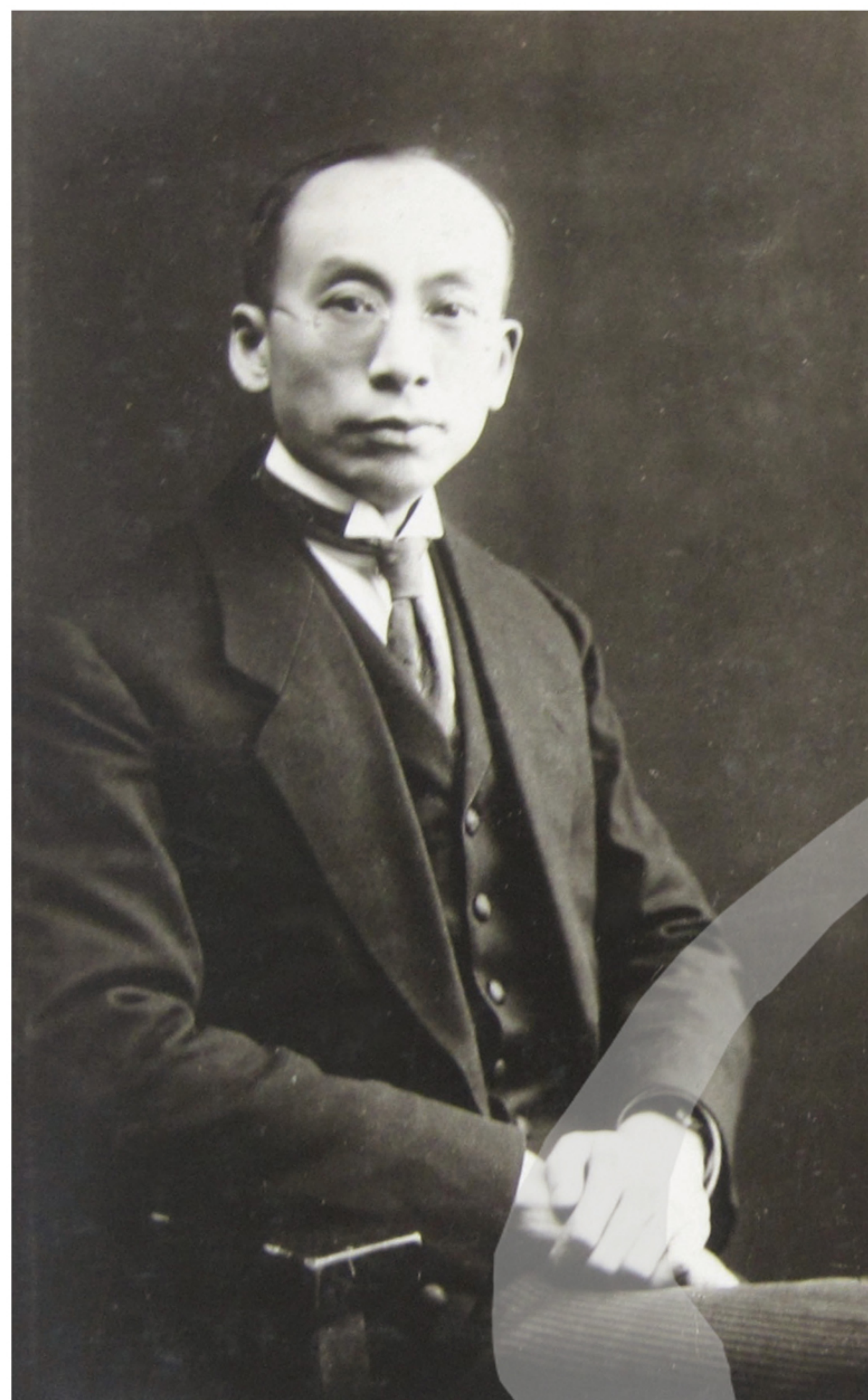
〔左圖〕 1927年2月蕭友梅攝於上海