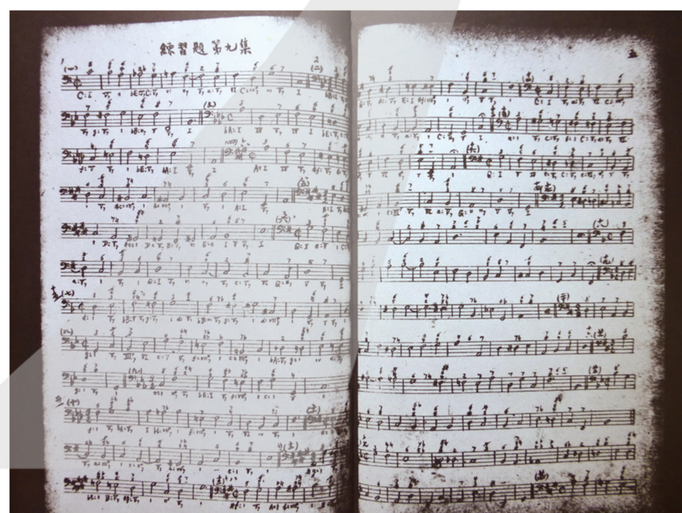
【右下圖】蕭友梅著「練習題第九集」書影

父蕭伯林負擔，甚至留學德國期間仍匯款資助，因此蕭友梅對他的哥哥充滿感激之情。此時蕭友梅加入「中國革命同盟會」，而與孫文、胡漢民（1879-1936）與廖仲愷（1877-1925）等人關係更為友好。