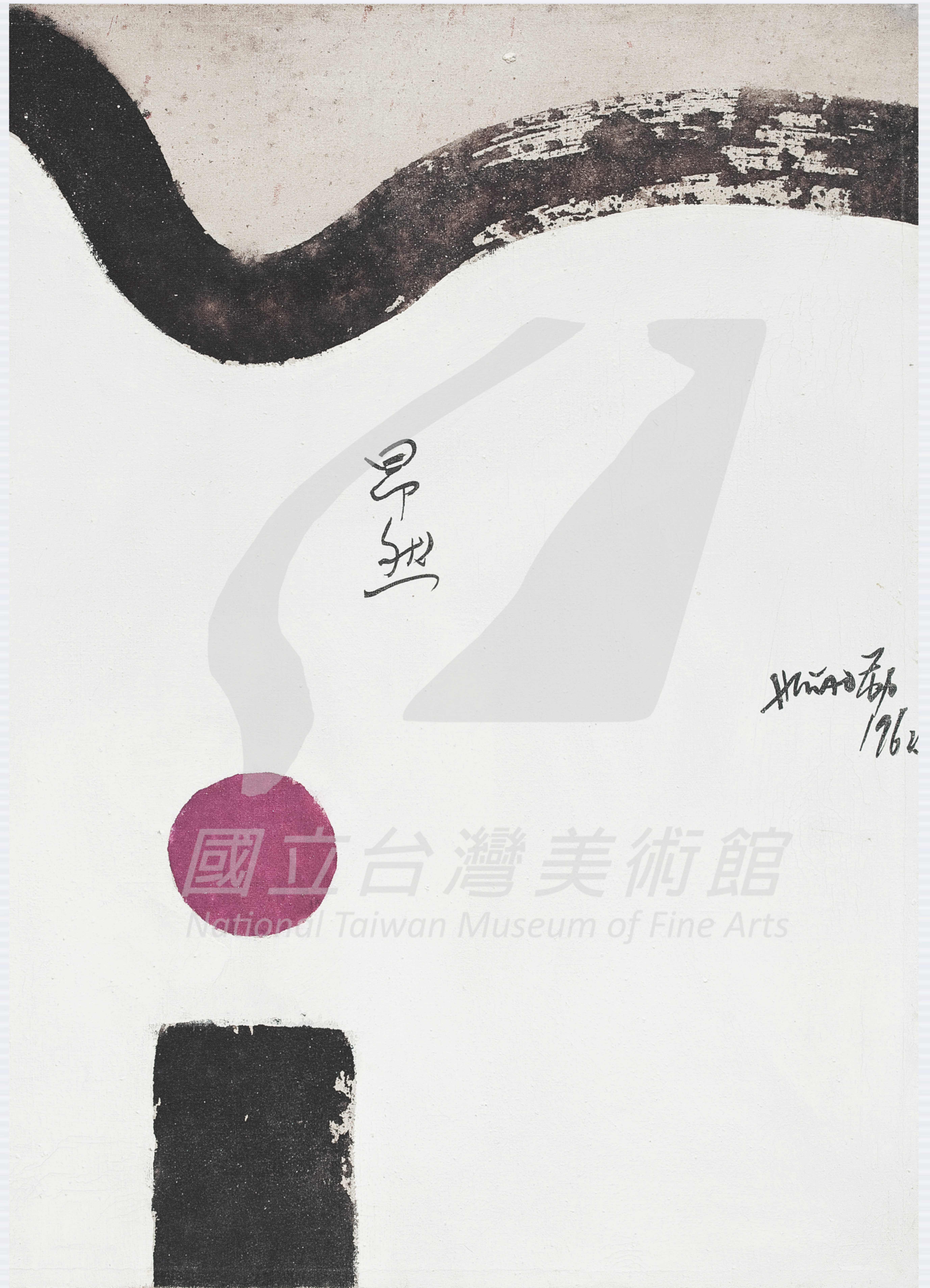
〔右頁圖〕 蕭勤 昂然（局部） 1962 彩墨、畫布 60×50cm