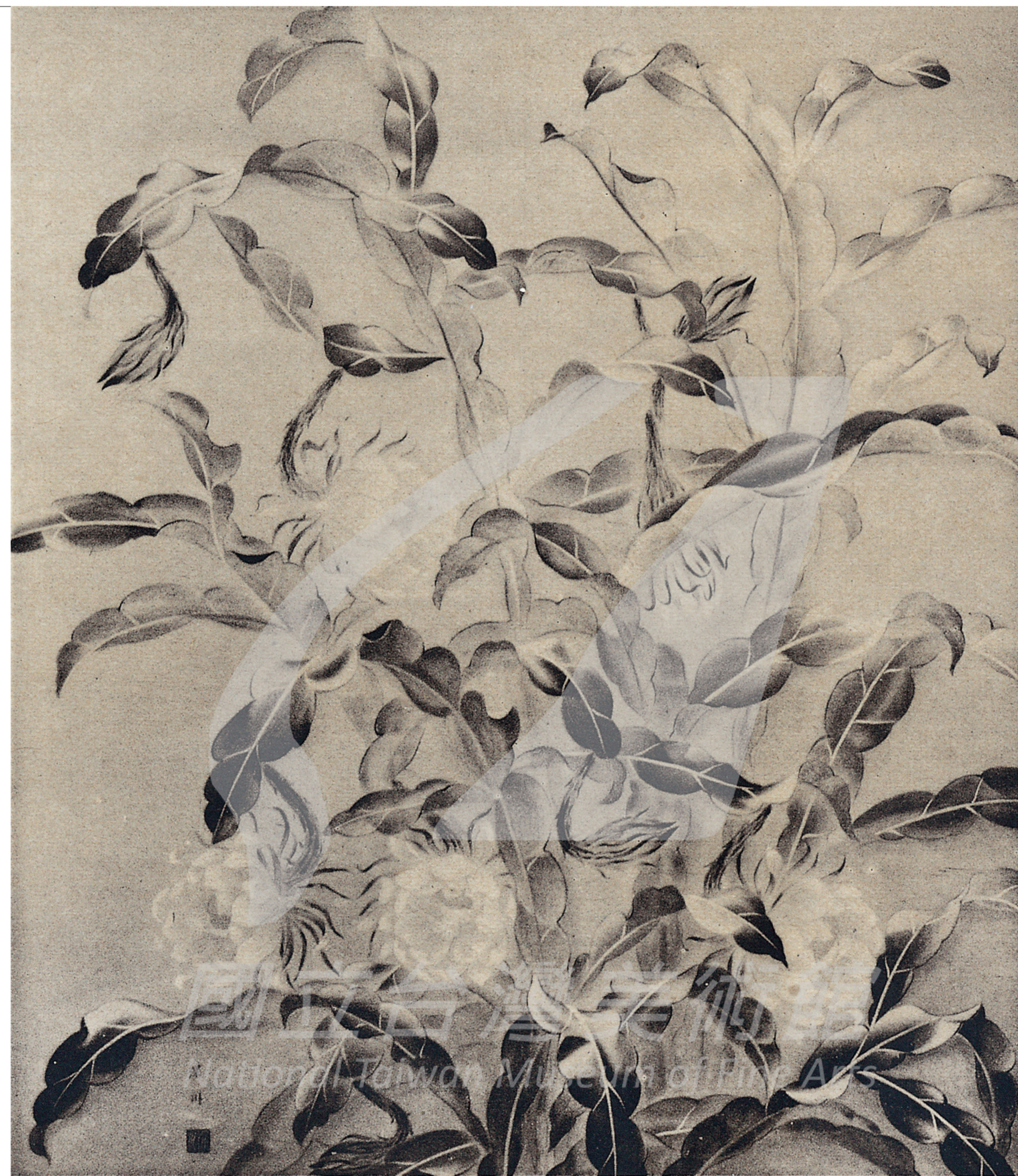
許深州第四屆府展入選作品 〈月夜〉