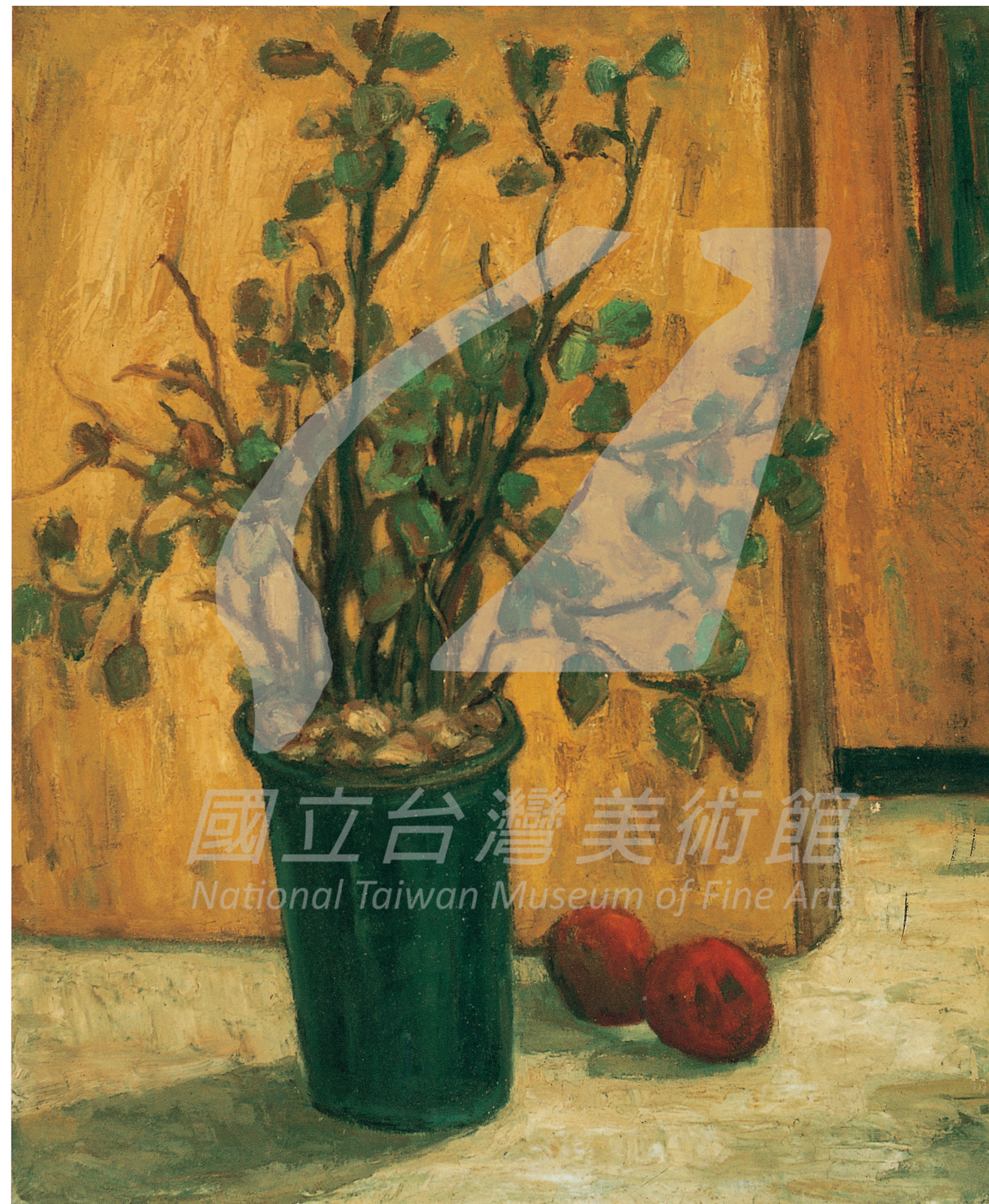
張啓華 靜物 1966 油彩、畫布 71×59cm 高雄市立美術館藏

至於沒有任何一幅畫作典藏的基金會，又具有什麼樣的價值和定位呢？張啓華生前以其堅定的信念，透過美術的創作來克服身心之痛，體現了藝術與生命教育的連結關係。2006年，許馨方繼任亡夫張柏壽的董事長乙職之後，亦將基金會的功能組織擴大為生命關懷與教育，並經由舉行多年「生命關懷」主題的繪本與動畫創作競賽，來喚起社會大眾認識這個議題；近年來更經常在執行長許禮安醫師的推動下，舉行「生死學」、「安寧療護」等推廣與志工培訓課程。