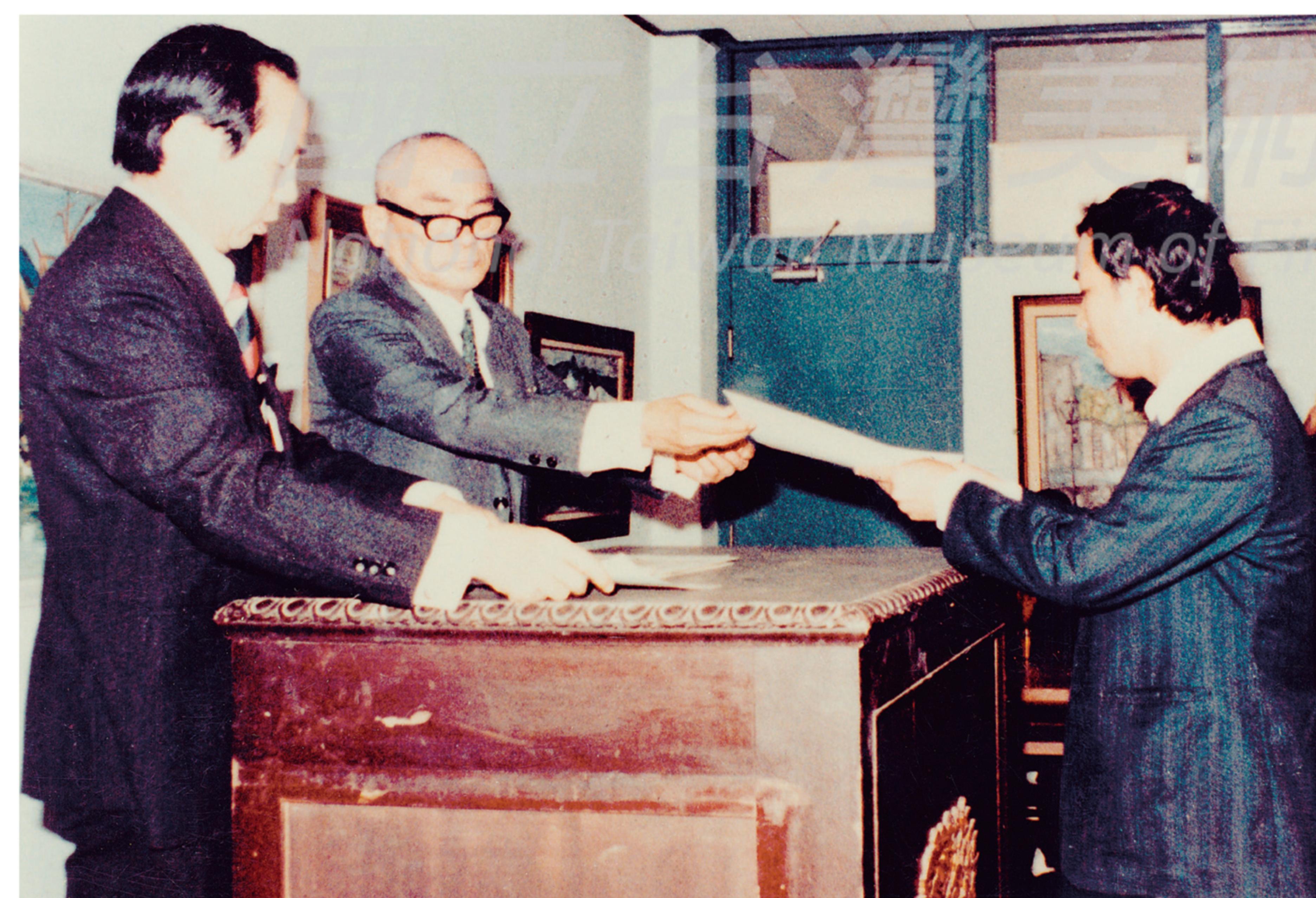
1978年第二十六周年南部展頒獎實況