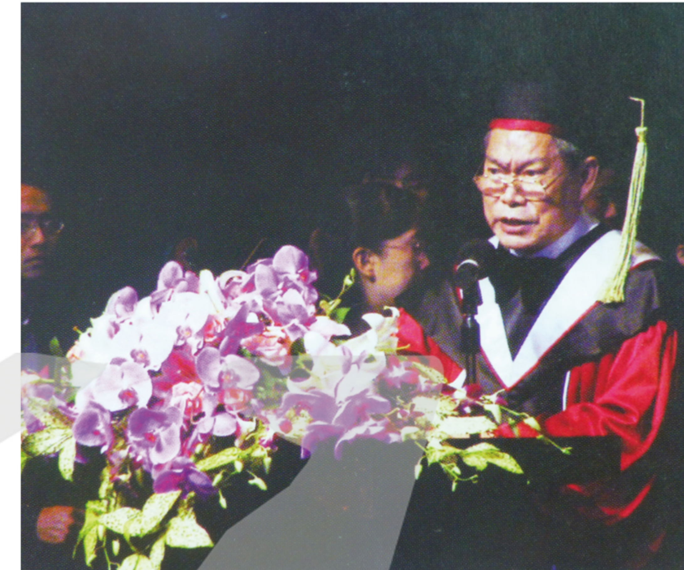
陳奇祿1996年任第一屆國家文化藝術基金會董事長