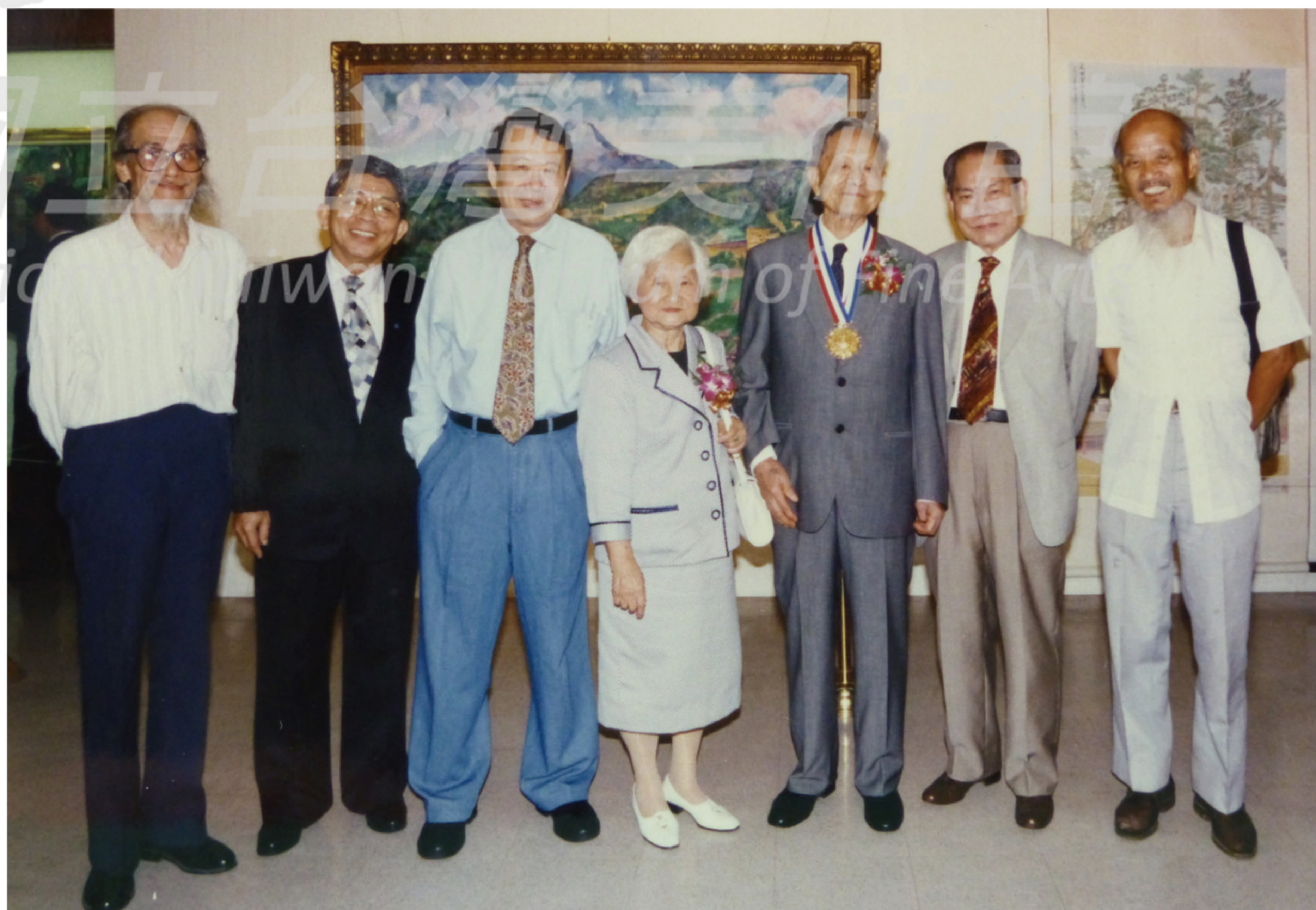
陳奇祿（右2）參觀陳慧坤（右3）畫展，與藝術界友人攝於會場。

文人才，鼓舞藝術創作風氣，與促進臺灣藝術文化環境的重視與關懷，一時間朝氣蓬勃，使臺灣藝文特色躋身國際，能見度大為提升。原因就在於他有跨領域的文化視野，以文化整體觀來擬定方案，因勢利導，故能水到渠成。