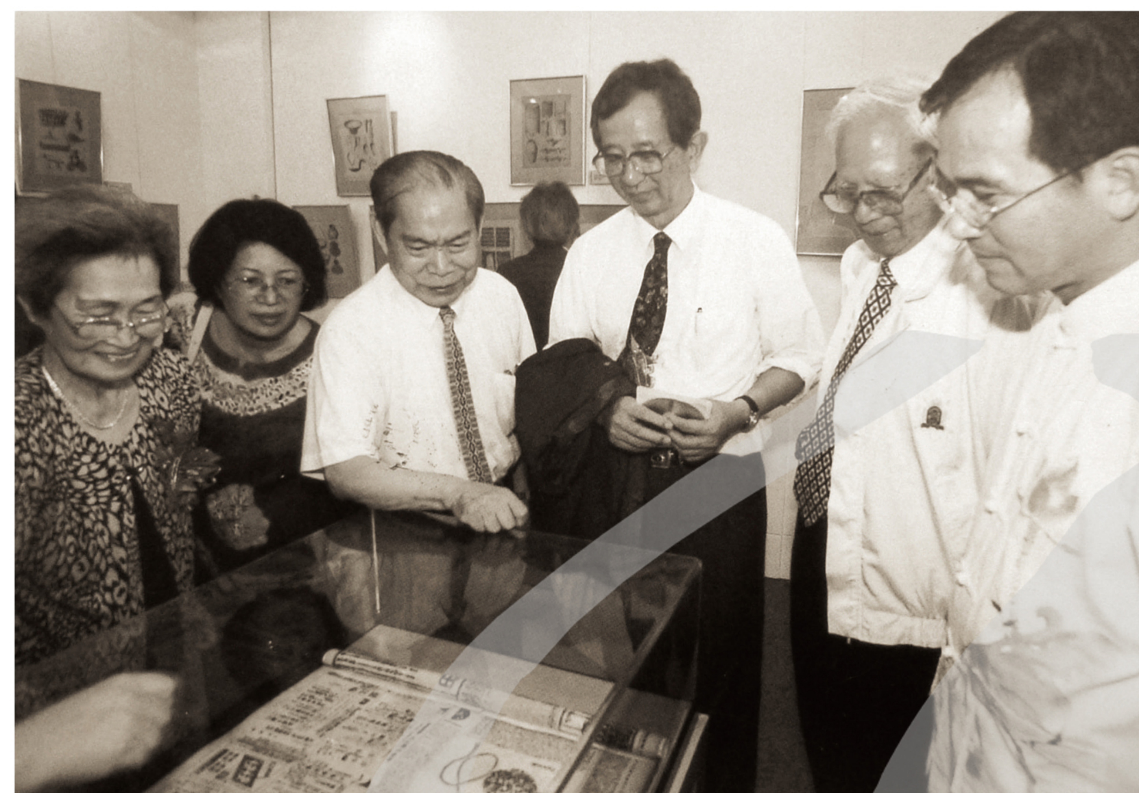
鹽分地帶文化館在2003年舉辦「陳奇祿院士特展」，陳奇祿院士(左3)陪同李遠哲(右3)、蘇煥智(右1)觀賞陳奇祿早年主編《公論報》〈臺灣風土〉專欄。

採借技藝的形式比較容易，改變意識形態卻很難，這牽涉到整個文化間的涵化問題。東方老莊思想數千年來主導著藝術創作方向，以水墨畫風格對應於道法自然與靜觀是最後的選擇；同樣的，實證主義、受科學思維影響很深的西方價值觀，最終選擇了油畫和立體雕塑的理性表現形式，其間似乎存在著明顯的因果關係。少數民族的藝術多所歧異，原因也是如此。藝術創作，可以說是哲學思想和價值觀的延伸與表現；藝術創作就是要探索未知的領域，帶領藝術向前發展；藝術創作是一種修為，知識和經驗是累積的，不可能在短短幾年內，去照搬某一流派或模仿原始而獲得成功。