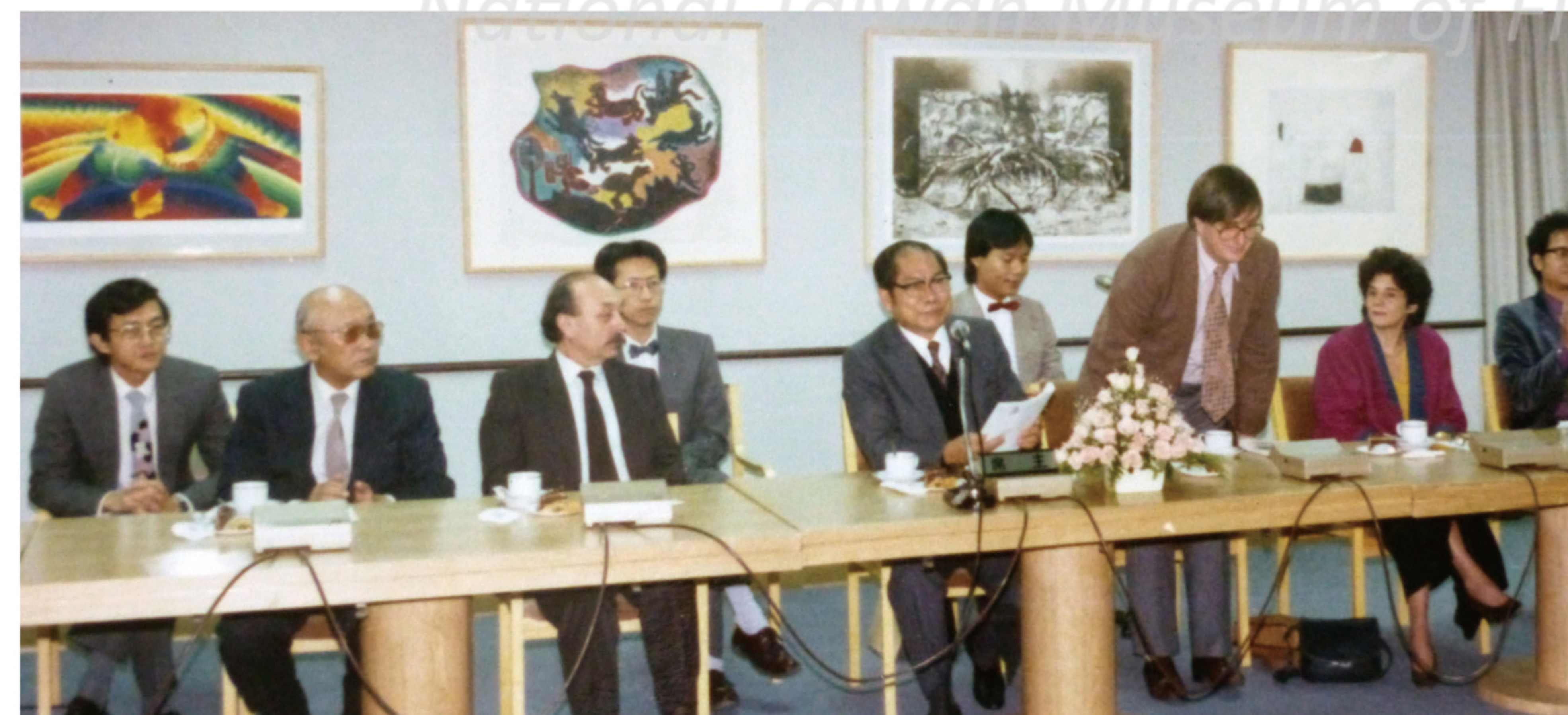
陳奇祿主持第二屆國際版畫雙年展評審會

藝術創作在反映文化和生活已無爭議。人類學家所謂的文化是生活的全部，包括人與人、人對自然和超自然的關係。陳奇祿相信藝術創作絕不是孤立的文化現象，而是密切關係到一個民族整個文化史或藝術史的一部分。文化差異的層面可分為技藝的、社會的和意識形態三方面；