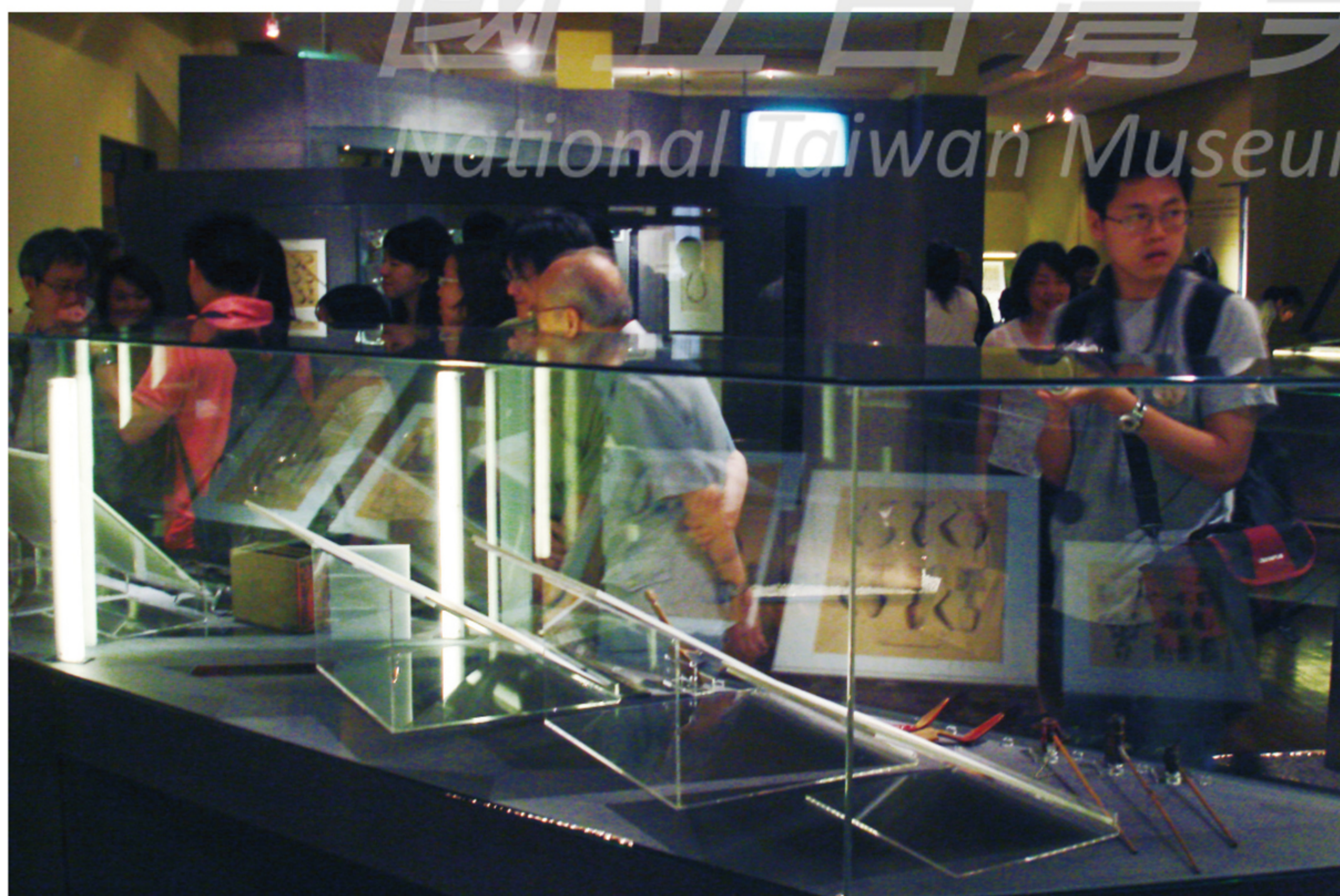
【右上圖】 陳奇祿親自主持「田野·器物·繪圖——陳奇祿先生原住民圖誌」展覽開幕時所攝。