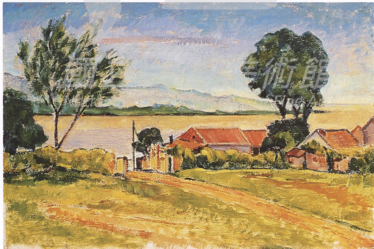
〔左頁上圖〕 林克恭 泊舟 1971 油彩、三夾板 38.1×45.7cm