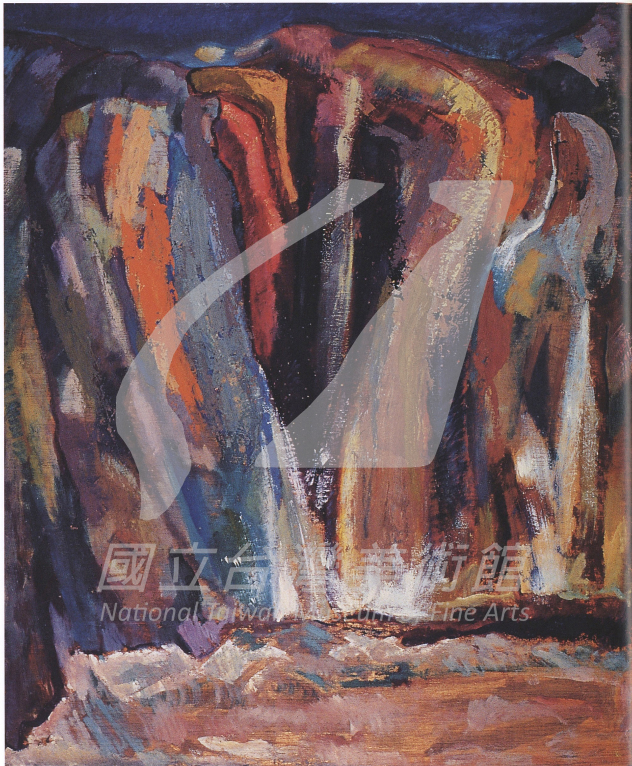
林克恭 圖像組合（五） 1970 油彩、畫布 61×50.8cm