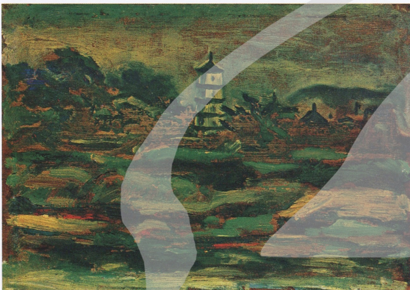
【下圖】 張萬傳 鼓浪嶼風景 1940 水彩、紙 23.5×31cm 呂雲麟舊藏