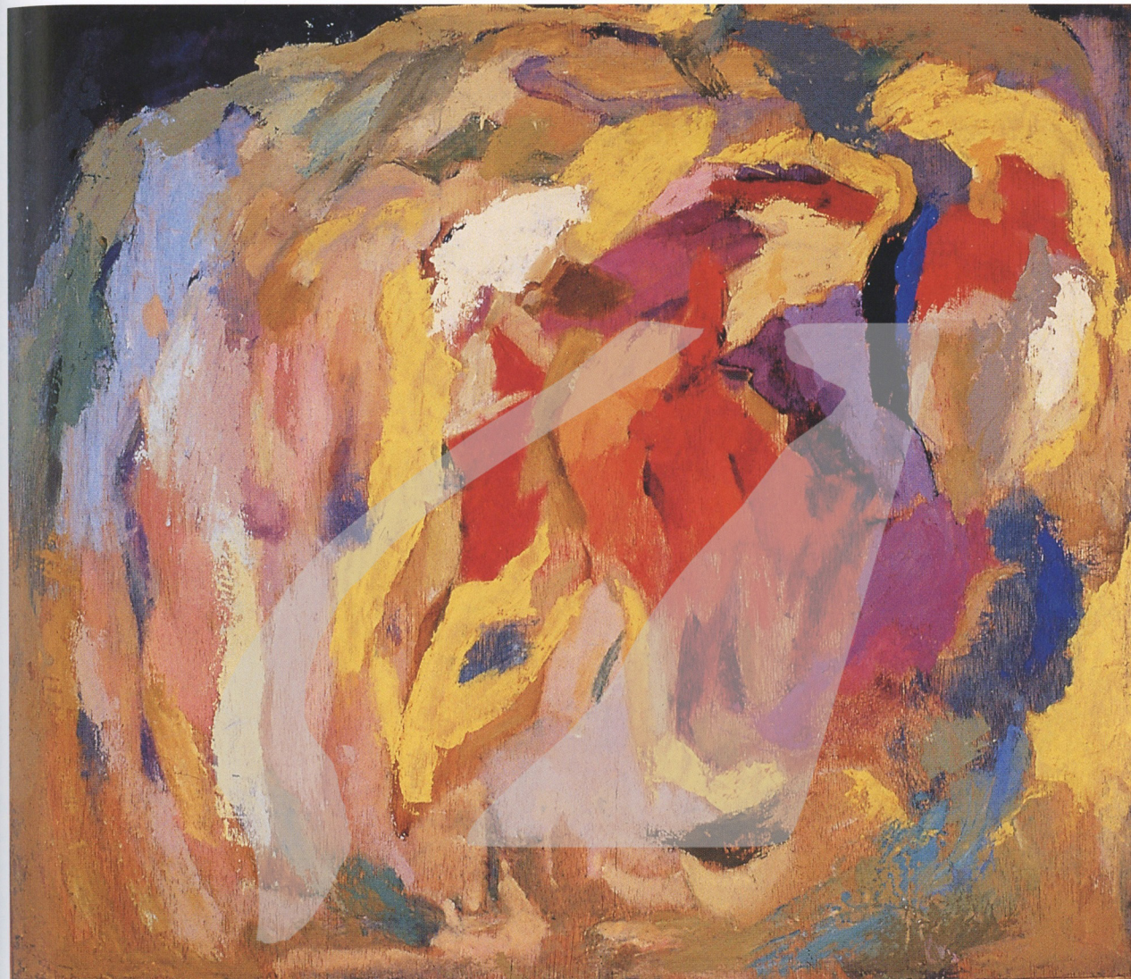
國立台灣美術館 National Taiwan Museum of Fine Arts 林克恭 圖像組合（六） 1971 油彩、畫布 50.8×61cm

「喜歡談抽象繪畫」，但又「反傳統」的「五月」、「東方」畫會的現代青年，他則告誡以「投機取巧，是有識之士所不為的」。至於從「台展」、「府展」崛起，戰後以「省展」及「台陽美展」為活動領域的台灣畫家，雖然在「全國美展」的審查會場亦會相見，但顯然戰後居台期間，他似乎較少與本土的前輩畫家有直接的互動。