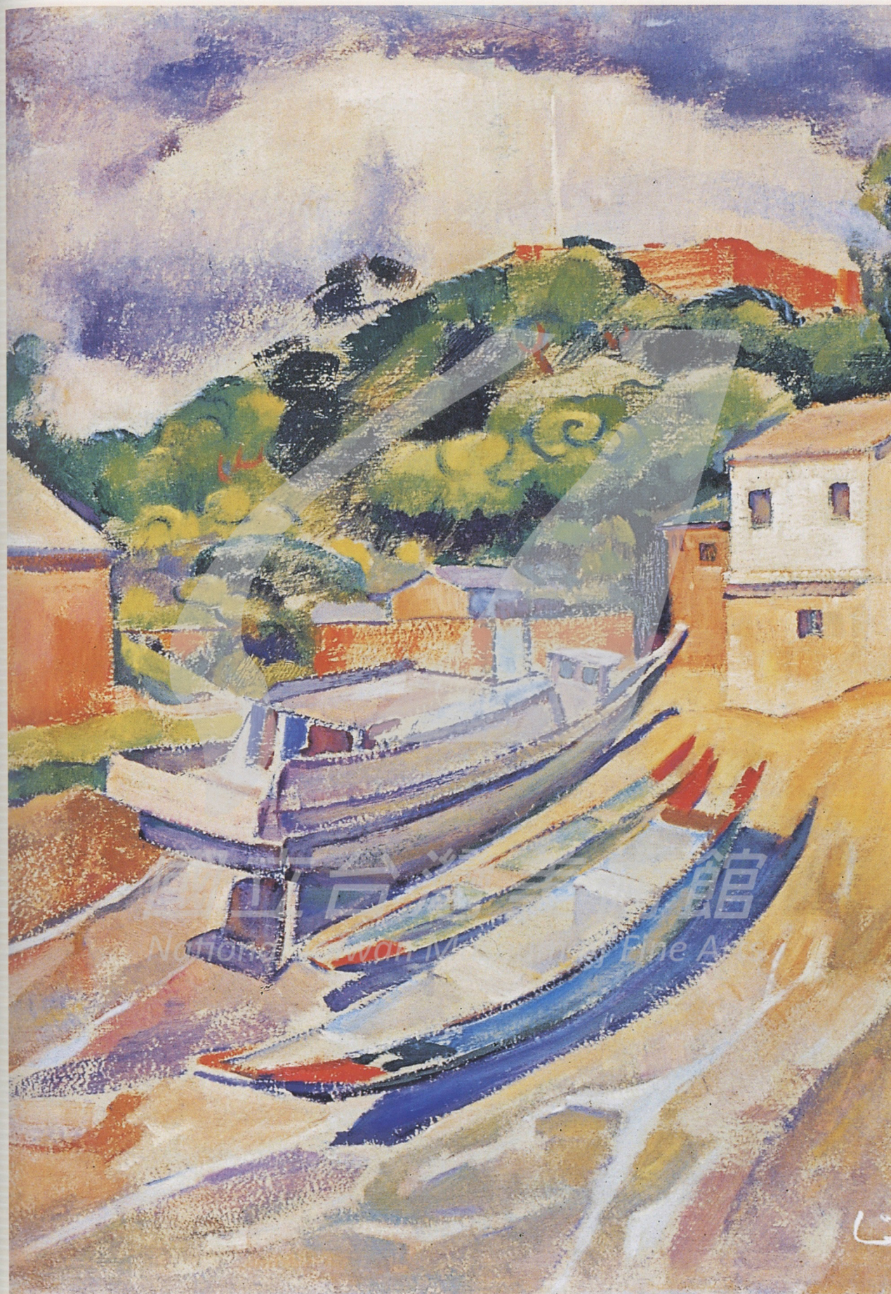
[右真圖] 林克恭 紅毛關（局部） 1972 油彩、畫布 53.3×45.7cm