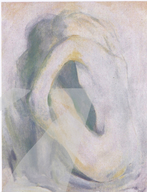
【右圖】林克恭 冥想 1977 油彩、三夾板 45.5×35.5cm

台灣政商名流聯名擔任畫展的發起人。就連台灣西洋畫壇的領袖人物，如「台展」的審查委員鹽月桃甫及藤島武二等人，也聯袂出席展覽會的開幕，並擔任個展發起人。然而他本身洗鍊的畫技，作品所富有的豐富色彩和氣韻，才是他征服當時台灣年輕一輩，如鄭世璠等人，心儀的主要因素。