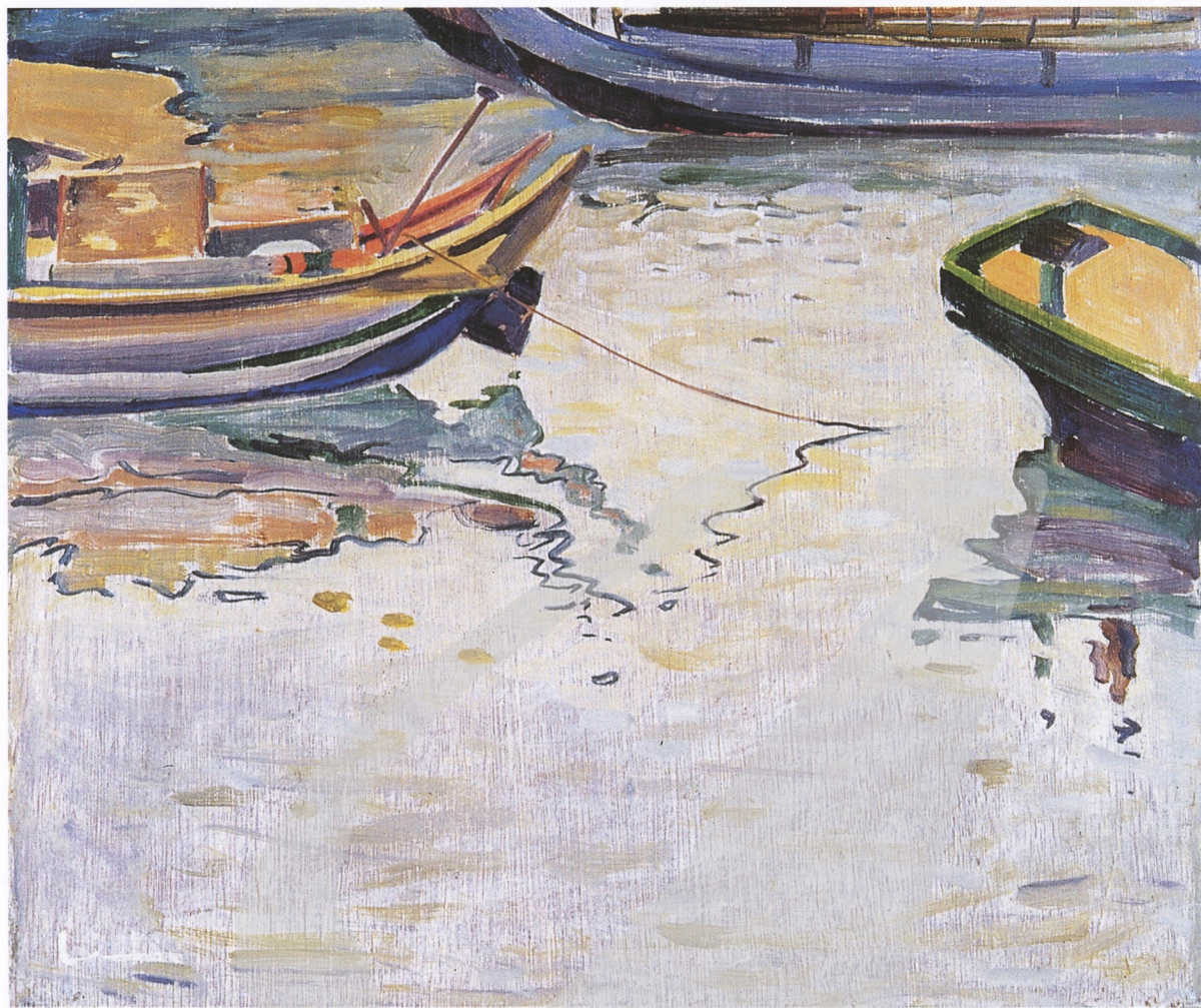
〔右上圖〕 林克恭 野渡無人舟自橫 1972 油彩、畫布 50.8×61cm