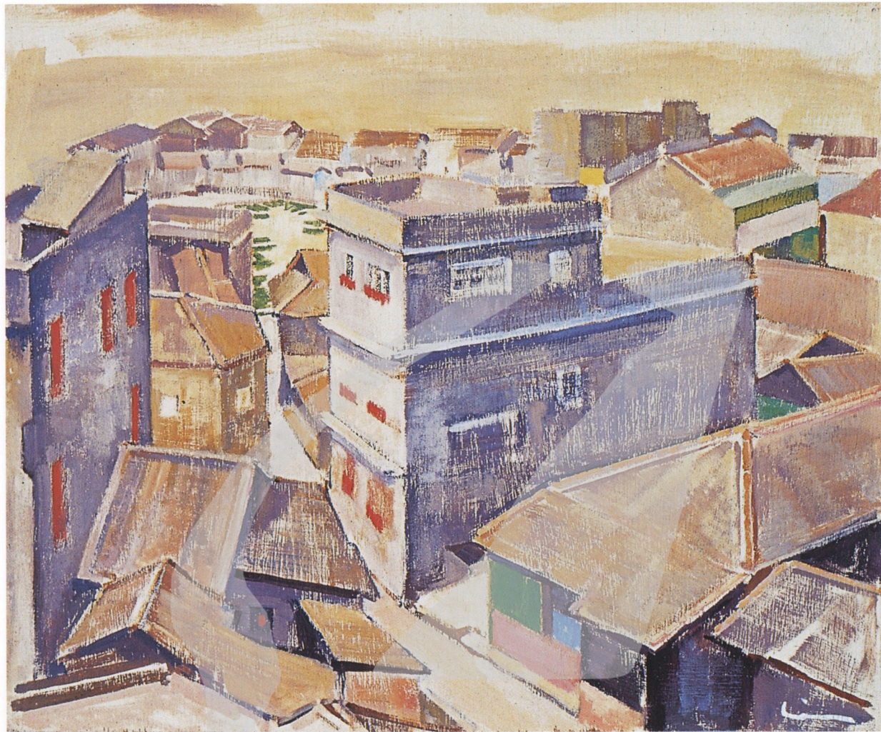
林克恭 基隆 1972 油彩、三夾板 38.1×45.7cm