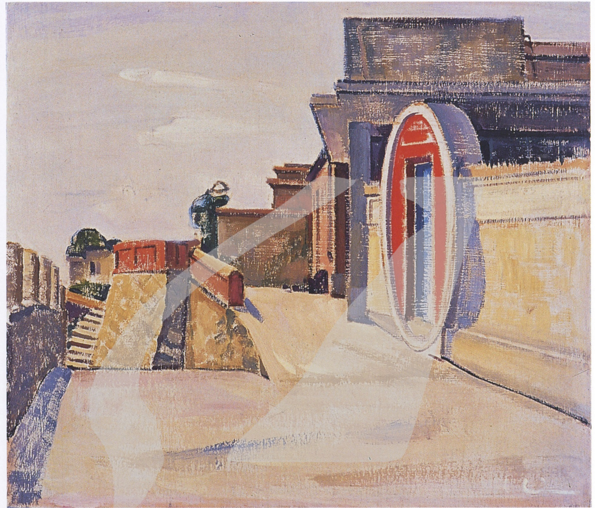
林克恭 月門 1972 油彩、畫布 38.1×45.7cm