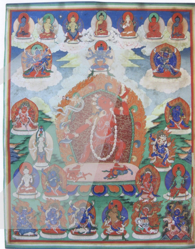
唐卡，空行母手持法器，周遭繪出諸佛菩薩及金剛，背景以石綠色清染大地。

結論是在今日繪畫領域中，工筆重彩，膠彩與唐卡，各擅勝場，由我國古代壁畫的需求下，使此類表達的技巧觀念或東渡宣揚於日、韓、或保存於宗教繪畫中，三者的價值，應以現時代的觀念重新予以肯定和認知。