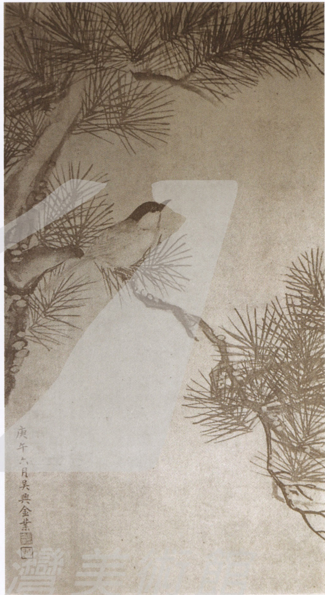
庚午六月吳興金業