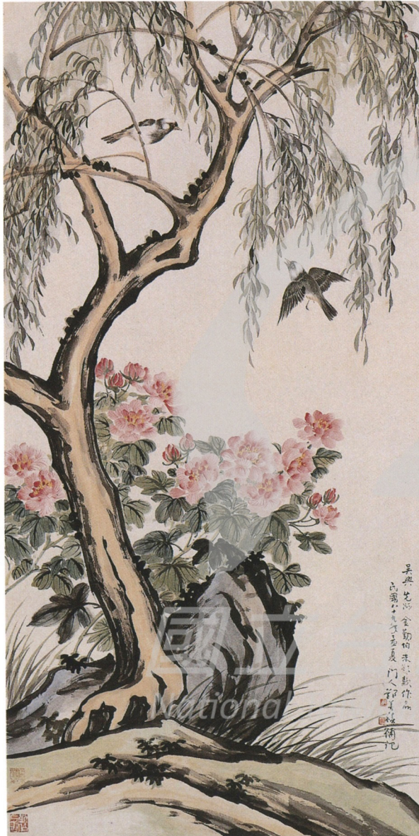
【左】金勤伯 春日雙禽 年代未詳 彩墨、紙 136×69.8cm

款識：花紅柳綠草長鳥飛翔 先師金勤伯教授 花鳥楊柳圖 學生鄭善禧敬題 吳興先師金勤伯未題款作品 民國八十九年孟夏門人鄭善禧補記 / 鄭印：翰墨緣、民國八十九年、鄭、善禧 / 金印：吳興金勤伯七十以後作、勤伯長壽