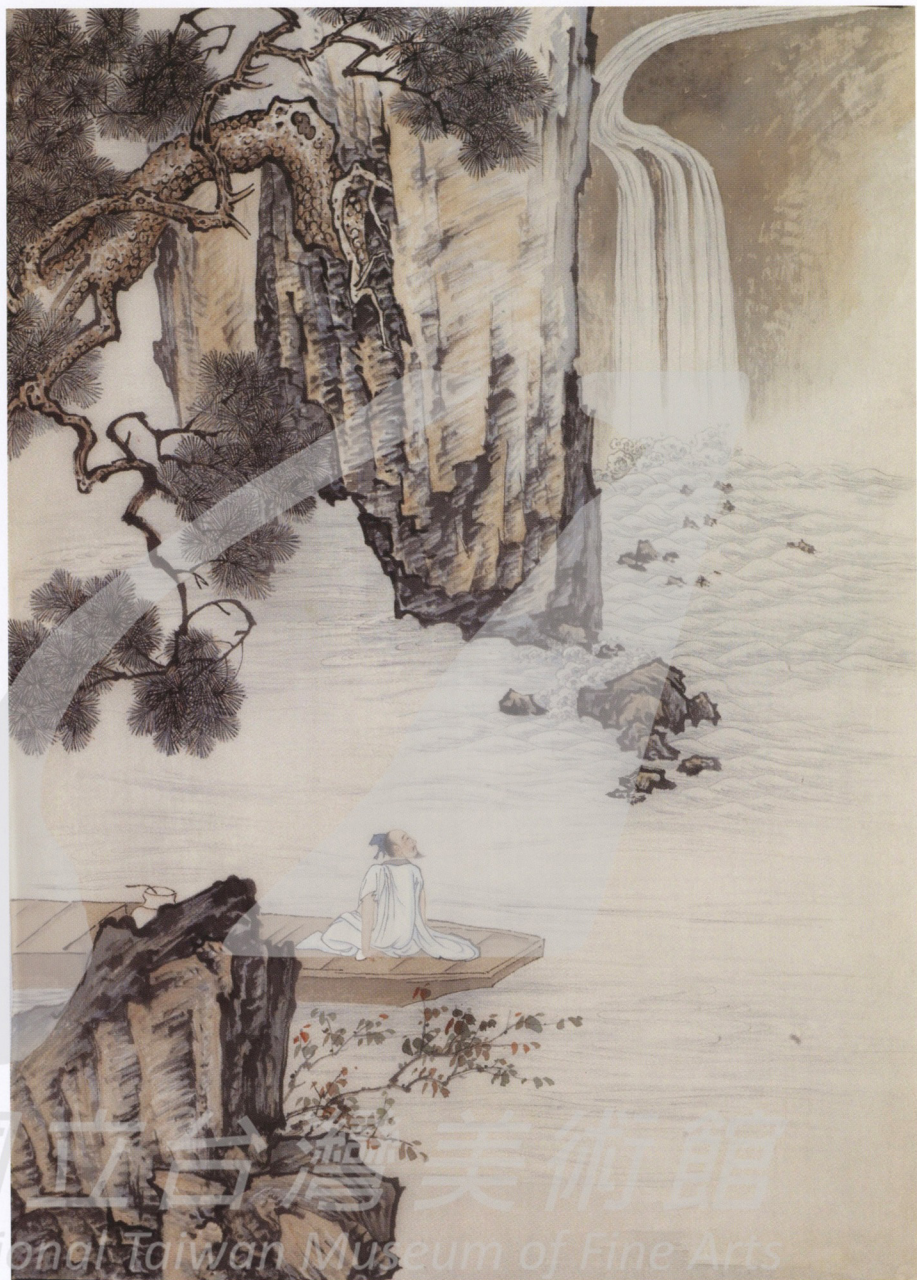
金勤伯 松下高士 (未落款) 年代未詳 彩墨、絹 75×54.5cm

際性展覽，積極參與上海的藝術結社。在自我的要求下，摹寫古代名作，以「畫學研究」為宗旨的畫會，不求酬勞地教育後人，為社會服務，應以事功的成就來肯定。金氏家族，以金城為人處事的態度為標的，貢獻自我，值得尊敬，被封為「廣大教主」，最後以辛勞致死，值得緬懷。