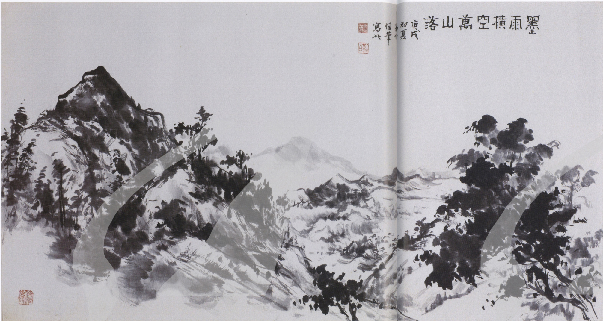
金勤伯 墨雨橫空萬山落 1970 水墨、紙 35.6×67.9cm 款識：庚戌初夏勤伯信筆寫此 鈐印：金業、勤伯、倚桐閣

像林玉山在師範大學教花鳥，並不講解膠彩畫。當時致力於膠彩畫與國畫如何調和的，反倒是研習西畫而教素描的陳慧坤，他的確為了對中國繪畫有所認知，閱讀了不少中國的畫論。大陸水墨畫風颯然興起，藝術學院首先將國畫名稱改為「水墨畫」，大陸本身也在「水墨畫」、「彩墨畫」之間不易協調，而創議汲取西方美學精要的「現代繪畫」，要求社會重新省視創作的方向與觀念。