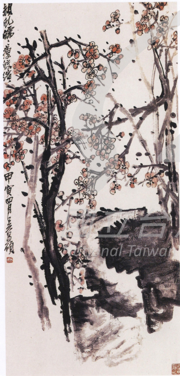
吳昌碩 梅花 1914 彩墨、紙 138.5×69.2cm

金城與吳昌碩至為友好是無疑的，他過世時金勤伯尚在北方，今日無法測知他抵上海後與吳昌碩晚年弟子中重要的王个移是否有交往，王个移在上海美專授寫意花卉。潘天壽在1921年前後入上海美專，為劉海粟聘為教席，便通過王个移向吳昌碩請教，與王震和黃賓虹等交往，並隨藝專的西遷至後方。所以抗戰時期，金勤伯花鳥中的點寫的表達方式，與他初期刊在《湖社月刊》的花鳥畫作品兩者相較，可看出他汲取創作營養的途徑。