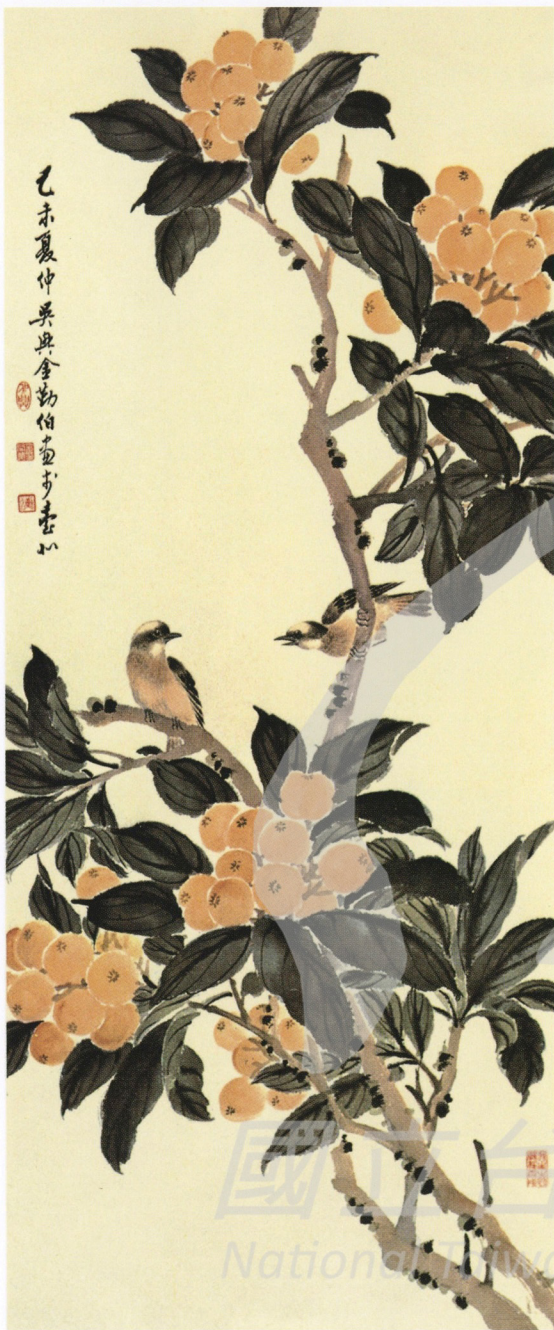
金勤伯 枇杷白頭 1979 彩墨、紙 93×40cm 第9屆全國美展參展作品 款識：己未夏仲吳興金勤伯畫於 台北 / 鈐印：吳興、金開業印、 勤伯

遍觀大陸花鳥名家，重沒骨者乏宋人骨氣，宋畫卻烘染更在勾勒之上，米芾畫史中固然推崇了「骨氣豐滿」的黃筌畫法，讚揚其筆墨豐厚的意趣，更推崇徐熙的寫實，徐熙後人稱他用絹或如布，絹質粗厚，傅色更屬不易，所以多次傳染後，色彩推起在絹上如凸起，這是作工筆畫要倚仗多次使用礬水固定色料的道理。