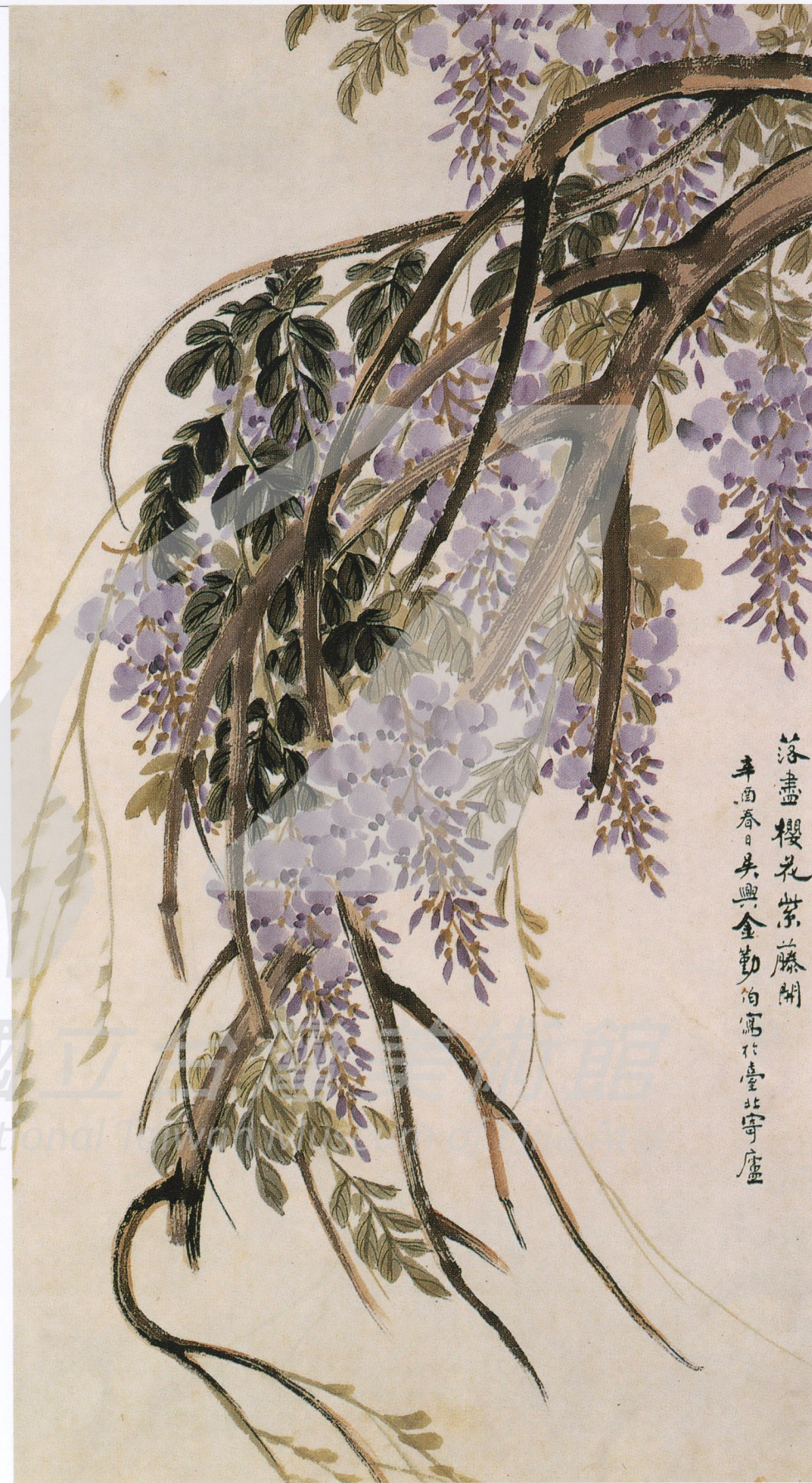
金勤伯 紫藤春色 1981 彩墨、紙 88.2×49.5cm 款識：落盡櫻花紫藤開 辛酉春日吳興金勤伯寫於 台北寄廬

台灣70年代以前，國畫的發展，面臨了「膠彩畫」、「水墨畫」和「現代繪畫」這三項創作觀的異同所產生的爭議。日治時代，第一屆台展尚有水墨繪畫，以後則非膠彩不能入選。迫使畫家轉而學習膠彩，產生了陳進、林玉山、郭雪湖、呂鐵夫諸位膠彩畫的大師。黃君璧接任師範學院藝術系主任後，台灣全省美展便發生了膠彩畫是否為國畫的看法。