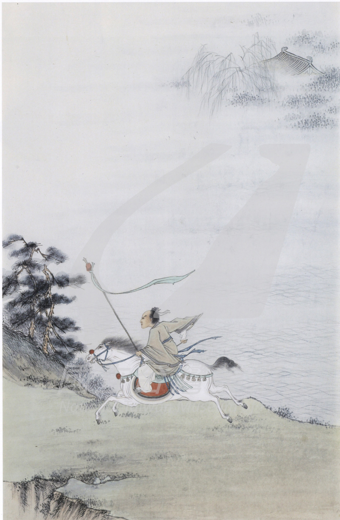
金勤伯 人物鞍馬畫稿（未落款，局部） 年代未詳 彩墨、紙 66.2×34cm

由各地的地方官員推薦畫人來京，雍正為人嚴肅，要求極高，除由畫院畫家中選擇高手外，稍不如意即遭斥逐，故雍正朝之瑠璃彩畫，其成就即至乾隆朝之精工，論高妙雅逸，無法企及。而所畫內容以花卉為主，較早的蔣廷錫與略晚的鄒一桂，均將沒骨寫生的花卉技法揚名後代，這是有清一代花鳥繪畫發展的大致趨勢。