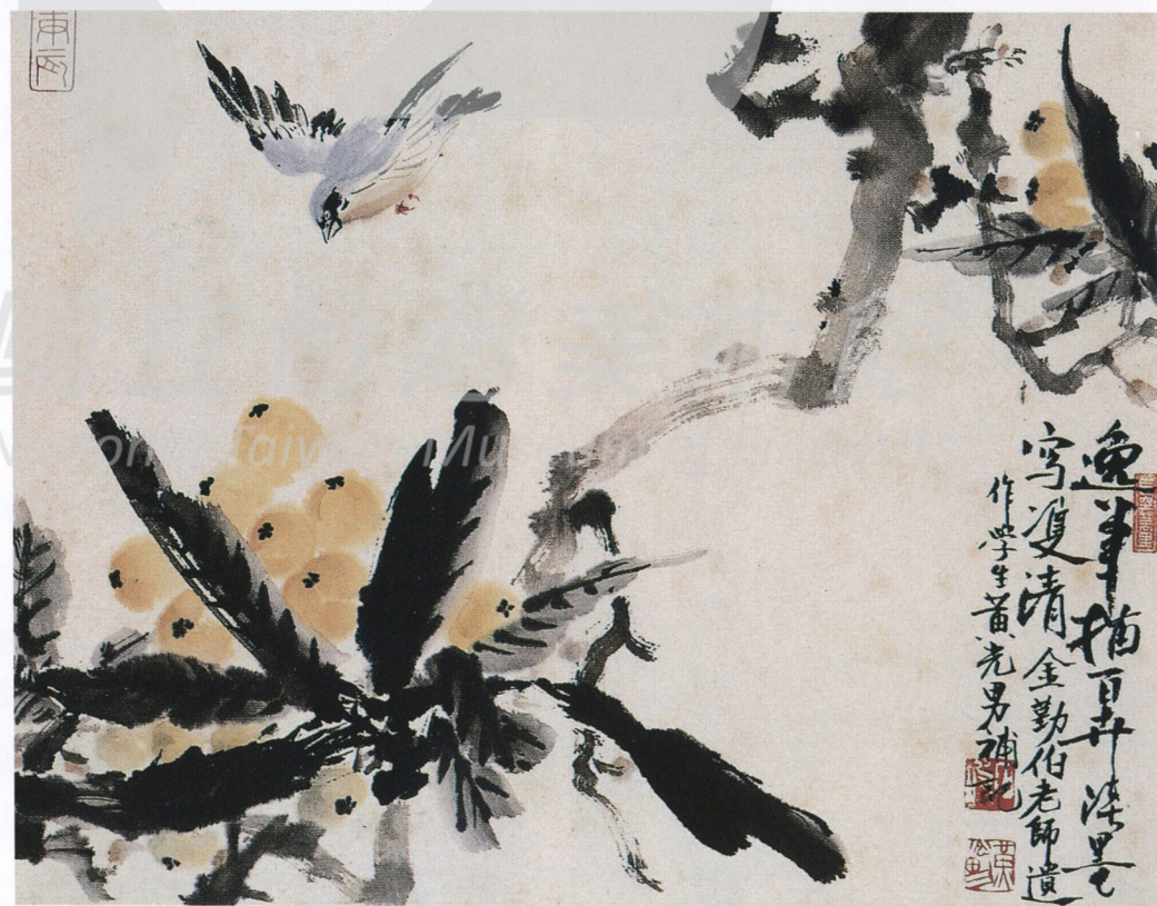
金勤伯 枇杷飛雀 年代未詳 彩墨 34.1×45cm 黃光男題款 / 款識：逸筆描百卉 淡墨寫雙清 金勤伯老師遺作學生黃光男補記 黃印：長空萬里、石坡、黃光男、庚辰