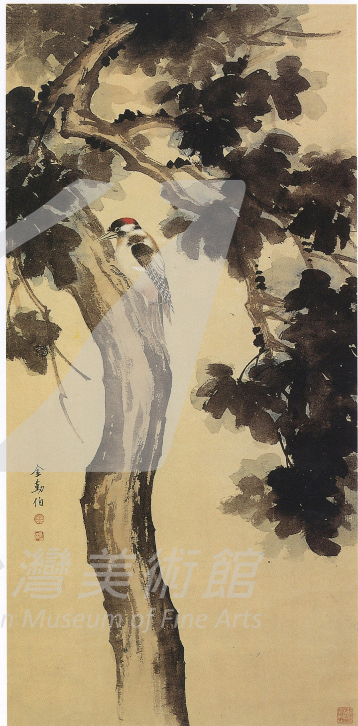
金勤伯 鳥棲梧桐 年代未詳 翎毛花卉 120×60cm 國立歷史博物館藏 款識：金勤伯 鈐印：金、勤伯

惲壽平之成名，即在格調逸易，明麗中自有書卷氣，金勤伯作品中，使勾勒與沒骨點染的技法相互滲用，點葉時色與墨的濃淡鋪陳，再以赭紅和墨綠勾出葉脈，較諸過分重視勾金勒脈或「骨法」強勁者，逸趣自是不同。