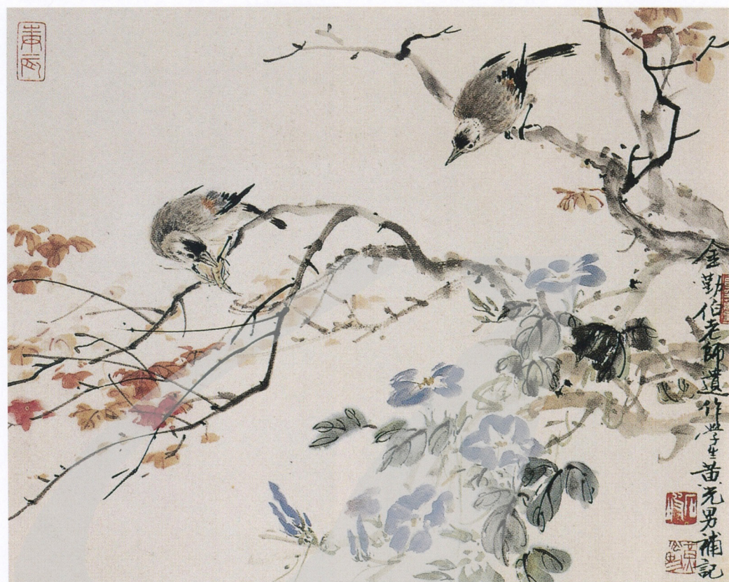
金勤伯 寫意花鳥 年代未詳 彩墨 34.2×45.2cm 黃光男題款 / 款識：金勤伯老師遺作學生黃光男補記 黃印：長空萬里、石坡、黃光男、庚辰