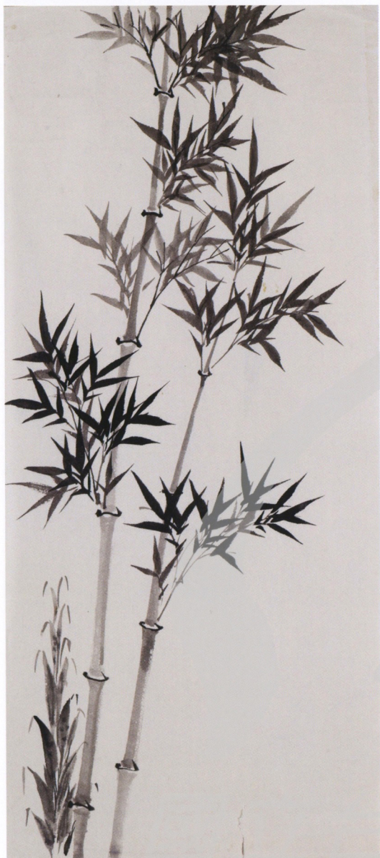
〔左圖〕 金勤伯 墨竹畫稿（未落款） 年代未詳 水墨、紙 67.5×29.7cm