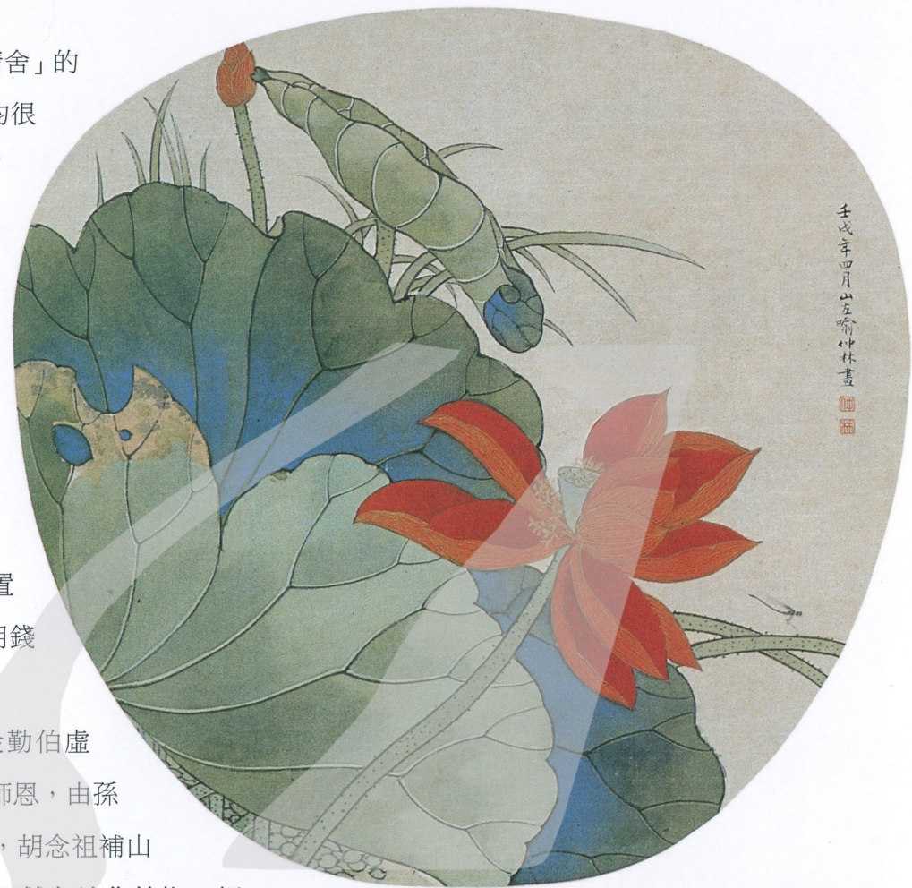
〔上圖〕 喻仲林 荷塘清趣 1982 彩墨 〔下圖〕 張大千攝於摩耶精舍畫室（藝術家出版社資料庫提供）