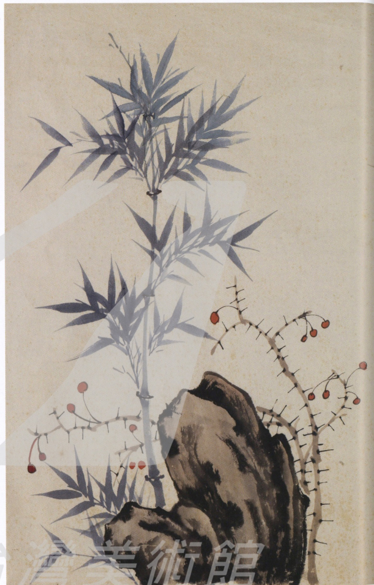
金勤伯 花石圖（未落款） 年代未詳 彩墨、紙 68.3×39.5cm