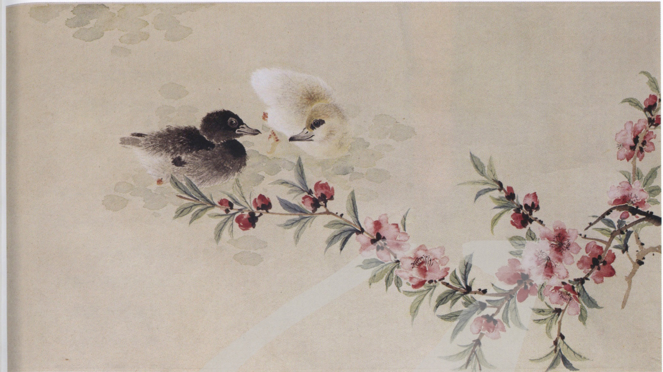
金勤伯 春江水暖（未落款） 年代未詳 彩墨、紙 30.2×56cm

金老師二話不說，轉身從櫃中拿出一卷近四十幅畫稿，數都未數就交給了我，由這個例子，可以看出金勤伯為人的慈愛，不只是誨人不