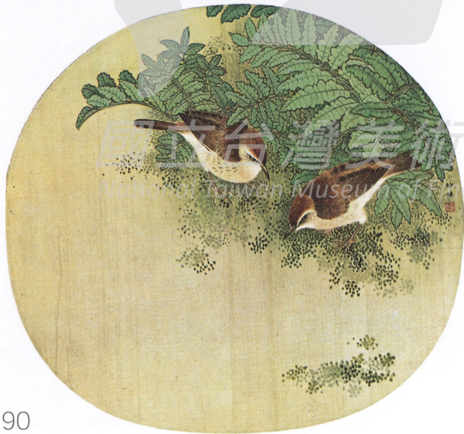
〔上圖〕 孫家勤 林禽雙雀 1998 彩墨工筆 83×46cm 畫於麗水精舍 〔左圖〕 喻仲林 綠蔭雙禽 年代未詳 彩墨、絹