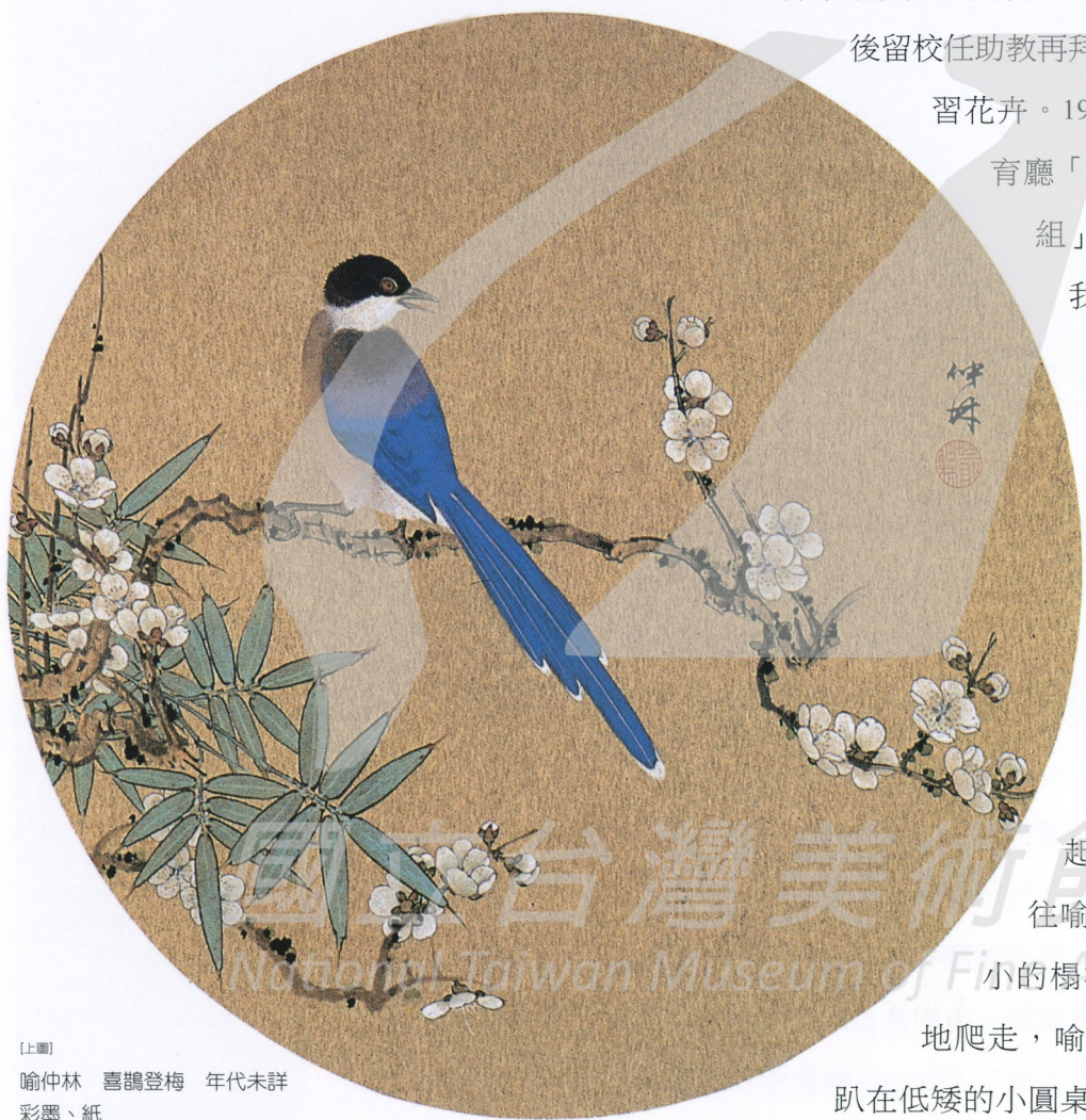
〔上圖〕 喻仲林 喜鵲登梅 年代未詳 彩墨、紙