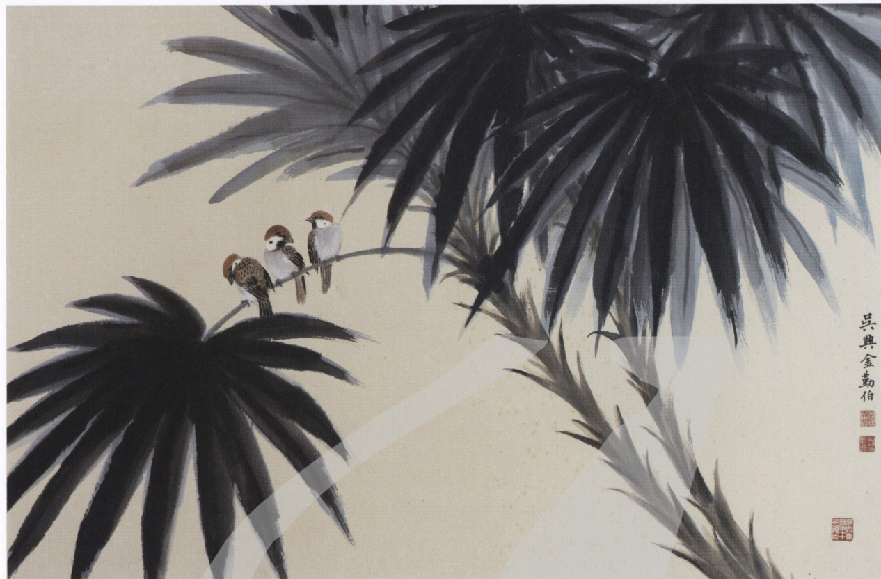
金勤伯 麻雀 年代未詳 水墨、紙 64×98.5cm (金弘權提供) 鈐印：金開業印、勤伯長壽、 吳興金勤伯七十以後作

滿足的。金勤伯家中的管家孔媽媽，從大陸跟來，燒得一手好菜，過年過節時，金勤伯常邀學生前往家中打牙祭。金太和回憶說：「我記得當我還在師大附中上學的時候，我們家總是成為假期不能回家的藝術系學生聚集的地方，……到如今還有不少師兄師姐們會對我形容我們家的水餃、火鍋和烤火雞的滋味。」當時從上海來台而環境不錯的人家，均重視餐飲之樂，這些盛饌，對隻身在台的貧苦學生而言，真是望之不可及的渴望。