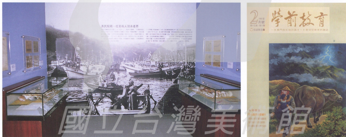
【上圖】 高雄市立美術館開幕展介紹莊索