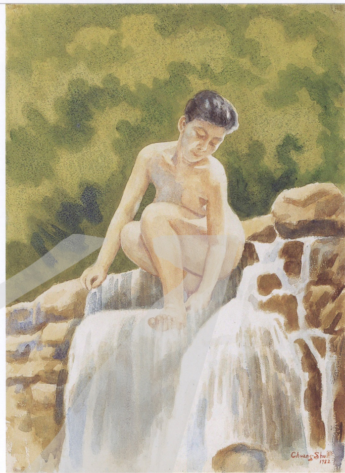
莊索 滌 1982 水彩、紙 75.5×56.5cm

年（1989）正式出版，雖說正式出版，其實沒有出版社發行，都是自費、獨立作業，也未販售。畫集內文首頁個人照片下方題詞：「重憶少年夢，幾度夕陽紅。」應是他讀明代楊慎〈臨江仙〉詞的「青山依舊在，幾度夕陽紅。」對照自己一生際遇有感而發。畫歷則比上述專輯多了「第一屆紐約世界台灣人美展」、「民國七十四年美術大展」、「人體繪畫邀請展」字樣，大有江山復出之勢，看不出自己的身體正每況愈下。莊索在畫集內，將自己的畫分類為抗戰回憶、漁村、農村、人體等四個單元，也成為後來高雄美術館辦回顧展的依據。