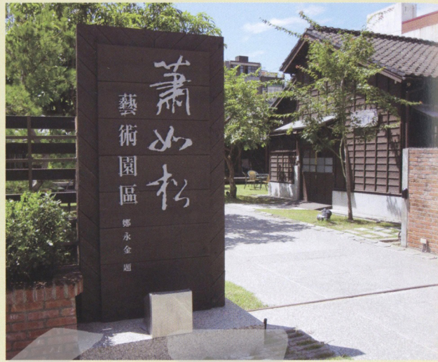
位於新竹縣竹東鎮榮樂街68巷1號的「蕭如松藝術園區」正門入口景色（王庭玟攝）