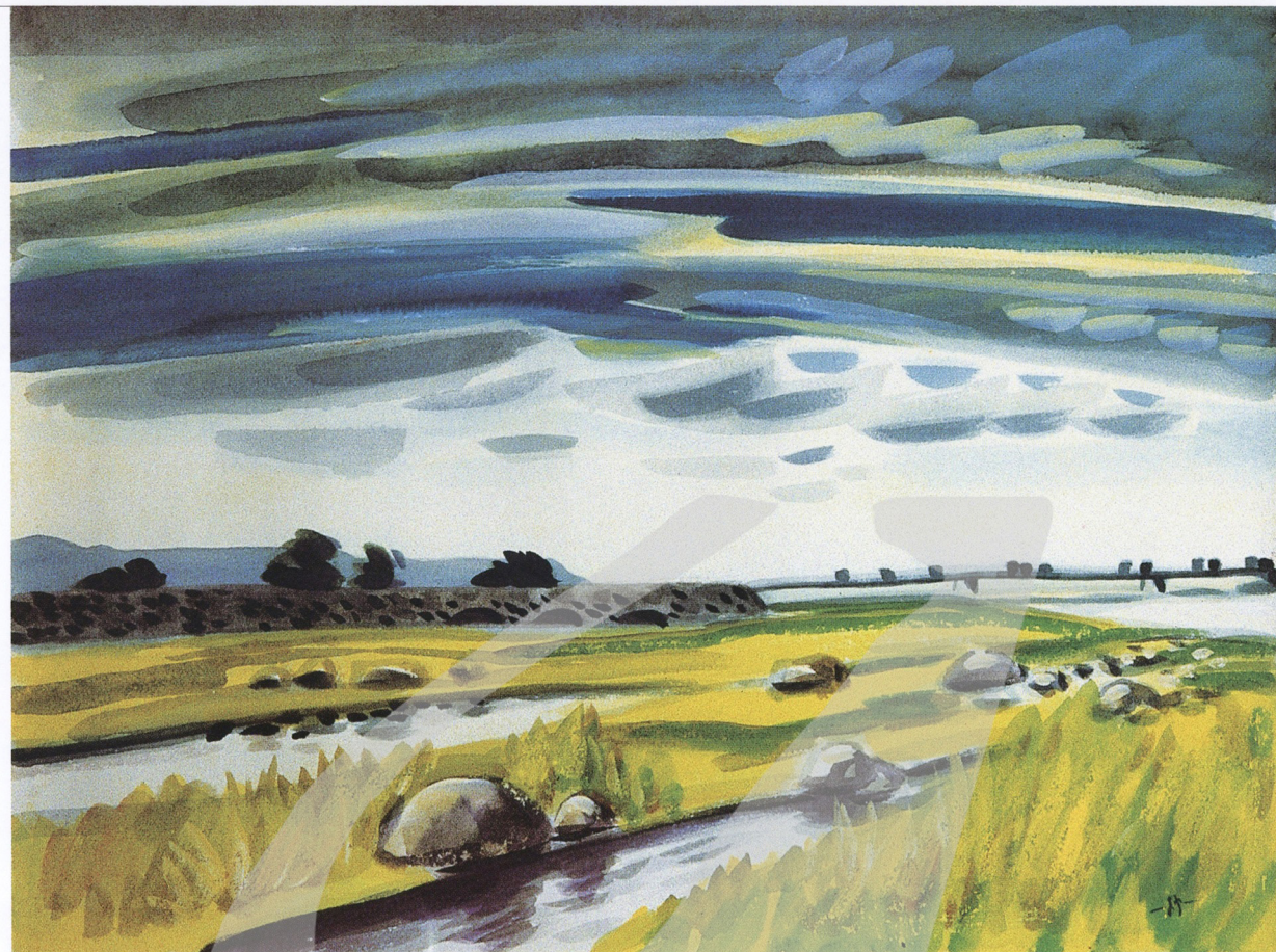
蕭如松 頭前溪風光 年代未詳 水彩、紙

但他知道要完成真正優秀的畫，實在是一件非常艱辛的工作。無論生活多麼艱困，環境多麼惡劣，他從未離開這塊土地。這幾十年來，他筭路藍縷，以真誠奉獻的藝術情感經營這塊鄉土，堅守這份對故鄉的