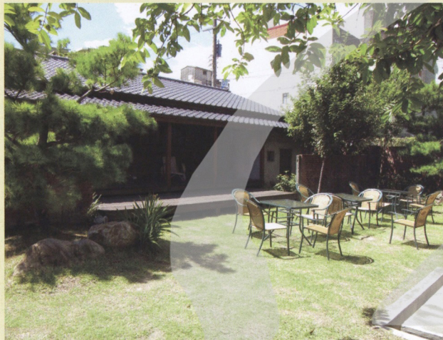
「蕭如松藝術園區」景色