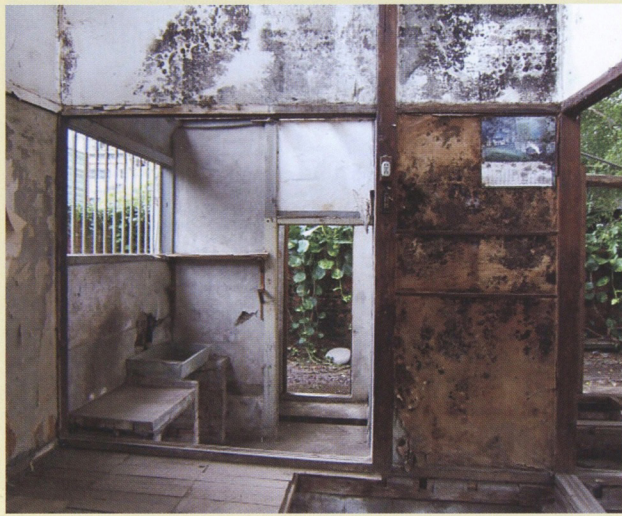
蕭如松故居數十年間置，2004年決議成立籌備委員會還原「蕭如松故居」的原貌。（此為故居改建前之情景）