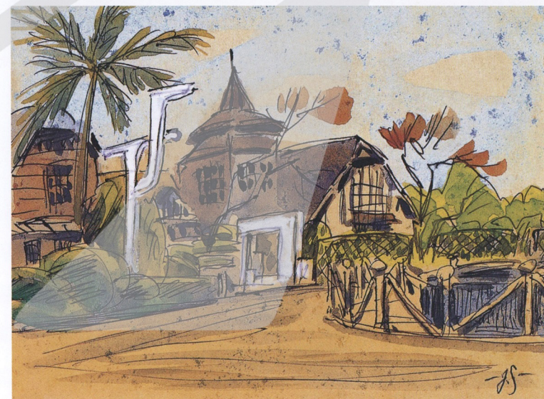
上圖 蕭如松 風景 1969 鉛筆、水彩、紙 14.1×20.3cm 私人收藏 下圖 蕭如松 台中公園 1963 簽字筆、水彩、紙 10.5×14cm 私人收藏