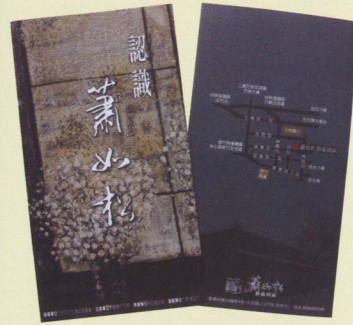
「蕭如松藝術園區」簡介