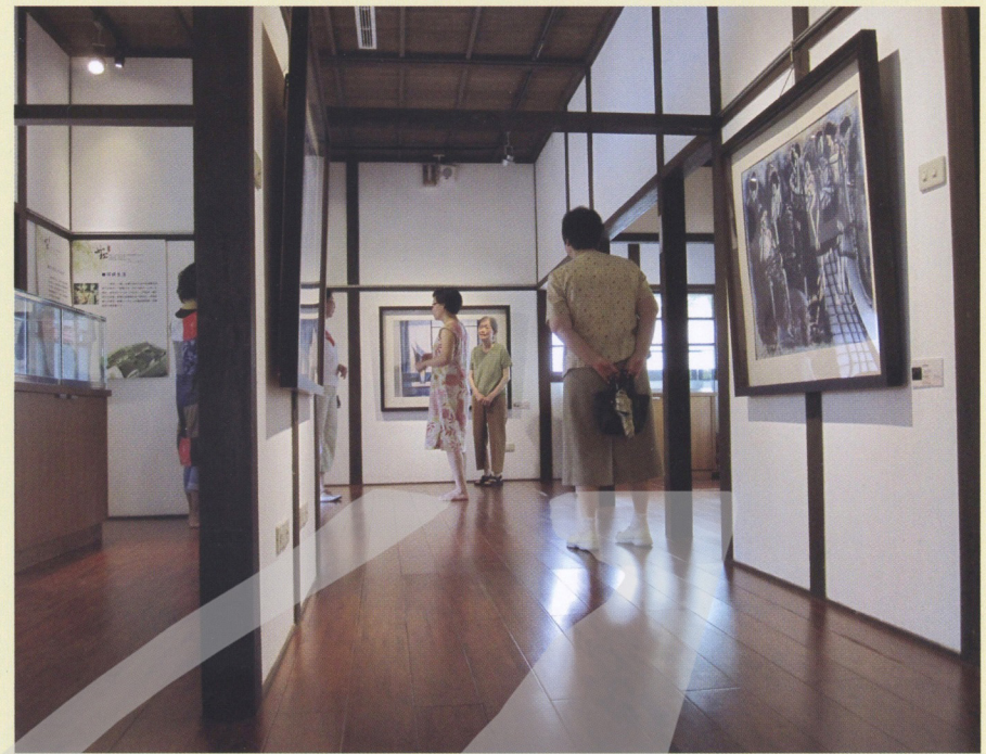
「蕭如松藝術園區」展場空間