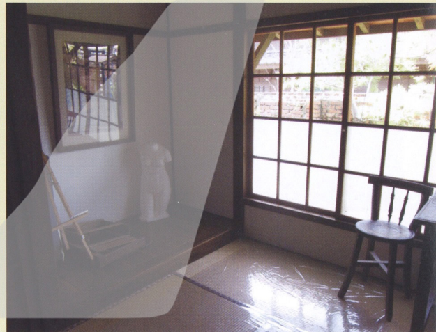
蕭如松故居內部