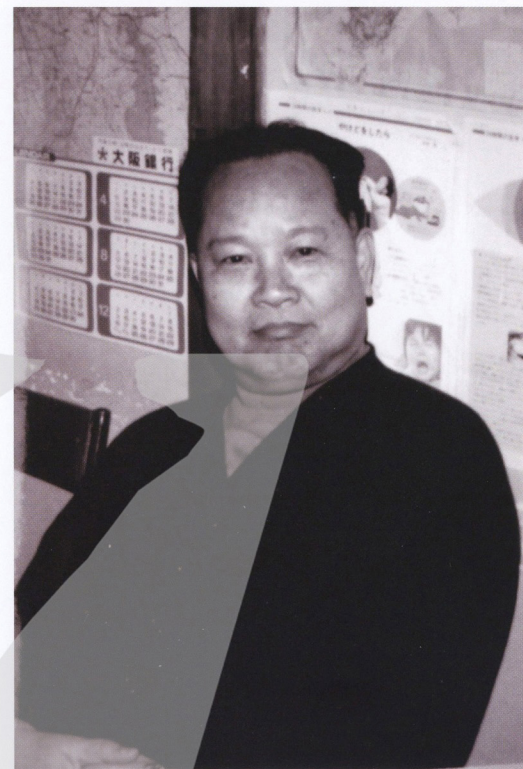
蕭如松的大哥蕭雲嶽曾被譽為台灣第一等生，他不僅是蕭家孩子們學習的模範，也是日治時期叱吒風雲的軍官與外科醫生。