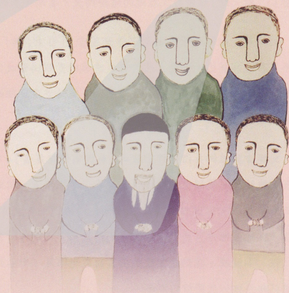
[吳李玉哥 繪家人畫像系列(局部)]