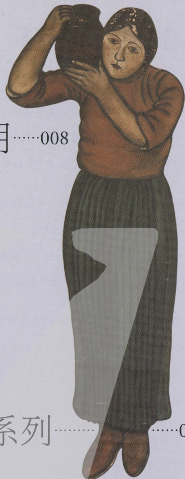
【劉錦堂 | 灌溉情苗圖(局部)】