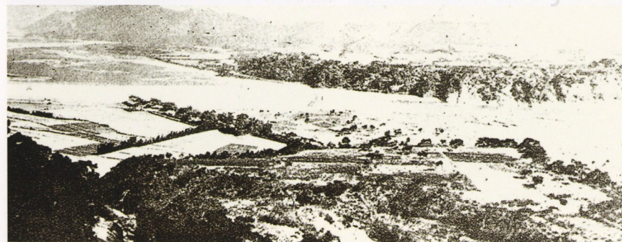
大正時代的大漢溪與大溪公園

茶外，小的如鐵釘，大的如碗盤陶瓷都有。這店也賣煙酒，常有鄉下來的莊稼人自店門口的大酒甕沽了酒後，便到店裡的長椅條上與熟人聊天喝酒，或者買一節剖削好的鮮甜甘蔗吃嚼起來。