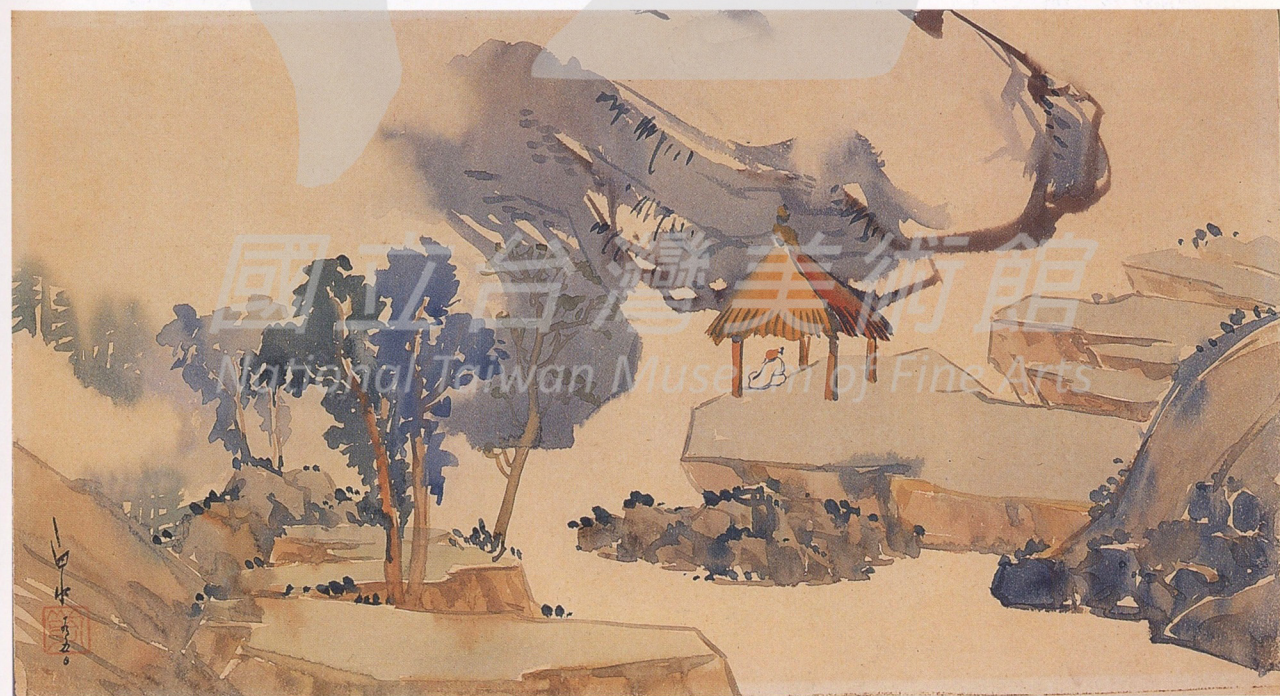
馬白水 仿沈周（三） 1950