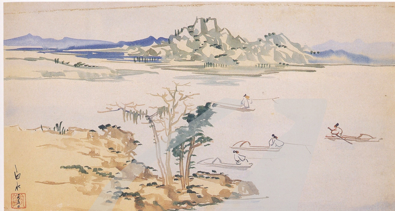
馬白水 仿沈周（一） 1950

馬白水的藝術養成，在遼寧師專畢業後，全靠自學苦練。除了水彩之外，他也曾學畫國畫和油畫。他曾說自己對中國水墨和西洋油畫，下過十餘年的工夫。一九五〇年，當他得知同在師範大學教書的水墨畫家黃君璧，珍藏有沈周山水冊頁八幅，他立刻請求出借。然而古畫珍稀，只能出借一日，馬白水當天雖然身體不適，但為了珍惜這難得一次親炙五百年真跡的機會，他忍著頭痛，以水彩及厚白報紙抱病臨摹。