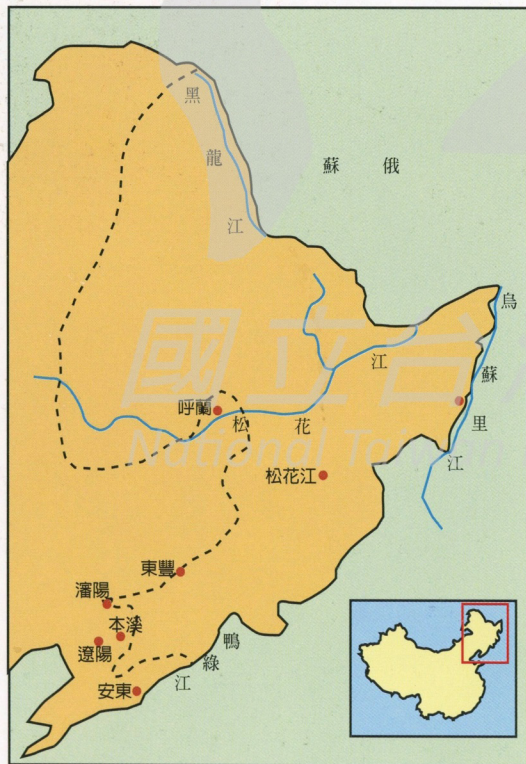
遼寧省本溪縣位置示意圖

● 學院中的學生，可以依照個人性向，選修自己喜愛的學科。在這種新教育制度下，馬白水憑藉著個人的努力，不但提前讀完附小，而且在十六歲那年（一九二四年）順利考入奉天學院，全力攻讀史地、國文和英文等等他所喜愛的科