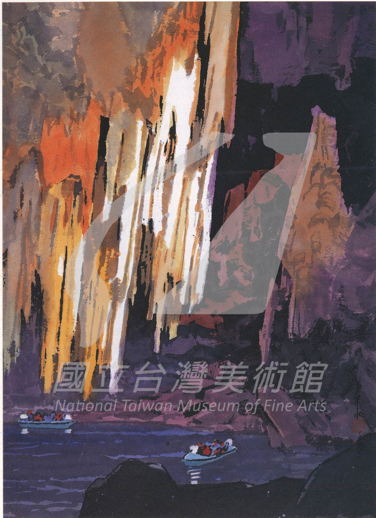
馬白水 本溪水洞 1991 彩墨·宣紙 62x46公分