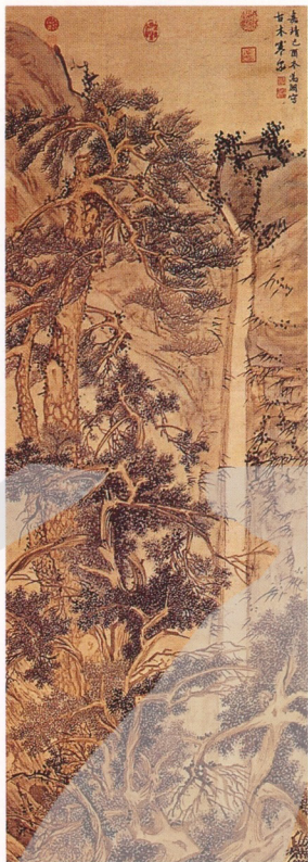
明 文徵明 古木寒泉 軸 絹本 194.1x59.3公分

●幾十年之後，面對這幅「古木寒泉圖」的複印本，馬白水還能記得當年邱壑一筆一筆為他點染時的情景，彷彿還在眼前。