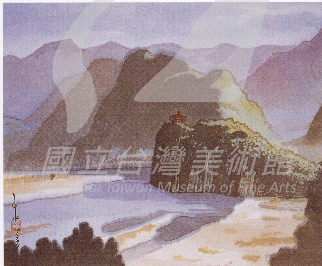
馬白水 本溪太子河 1991 彩墨·宣紙 46x61公分

片在四季裡逐漸變化著顏色的玉米田；那最初的召喚，也許只是一個精巧的六面體菸盒上的幾幅小小的花卉圖。啓蒙，是觸動也是開悟，對於少年馬白水來說，一生的志業從此開端。