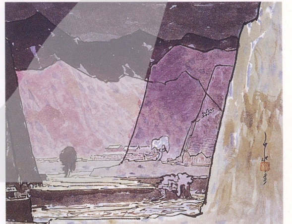
馬白水 山城溝之美 1991 彩墨·宣紙 41x51公分

● 李校長又創立了「奉天學院」，是一所新制的中等學校（含初、高中），由於未來更計劃發展成大學，所以以「學