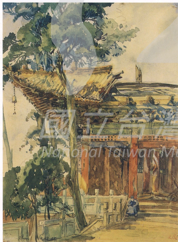
陳其寬 昆明文廟 1945 水彩 32×24公分

●抗戰勝利，在一片旗海翻騰中，陳其寬也光榮退伍。他回到南京，在中國第一代建築師關頌聲領導的基泰建築師事