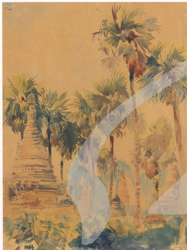
陳其寬 緬甸密支那 1944 水彩 32×24公分

●當盟軍光復緬甸密支那後，陳其寬隨著部隊由雷多到密支那，流覽城鎮風光，也畫了戰地密支那的寫生作品做為紀念。這個城一片廢墟被轟炸得焦土寸