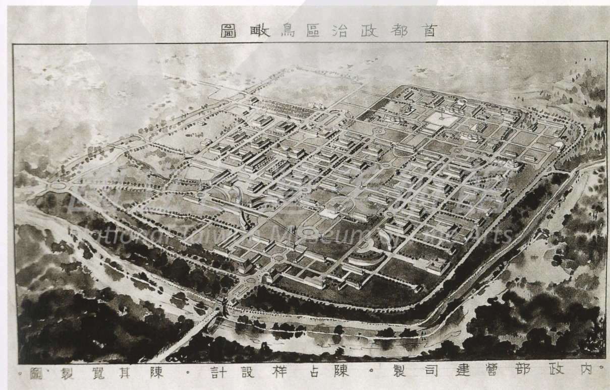
圖 製 覽 其 陳 。 計 設 祥 占 陳 。 製 司 建 營 部 政 內 。