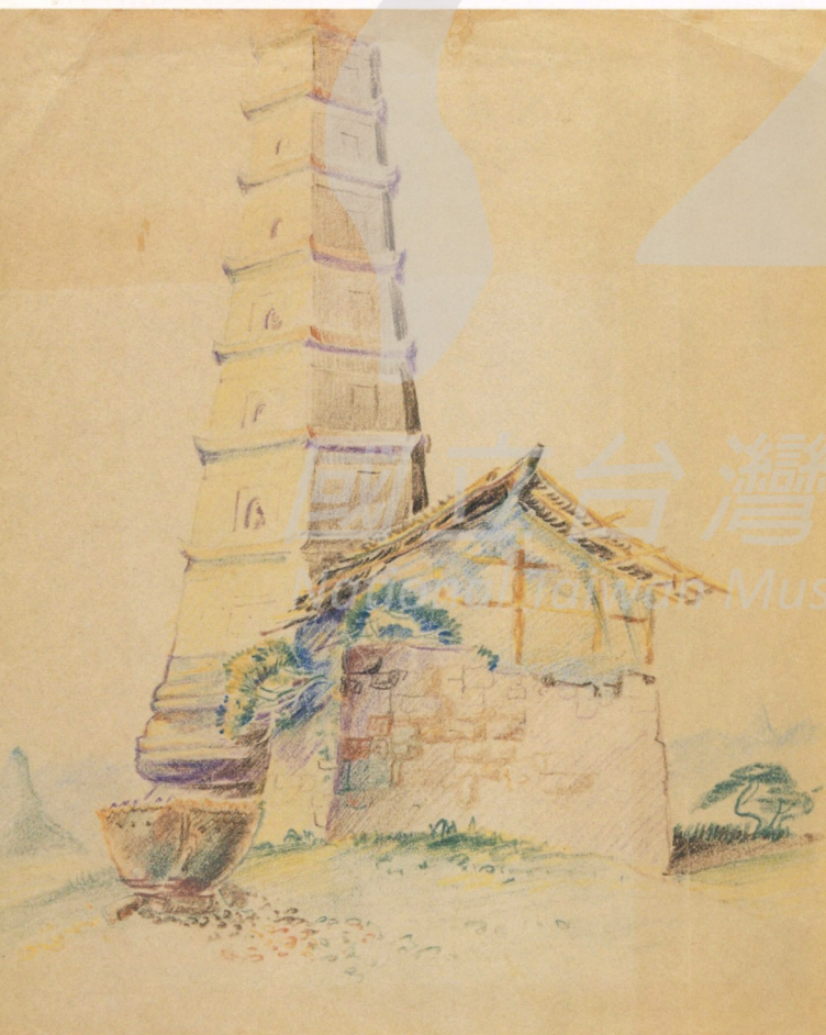
陳其寬 貴州佛塔 鉛筆速寫 22x17.7公分

●地處中國西南邊陲的雲南、貴州，境內崇山峻嶺，地勢險峻，卻擁有全中國最多的少數民族。陳其寬經過貴州，在西南山脈第一次遇到少數民族，一下子便被他們絢麗奪目的服飾給震懾住了。他隨手拿起彩色鉛筆畫了幾張「貴州苗族跳月服飾」（1944），高興萬分，原始、粗獷又充滿活力的民族，令他十分著迷。