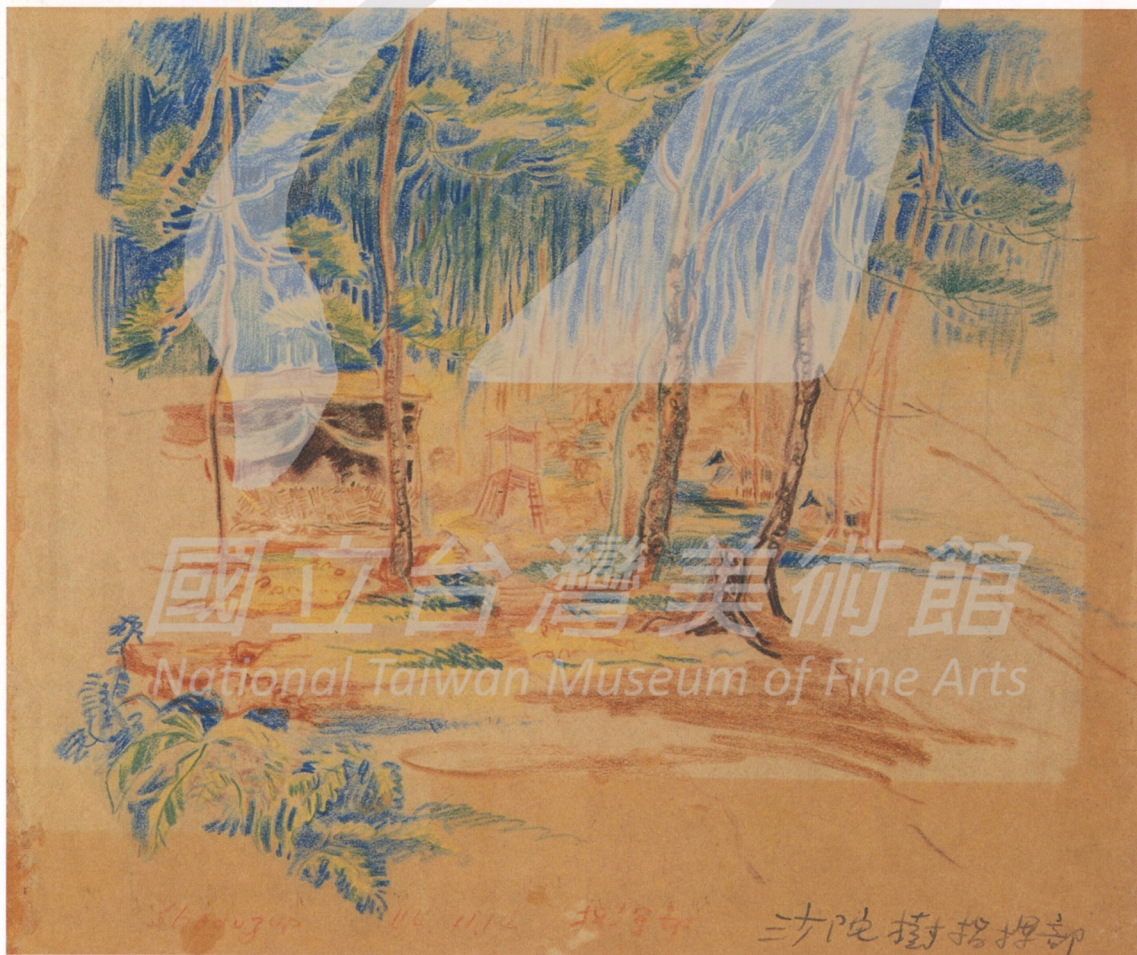
陳其寬 前進指揮部 1944 陳其寬在緬甸沙陀樹所畫的彩色鉛筆速寫。

譯一套釘馬蹄鐵的程序步驟，或許是登台機會多了，只見他配合美國獸醫的動作，翻得頭頭是道。天曉得，他根本完全聽不懂對方在說什麼，只是硬著頭皮，看著他的示範，自翻自的，那位英